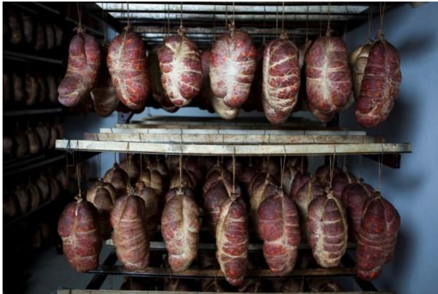
Slika 7. Sušenje kulena

stvaranja naslaga smole iz dima na površini. Dimljenje treba biti blago, hladnim dimom graba ( Carpinus sp. ), jasena ( Fraxinus sp. ) ili bukve ( Fagus sp. ). Za dimljenje je moguće koristiti drvo i/ili piljevinu navedenih vrsta drveća. U komori se kulen zadržava 12 dana i izgubi od početne težine 14 - 18% pri temperaturi 12 - 22 °C i relativnoj vlazi 76 - 92%.