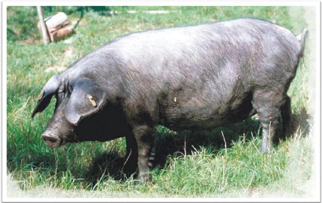
Slika 2. Crna slavonska svinja