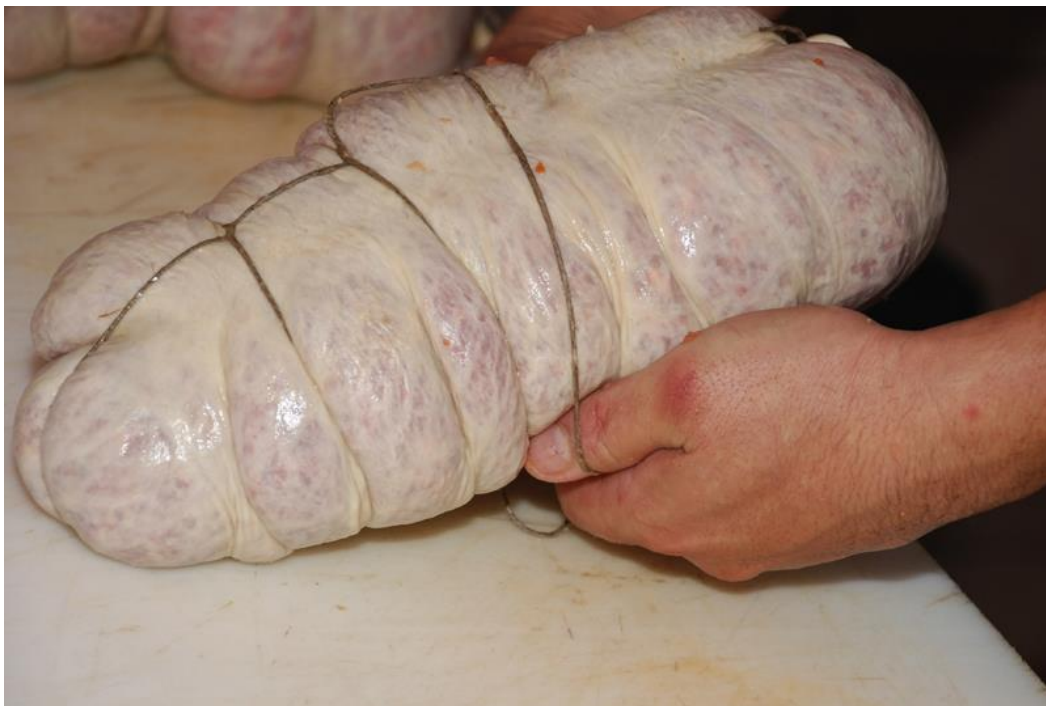
Slika 6. Šniranje