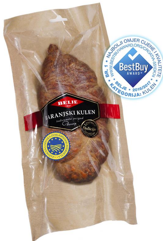
Slika 11. Baranjski kulen

Kada je tehnološki proces proizvodnje završen, najmanje nakon 90 dana, gotov proizvod se organoleptički ocjenjuje, važe, označava i pohranjuje u skladište gotovih proizvoda, gdje ostaje do otpreme. Baranjski kulen se može prodavati u cjelini kao čitava kobasica, ali i kao narezan. Proizvod će nositi naziv Baranjski kulen koji će biti označen tako da pored registriranog naziva ima vidljiv navod „oznaka zemljopisnog podrijetla“. Prilikom označavanja proizvoda koji se stavlja na tržište poštovat će se važeća zakonska regulativa (Kušec, 2012.).