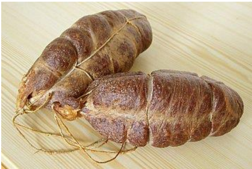
Slika 9. Pakiranje gotovog proizvoda

Gotovi proizvod s oznakom zemljopisnog podrijetla „Slavonski kulen“ ne smije se staviti na tržište prije završetka zadnje faze proizvodnje i prije nego što je certifikacijsko tijelo dalo suglasnost da je proizvod pogodan za izvoz na tržište i proizveden sukladno s pravilnikom. Proizvod se na tržište smije stavljati kao čitava kobasica, najmanje oko 900 grama, ili u komadima kao i narezani. Ukoliko je u komadima ili narezan u zatvorenim pakiranjima svako pakiranje mora biti označeno u skladu s odgovarajućim odredbama.