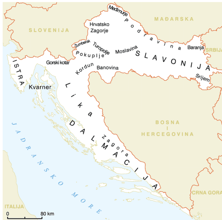
Slika 5. Zemljopisno područje Slavonije

Pretpostavlja se da proizvodnja „Slavonskog kulena“ / „Slavonskog kulina“ u Slavoniji započinje negdje početkom 18. stoljeća. Vjerojatno je nastao iz potrebe da se meso od klanja sačuva za kasniju potrošnju. Međutim, ne postoji pisani trag kako i kada se to desilo. Naziv kulen po prvi put u literaturi nalazimo prije više od 240 godina. Najstariji zapis u kojem se djelomično opisuje tehnologija proizvodnje kulena je star više od 100 godina. Sama riječ kulen vjerojatno potječe od staroslavenskog izraza KuLEN što znači nešto okruglo, nabreklo ili stisnuto od čega dolaze i druge izvedenice, trbuh, drob, želudac odnosno kulja. U narodu riječ kulen pretpostavlja nešto što je dobro napunjeno. Za debelog i trbušasta čovjeka odnosno za trudnu ženu kaže se da je kuljava (Kovačić i Karolyi, 2014.).