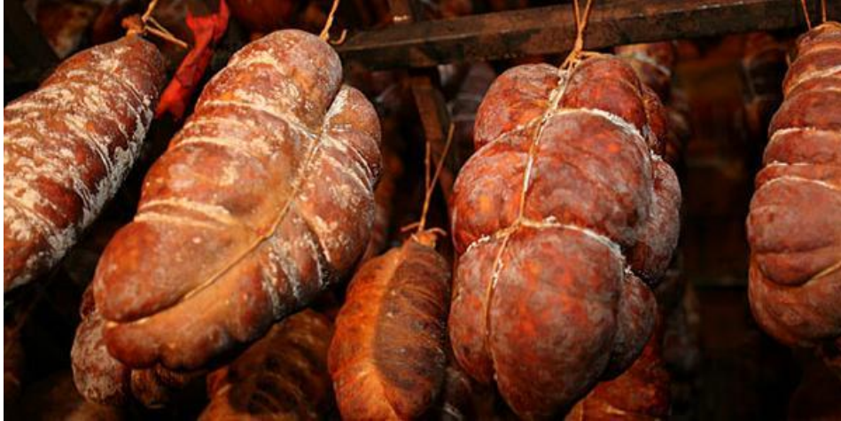
Slika 8. Pojava plijesni tokom zrenja

vlažnost zraka. Plijesni stvaraju nepoželjne crne, smeđe, bijele i zelene mrlje na površini, stvaraju neugodan miris i okus proizvoda, pogoduju razvoju truležnih bakterija i proizvode mikotoksine koji mogu predstavljati zdravstveni rizik za potrošače.