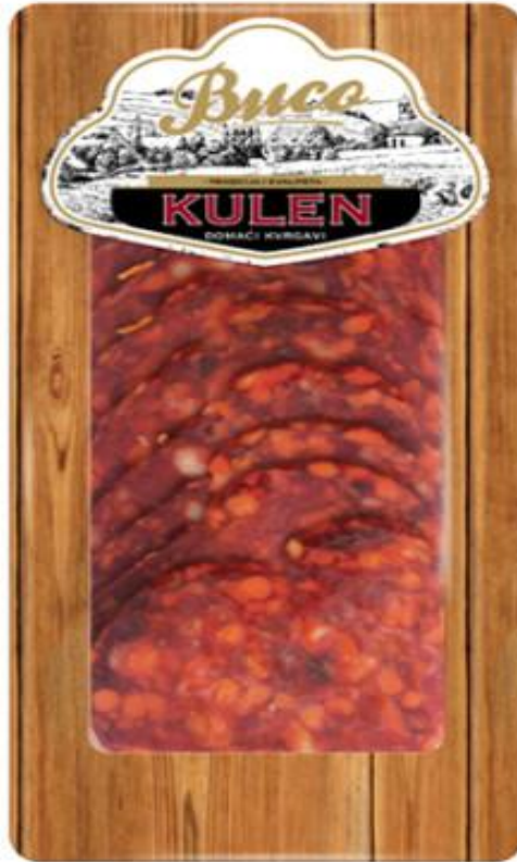
Slika 10. Zatvoreno pakiranje rezanog proizvoda