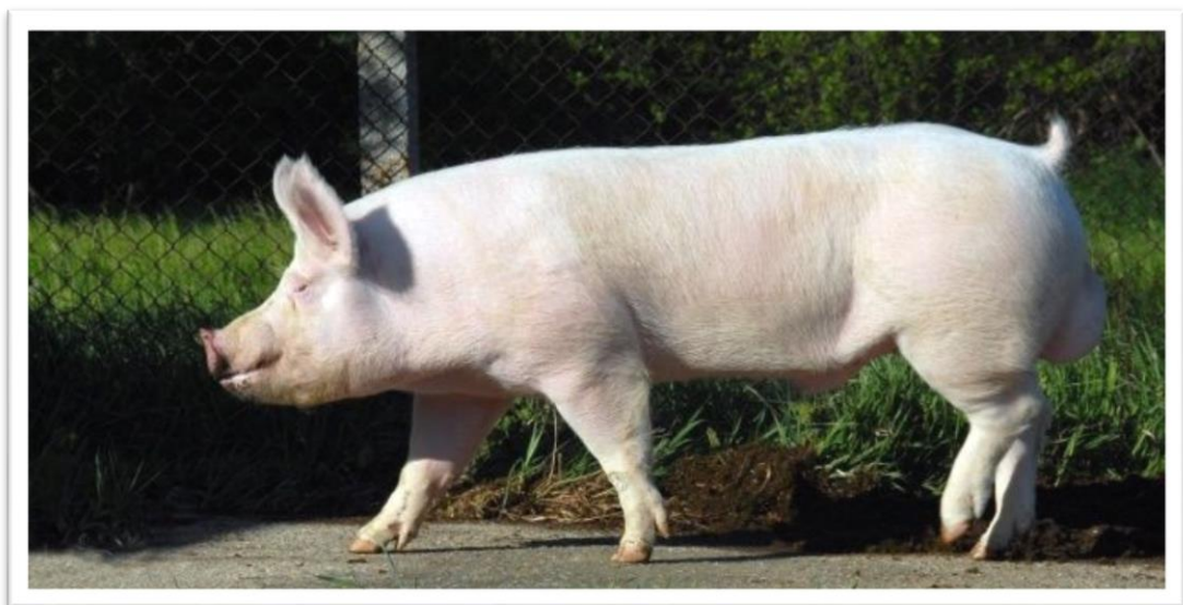
Slika 3. Veliki jorkšir

Ova plemenita, tipično mesnata, ranozrela pasmina nastala je u engleskoj pokrajini Yorkshire u 19. stoljeću. Prvi put se spominje 1868. godine ali je ranoj povijesti ove pasmine teško ući u trag. Prvi pisani dokument o ovoj pasmini datira iz 1884. godine. Veliki jorkšir je engleska visoko proizvodna, plemenita pasmina koje se zbog svojih odličnih tovnih svojstava raširila po čitavom svijetu i predstavlja jednu od osnovnih pasmina u stvaranju hibrida. To je pasmina s izrazito razvijenim stražnjim dijelom tijela. Butovi i plećke su dobro obrasle mišićnih tkivom te je karakterizira vrlo visok prinos. Plodnost joj je 10 do 12 prasadi i pripada skupini rano zrelih pasmina. Prosječna tjelesna masa kod prašenja je od 1,2 do 1,4 kilograma, a kod odbića sa 28 dana od 6 do 8 kilograma. U odrasloj dobi nerasti ove pasmine su teški i do 350 kg, a krmače 250 kg. Pri tovu postižu masu od 100 do 110 kg za 6 do 7 mjeseci uz iskorištenje hrane od 3 do 3,5 kg za kilogram prirasta. Ova pasmina je pogodna i za produženi tov do 150 kg te je za razliku od većine drugih plemenitih pasmina odlikuje dobra kvaliteta mesa i manja stres osjetljivost.