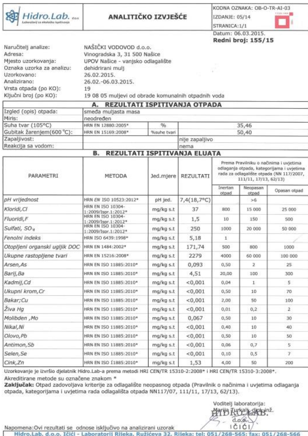
Slika 10 Izvješće analize dehidriranog mulja na UPOV Našice

(NN 117/2007, 111/11, 17/13, 62/13). Slika 10 predstavlja primjer izvješća analize dehidriranog mulja.