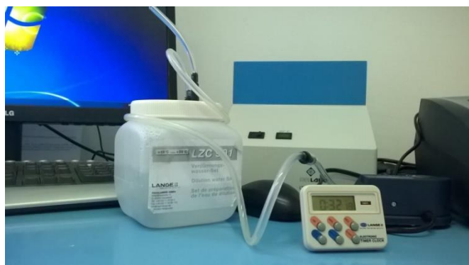
Slika 15 Boca za aeraciju vodovodne vode