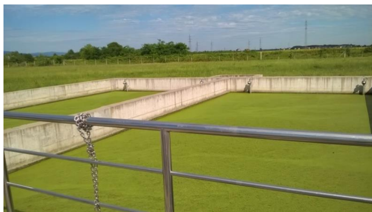
Slika 6 Miješano-taložni bazeni na UPOV Našice

Aeracijsko biološki bazen i miješano-taložni bazen su međusobno povezani te otpadna voda iz aeracijsko biološkog bazena prelazi u miješano-taložni ( Slika 6 ). Ovdje se događa sakupljanje i izdvajanje taložnih čestica koje padaju na dno, te sifonskim vodom dopijevaju u okno za povrat mulja gdje se uz pomoć mamut pumpi vraćaju u aeracijski biološki bazen. U aeracijsko biološkom bazenu se povratni mulj miješa sa ulaznom otpadnom vodom. MT bazen sadrži veću koncentraciju aktivnog mulja pri čemu u fazi mirovanja nastaju taložive flokule koje stvaraju filter kroz koji otječe pročišćena voda. U ovoj fazi prerade dolazi do procesa denitrifikacije tijekom kojeg se nitriti, u anoksičnim uvjetima, prevode u plinoviti dušik.