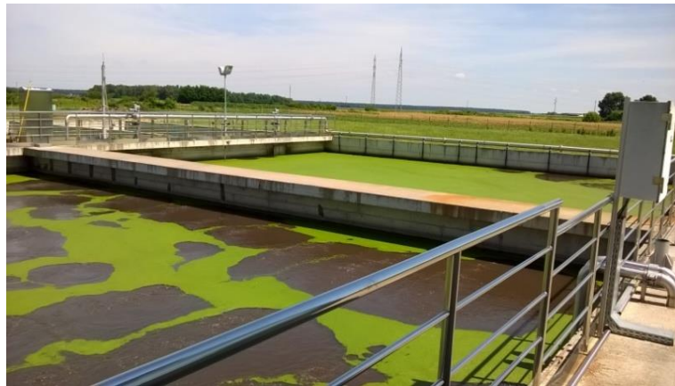
Slika 5 Aeracijski biološki bazen na UPOV Našice

organski dušik pretvoren u amonijak prevode u nitrite, te nakon toga u nitrate. Razgradnjom organskog onečišćenja nastaje nova količina biomase.