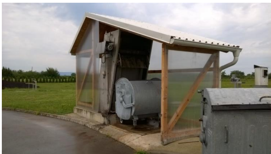
Slika 2 Gruba rešetka na UPOV Našice

Dolaskom otpadne vode na grubu rešetku ( Slika 2 ) slijedi uklanjanje krutih čestica većih od 25 mm, pri čemu se krupni otpad odvaja u kontejner od 1000 L. Pročišćena otpadna voda kojoj su uklonjene grube čestice dalje otječe putem kanalizacije u ulaznu crpnu stanicu.