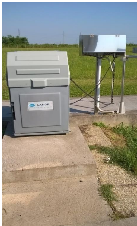
Slika 13 Uzorkivač izlaz na UPOV Našice

Početak tjedna rade se analize trenutnog uzorka linije 1 i linije 2. Dok je stabilan rad uređaja, tri puta tjedno se uključuju uzorkivači na ulazu i izlazu te se provodi kompletna analiza 24 h (kompozitnog) uzorka. Po završetku ulaznog uzorkivanja, ovisno o dotoku otpadne vode i kapacitetu uređaja, izračuna se vrijeme kada će ista voda izaći na izlazni uzorkivač ( Slika 13 ) te se on nakon tog vremena uključuje. U slučaju poremećaja rada uređaja zahtijevaju se svakodnevne analize sve dok se uređaj ne stabilizira. Da bi uređaj dobio status uređaja trećeg stupnja provodi se 12 analiza kompozitnog uzorka od strane ovlaštenog laboratorija. Ukoliko su analize zadovoljavajuće, godišnje se provode 4 puta od strane ovlaštenog laboratorija.