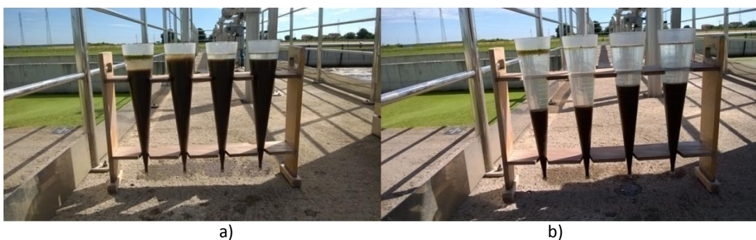
Slika 12 Mjerenje volumne koncentracije mulja: a) prije taloženja mulja b) poslije taloženja mulja

Početak tjedna rade se analize trenutnog uzorka linije 1 i linije 2. Dok je stabilan rad uređaja, tri puta tjedno se uključuju uzorkivači na ulazu i izlazu te se provodi kompletna analiza 24 h (kompozitnog) uzorka. Po završetku ulaznog uzorkivanja, ovisno o dotoku otpadne vode i kapacitetu uređaja, izračuna se vrijeme kada će ista voda izaći na izlazni uzorkivač ( Slika 13 ) te se on nakon tog vremena uključuje. U slučaju poremećaja rada uređaja zahtijevaju se svakodnevne analize sve dok se uređaj ne stabilizira. Da bi uređaj dobio status uređaja trećeg stupnja provodi se 12 analiza kompozitnog uzorka od strane ovlaštenog laboratorija. Ukoliko su analize zadovoljavajuće, godišnje se provode 4 puta od strane ovlaštenog laboratorija.