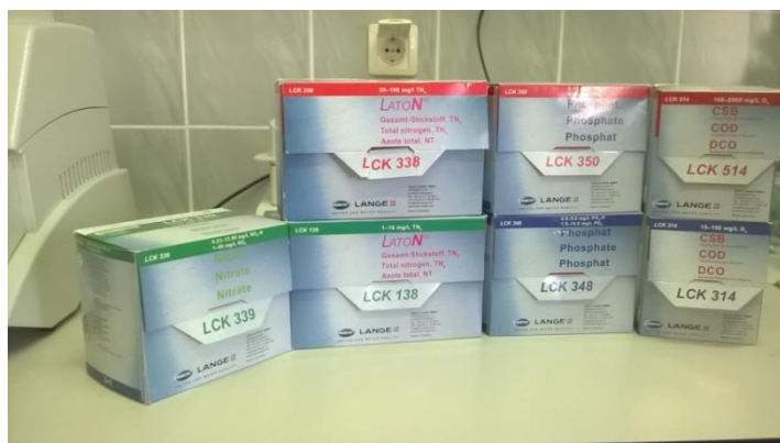
Slika 14 Kivetni testovi za mjerenje nitrata, ukupnog dušika, ortofosfata i KPK

Prije provođenja postupka mjerenja pojedinih parametara potrebno je adekvatno pripremiti uzorke za pojedine analize. Analize se provode na uređaju spektrofotometar DR 3900 HACH LANGE primjenom istoimenih kivetnih testova ( Slika 14 ).