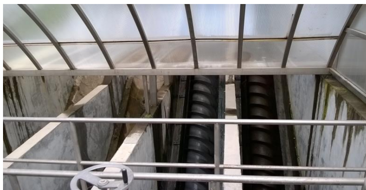
Slika 3 Arhimedove spiralne crpke ulazne crpne stanice na UPOV Našice

Ulazna crpna stanica sadrži dvije Arhimedove spiralne crpke ( Slika 3 ) pomoću kojih je moguće regulirati protok otpadne vode prije daljnje obrade, a koje su svaka kapaciteta 360 m 3 /h. Pomoću crpki voda se crpi u kinetu zgrade mehaničkog predtretmana za uklanjanje finih čestica.