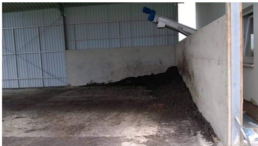
Slika 9 Dehidrirani mulj

Zbrinjavanje dehidriranog mulja predstavlja problem većine UPOV te se stoga provode analize njegovog sastava kako bi se utvrdilo zadovoljava li zahtjeve Pravilnika o načinima i uvjetima odlaganja otpada, kategorijama i uvjetima rada za odlagalište otpada