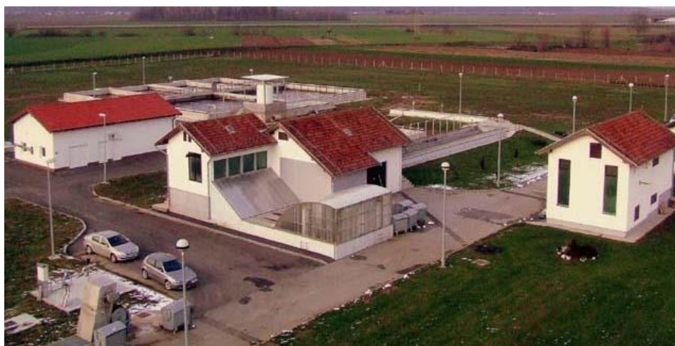
Slika 1 Uređaj za pročišćavanje otpadnih voda grada Našica

Nakon druge faze izgradnje, uz mehanički postupak pročišćavanja otpadnih voda, omogućena je i obrada biološkim i kemijskim putem što je postignuto 2011. godine.