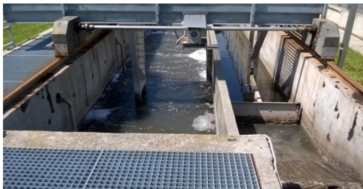
Slika 4 Pjeskolov i mastolov na UPOV Našice

Nadalje, otpadna voda kojoj su uklonjene fine čestice nastavlja se pročišćavati izvan zgrade na pjeskolovu i mastolovu ( Slika 4 ). Princip otklanjanja pijeska i masti iz otpadne vode temelji se na aeriranju pjeskolova i mastolova pri čemu se mast izdvaja na površini vode, dok se pijesak nataloži na dno kanala.