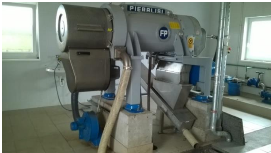
Slika 8 Centrifuga za dehidraciju mulja

Za obradu zraka koristi se kemijski filter koji se sastoji od nekoliko slojeva različitih aktivnih masa. Molekule koje uzrokuju neugodne mirise, kada stignu u kontakt s aktivnom masom, neutraliziraju se i oksidiraju. Ovaj filter osigurava više od 96% uklanjanja onečišćenja u zraku, a koristi se i u zgradi mehaničkog predtretmana.