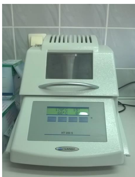
Slika 16 Termostat HT 200S

Za provođenje postupka određivanja KPK koriste se kivetni testovi LCK 214 te LCK 514. Analiza uzorka ulaz provodi se kivetnim testom LCK 514, dok se za uzorak izlaz upotrebljava kivetni test LCK 314. Prije upotrebe navedenih testova potrebno je homogenizirati uzorak. Nakon navedenog postupka uzorak se stavlja na zagrijavanje u uređaj u Termostatu HT 200S (Slika 16). Vrijednost na spektrofotometru očitava se nakon 15 min zagrijavanja i 15 min stajanja uzorka na sobnoj temperaturi.