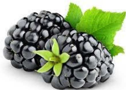
Slika 1. Kupina ( http://www.coolinarika.com , 15.10.2016.)