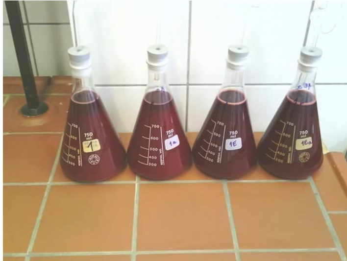
Slika 3. Procijeđeno kupinovo vino nakon maceracije

Daljnja fermentacija provedena je pri sobnoj temperaturi tijekom 8 dana. Po završetku fermentacije mlado kupinovo vino iz tikvica pretočeno je (odekantirano je vino s taloga) u nove tikvice te je u svaku tikvicu dodano 8 % bijelog konzumnog šećera na volumen vina u tikvicama. Osim šećera, u tikvice je također dodan K_2S_2O_5 (10 g / hL preračunato na volumen vina u tikvici nakon pretakanja) te sredstvo za bistrenje (pentagel, 10 g / hL preračunato na volumen vina u tikvici nakon pretakanja). Tikvice su zatim prenesene u hladnjak, gdje su 4 dana čuvane na 2 °C kako bi se vino što bolje izbistilo. Nakon toga, izbistreno vino pretočeno je u tamne boce te ostavljeno da zrije i odležava u hladnjaku na 5 °C do provođenja analiza. Tijekom odležavanja, vino je u dva navrata pretakano.