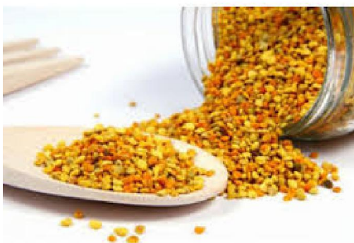
Slika 5. Pelud

Rok trajanja svježeg peluda jest jedna godina, a umiješanog u med dvije godine (Pravilnik o kakvoći meda i drugih pčelinjih proizvoda, 2000.).