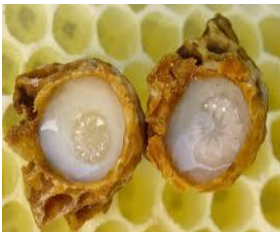
Slika 2. Sirova matična mliječ

Rok trajanja matične mliječi u izvornom obliku jest jedna godina, a u liofiliziranom obliku dvije godine (Pravilnik o kakvoći meda i drugih pčelinjih proizvoda, 2000.).