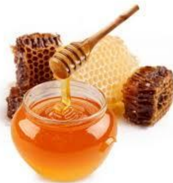
Slika 1. Med

Med je hrana i u najvećoj se mjeri koristi kao zaslađivač, odnosno kao zamjena za druge vrste zaslađivača, poput konzumnog šećera (saharoze), fruktoze i drugih.