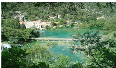
Slika 1. Objekti izvorišta Jaruga na području Nacionalnog parka Krka Fig. 1. Facilities at the source Jaruga in the National Park Krka

Voda za šibenski vodoopskrbni sustav kojim upravlja tvrtka Vodovod i odvodnja d.o.o. iz Šibenika, zahvaća se na pet izvorišta i to: Jaruga, Torak, Jandrići, Kovča i Miljacka. Prema količini zahvaćene vode, odnosno s kapacitetom crpljenja od 1000 L/s, glavno izvorište je izvorište Jaruga koje se nalazi na području Nacionalnog parka Krka (Slika 1), a sastoji od tri crpne stanice, Jaruga I, Jaruga II i Jaruga III. Ostala navedena izvorišta s ukupnim kapacitetom crpljenja vod od 235 L/s koriste se samo u vrijeme povećane potrošnje vode, odnosno tijekom ljetnih mjeseci (Marguš, 2002; Jurković, 2016). Nakon zahvaćanja, voda se glavnim cjevovodom dovodi u pogon tvrtke Vodovod i odvodnja d.o.o. Šibenik gdje se kondicionira metodom filtracije i dezinfekcije kako bi kakvoća vode bila u skladu s odredbama Pravilnika o parametrima sukladnosti i metodama analize vode za ljudsku potrošnju (MZ HR, NN 125/13, 141/13, 128/15). Prosječna količina isporučene vode za ljudsku potrošnju dnevno iznosi 55000 m 3 /dan.