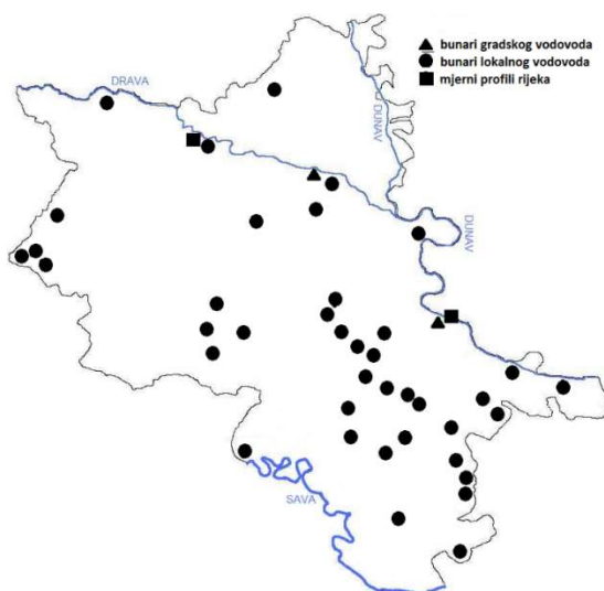
Slika 1. Geografski položaj lokacija uzorkovanja Fig. 1. Spatial positions of sampling locations

Uzimanje uzoraka tijekom promatranog razdoblja obavljeno je na isti način i to prema normi HRN EN ISO 5667:2-11. Određivanje koncentracija kalcija, magnezije i natrija provedeno je ionskom kromatografijom primjenom metode HRN EN ISO 14911:2001, na uređaju ICS-3000 (Dionex, SAD). Uređaj se sastoji od dual-pump gradijent pumpi, eluent generatora, modula u kojem se nalaze injektorski ventil s petljom kroz koju prolazi uzorak, predkoloni, koloni, supresora i konduktometrijskih detektora, te AS 40 autoinjektora. Karakteristike uređaja su prikazane u Tablici 1, a osnovni pokazatelji korištenog sustava u Tablici 2. Nakon analize podaci su prikupljeni i obrađeni na računalnom sustavu s instaliranim softwareom Chromeleon Chromatography Workstation, verzija 6.8.