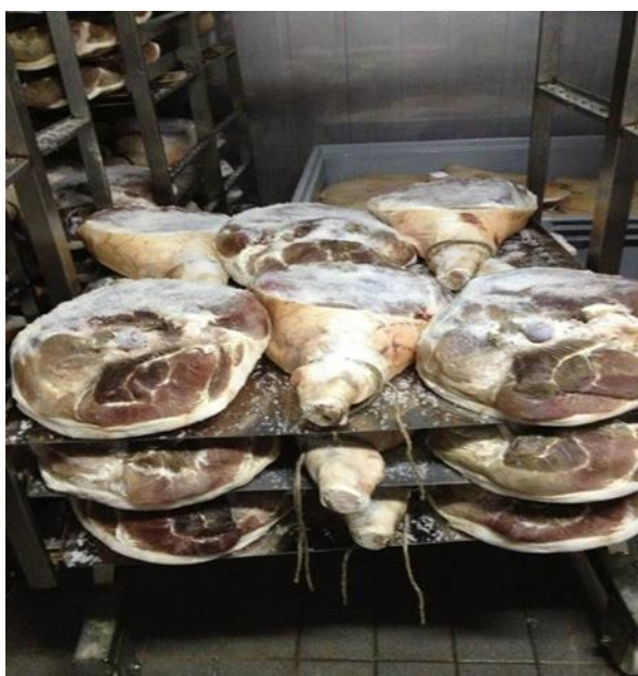
Slika 3. Prešanje usoljenog pršuta (Kušurin, 2014.)

Prešanje se provodi kako bi se provelo dobro cijedenje vode i masnog soka. Postupkom prešanja dolazi do oblikovanja koji je pogodan za narezivanje. Postupak se provodi na mramornim ili drvenim stolovima. Slaže se 6 butova po m 2 . Mesnati dio buta okreće se prema stolu i na samom početku opterećenje je nešto manje kako ne bi došlo do nagle deformacije i oštećenja te se opterećenje postupno povećava (Károly, 2015.).