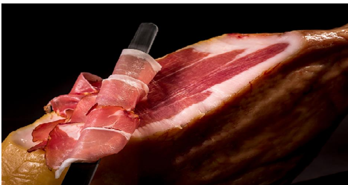
Slika 5. Presjek Hercegovačkog pršuta (Anonymous 2, 2020.)

Pršut je trajni suhomesnati proizvod koji se odlikuje specifičnom aromom, blagim slanim okusom, jednoličnom crvenom bojom mesa i poželjnom konzistencijom. Vanjski izgled mora biti pravilnog oblika, bez velikih nabora, zarezotina, pukotina i visećih dijelova kože i mišića. Kod presjeka potkožno masno tkivo trebalo bi biti bijele do ružičasto-bijele boje, a mišićno tkivo crvene do svijetlo crvene boje s vidljivim intramuskularnim masnim tkivom (mramoriranost), optimalna količina intramuskularnog masnog tkiva je 1,5-3,5 %. Nije dozvoljena pretjerana slanoća, niti gorak, kiseo i nedefiniran okus, nego je potreba ujednačenost, blaga slanost. Miris bi trebao imati ugodnu aromu na usoljeno, suho, fermentirano i dimljeno svinjsko meso, te je nedozvoljena prisutnost stranih mirisa poput katrana, nafte i dr. koje bi mogle nastati tijekom dimljenja. Prilikom žvakanja nije dozvoljena pretjerana tvrdoća, ljepljivost, niti minimalna topljivost, dok je poželjna mekana konzistencija i sočnost. Nije poželjna pretjerana prisutnost blijedo bijelih kristalića tirozina koje mogu smanjiti ocjenu prilikom ocjenjivanja i stvoriti neugodan osjećaj prilikom žvakanja.