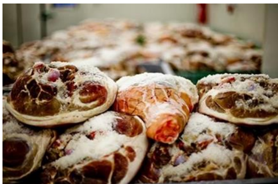
Slika 2. Soljenje butova (Kušurin, 2014.)