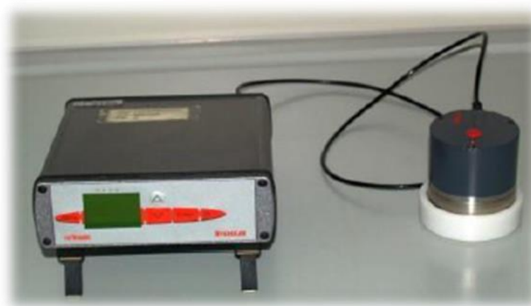
Slika 7. HygroLab 3 – Multi-channel Humidity Water Activity Analyser

Aktivitet vode označava količinu vode koju mikroorganizmi mogu koristiti kako bi rasli i provodili biokemijske reakcije. Povećanjem koncentracije otopljenih tvari, odnosno smanjenjem aktiviteta vode usporava se ili inhibira rast mikroorganizama. Određivanje aktiviteta vode provodilo se pomoću uređaja HygroLab 3- Multi-channel Humidity & Water Activity Analyser (ROTRONIC), pri sobnoj temperaturi od 20 \pm 2 °C.