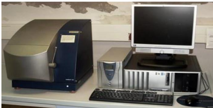
Slika 8. FoodScan Meat Analyser

Određivanje udjela bjelančevina, kolagena, ukupnih masti i vode provedena je pomoću uređaja FoodScan Meat Analysera . Određivanje je vršeno prema AOAC metodi 2007.4 (AOAC, 2007.).