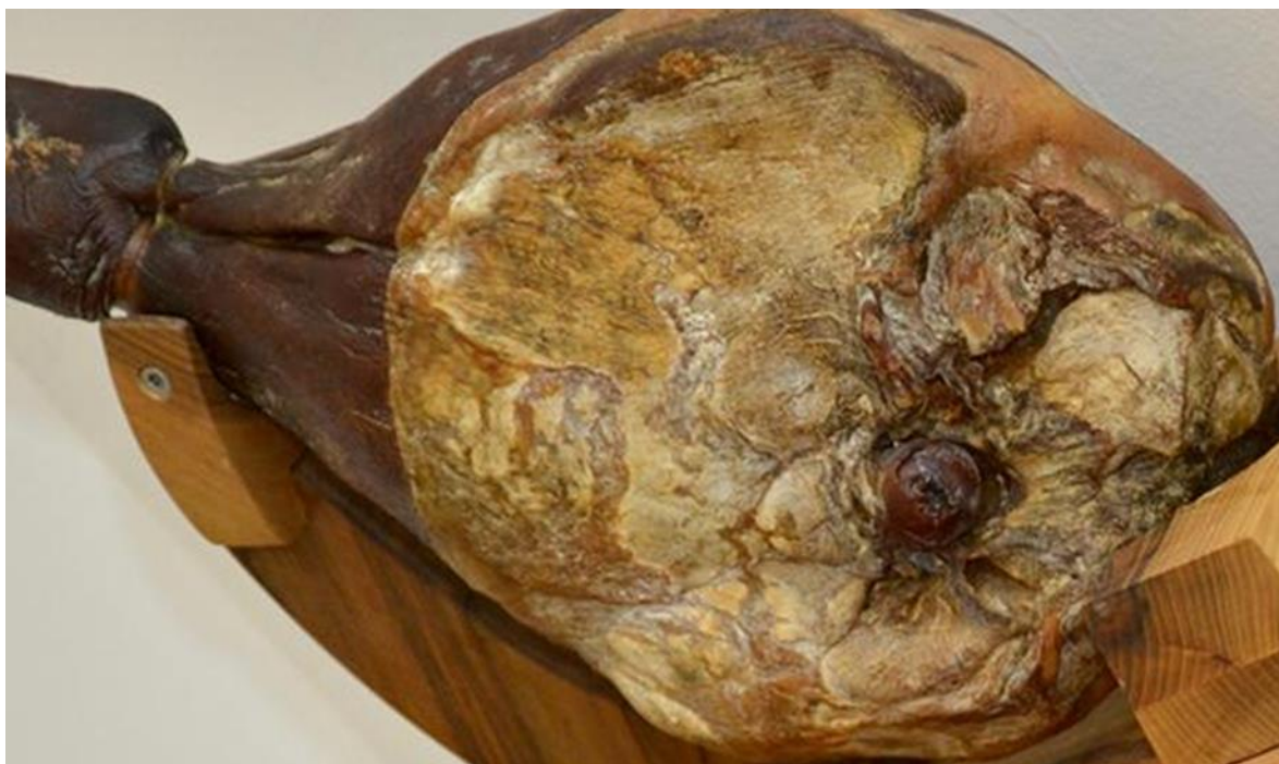
Slika 4. Prikaz gotovog pršuta (Anonymous 1, 2020.)

Nakon faze dimljenja i sušenja pršuti se premještaju u komore ili podrumske prostorije sa stabilnom mikroklimom i otvorima za izmjenu zraka zbog pravilnog odvijanja procesa proizvodnje. Svi otvori moraju biti zaštićeni mrežom kako bi se zaštitio pogon od ulaska kukaca, glodavaca i drugih nametnika. Prilikom odvijanja procesa potrebno je prilagoditi temperaturu i relativnu vlažnost zraka. Temperatura za zrenje ne bi trebala prelaziti 20 °C, a relativna vlažnost zraka trebala bi biti oko 70 %. U takvim uvjetima pršuti ravnomjerno gube vlagu i pravilno zriju. Tijekom zrenja dolazi do odvijanja raznih procesa u kojima dolazi do niza biokemijskih reakcija proteolize i lipolize pri čemu dolazi do nastajanja hlapljivih spojeva koji daju specifičnu aromu, ali i boju pršuta. Tijekom zrenja dozvoljeno je popunjavati pukotine pršuta smjesom napravljenom od usitnjenog svinjskog sala pomiješanog s pšeničnim ili rižinim brašnom uz dodatak soli. Zrenje je dugotrajan proces koji može trajati od 3 do 12 mjeseci, a kalo iznosi cca. 35 %. Ukupan proces proizvodnje koji uključuje sve faze trebao bi trajati minimalno 9 mjeseci (Krvavica i sur., 2006.).