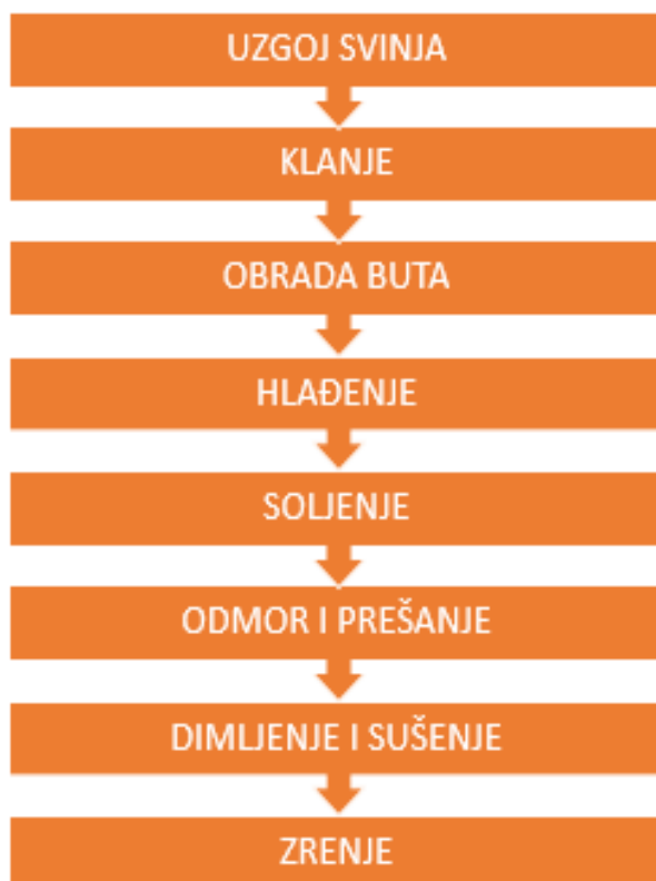
Slika 1. Osnovne faze proizvodnje pršuta

Osnovne faze proizvodnje pršuta obuhvaćaju: