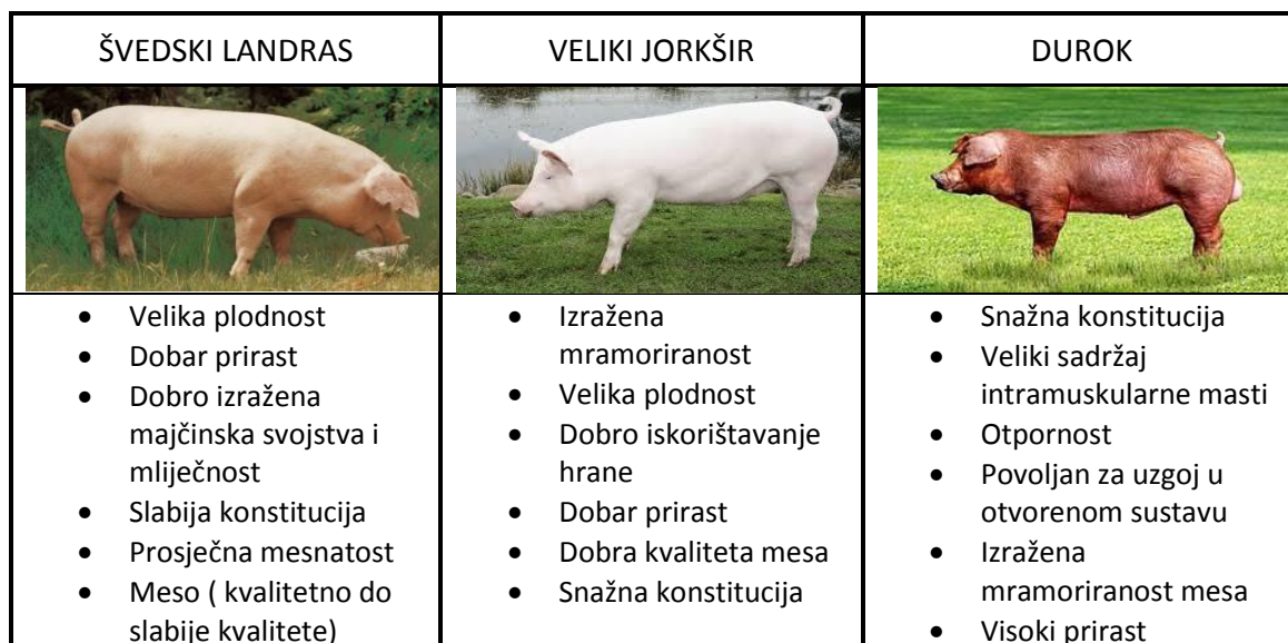
Tablica 1. Osobine pasmina svinja (Kovačević, 2016.)

Pasminu Pietren nije preporučljivo koristiti zbog izrazite mesnatosti, te se ne bi trebali koristiti niti hibridne pasmine svinja zbog stvaranja BMV (blijedo, mekano, vodnjikavo) mesa.