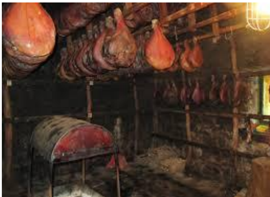
Slika 3. Komora za dimljenje Dalmatinskog pršuta