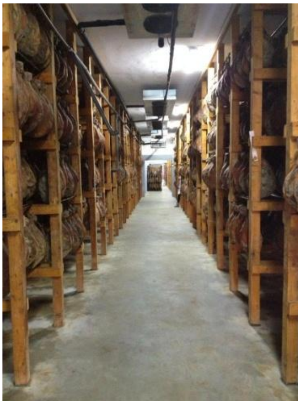
Slika 8. Zrenje pršuta

Odvijanje faze zrenja događa se u zamračenim prostorijama s pravilnom i blagom promjenom zraka. Nakon godinu dana od dana početka soljenja pršut je zreo i spreman za konzumiranje.