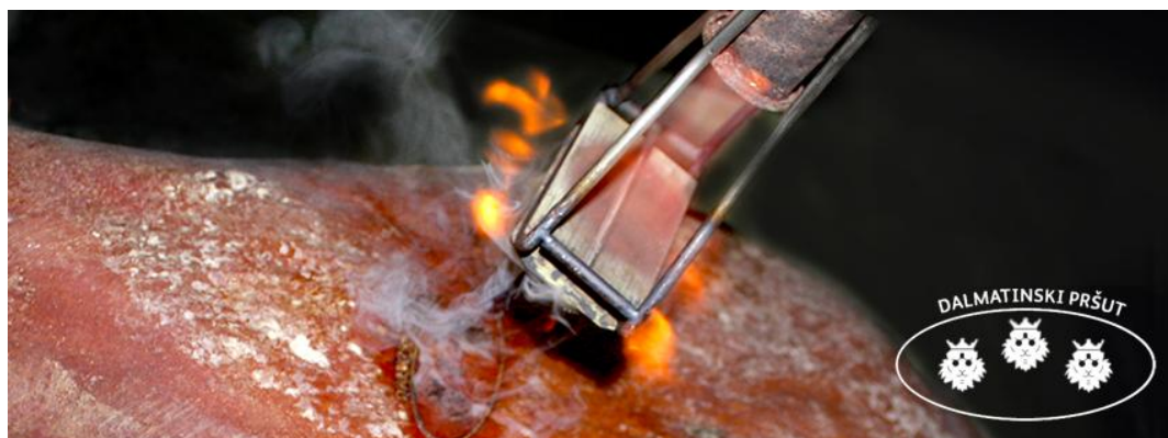
Slika 10. Žig Dalmatinskog pršuta

Zajednički znak Dalmatinskog pršuta ima ovalni oblik pečata unutar kojeg se nalaze tri lavlje glave, a na gornjem vanjskom obodu piše „Dalmatinski pršut“. Zajednički znak se po završetku faze zrenja nanosi kao vrući žig na kožu onih pršuta za koje je ovlašteno tijelo utvrdilo da su proizvedeni u skladu s specifikacijom i posjeduju sva potrebna fizikalno-kemijska i senzorska svojstva.