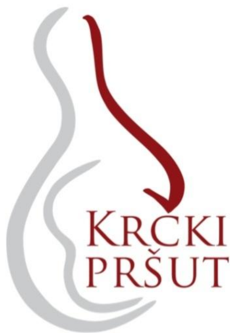
Slika 13. Žig Krčkog pršu