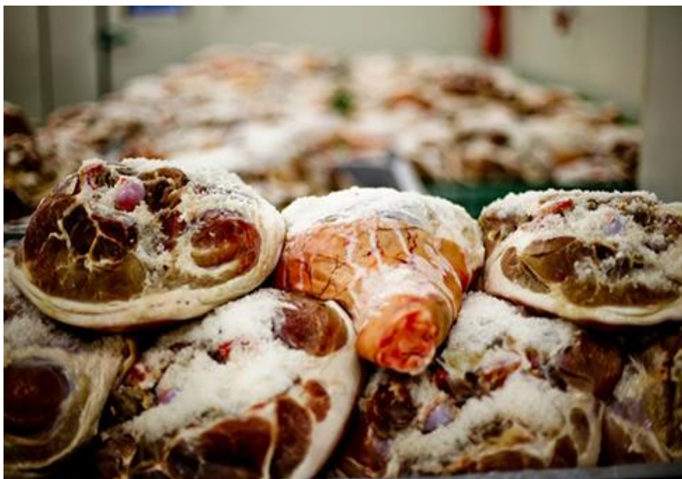
Slika 5. Soljenje Dalmatinskog pršuta

Brzo i ravnomjerno prodiranje soli u mišićje buta ima izvanredan značaj za kakvoću gotovog proizvoda. Vrlo je važno da butovi imaju istu temperaturu ( 1 - 4 °C), jer jako hladni butovi apsorbiraju manje soli, a nedovoljno ohlađeni imaju tendenciju kvarenja. Dalmatinski pršut se može soliti samo morskom soli, tj. uz sol se ne smiju koristiti začini. U proizvodnji ovog pršuta nisu dozvoljeni nikakvi konzervansi niti aditivi. Obrađeni butovi dobro se natrljaju po cijeloj površini sa suhom soli i te se ostave ležati s medijalnom stranom okrenutom prema gore. Nakon 7 - 10 dana potrebno je butove ponovo natrljati po cijeloj površini suhom soli i ostaviti ih idućih 7 - 10 dana na ležanju s medijalnom stranom okrenutom prema dolje.