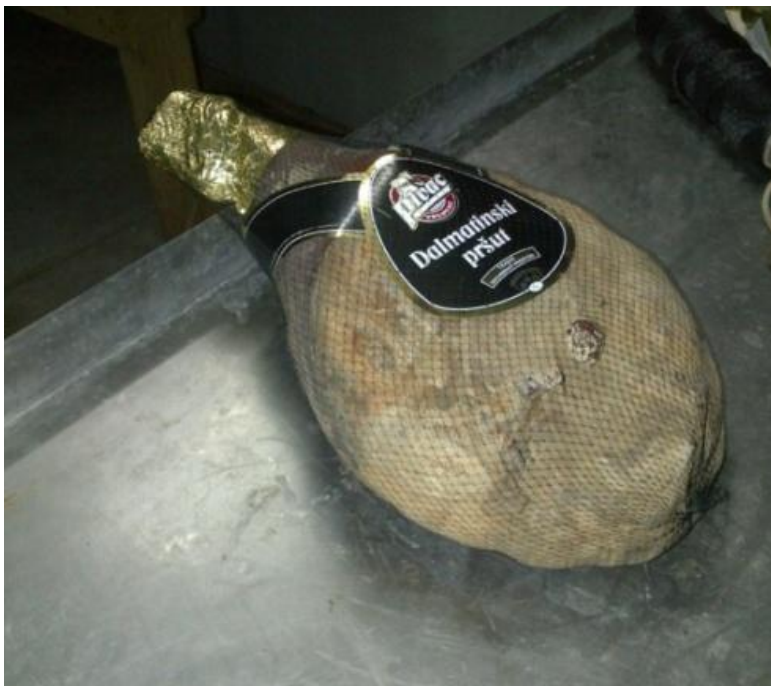
Slika 9. Upakiran Dalmatinski pršut