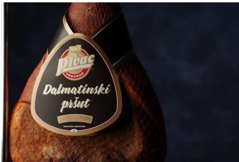
Slika 1. Dalmatinski pršut