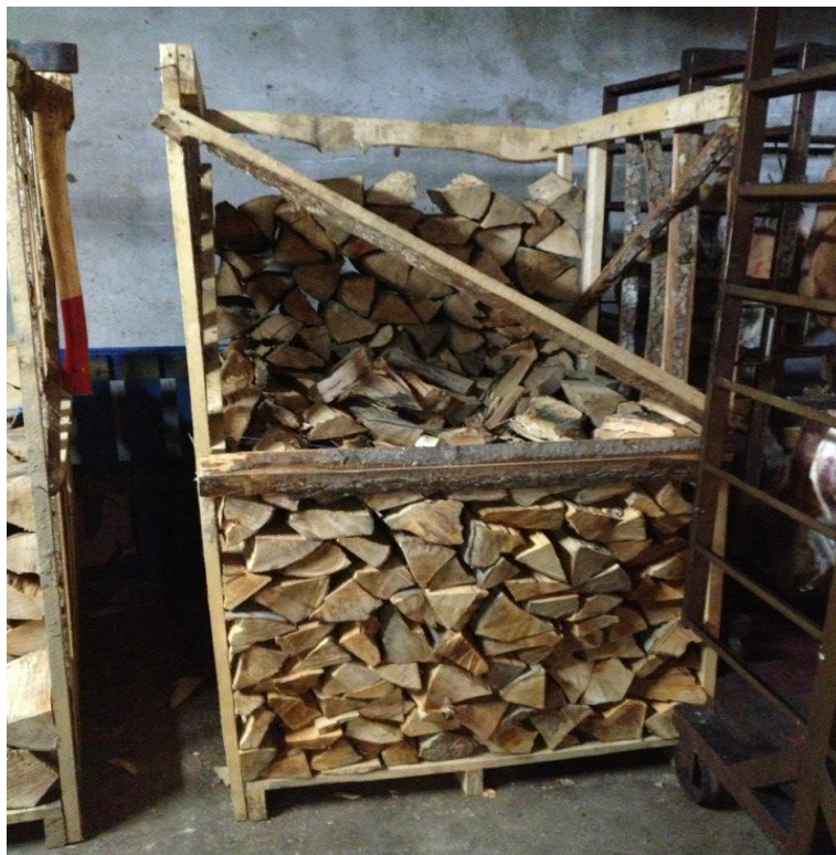
Slika 2. Drva za dimljenje Dalmatinskog pršuta