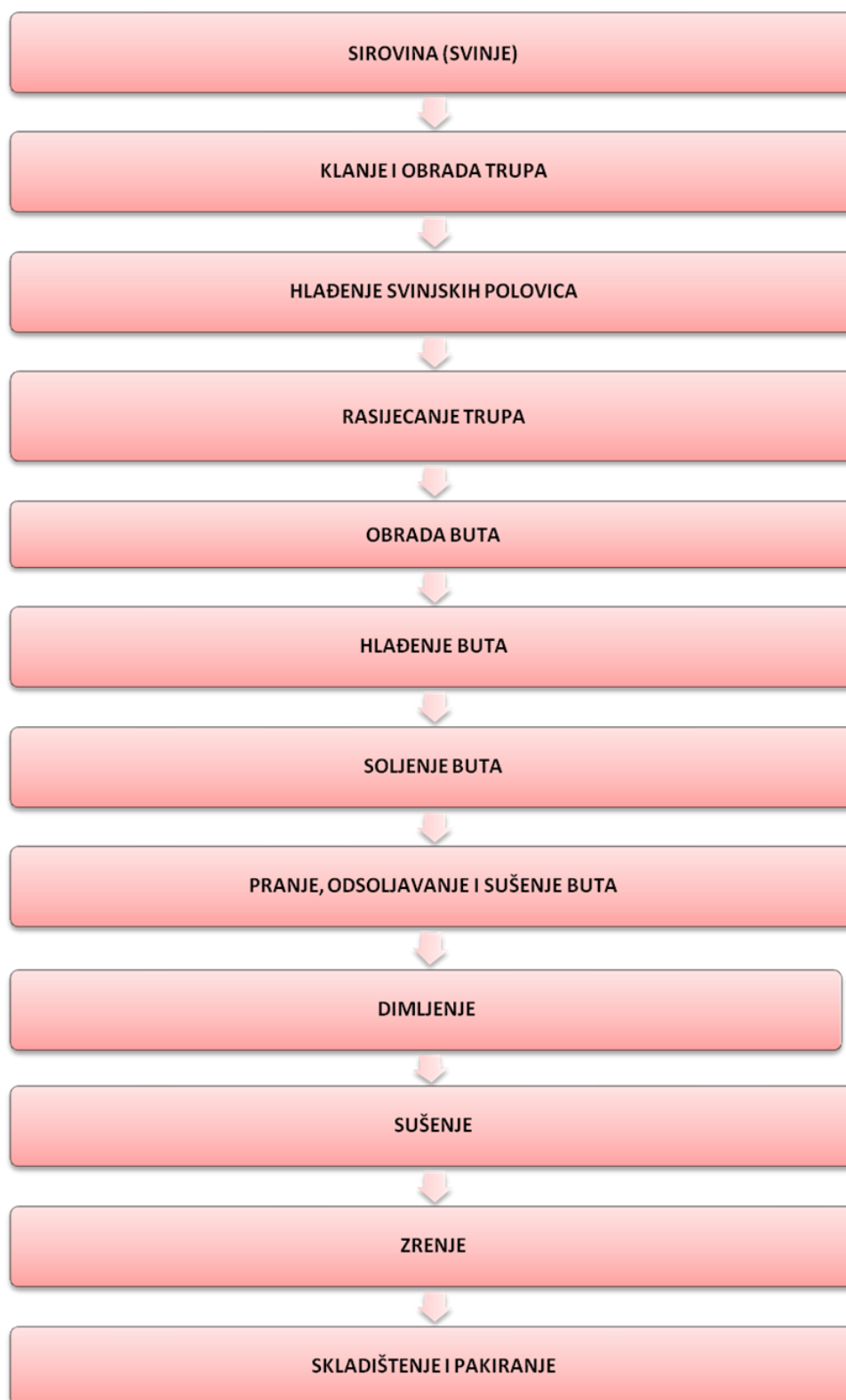
Slika 4. Blok shema tehnologije proizvodnje Dalmatinskog pršuta