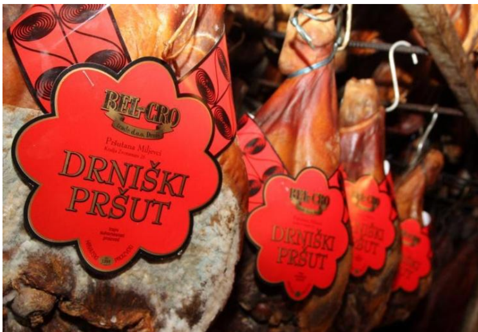
Slika 12. Drniški pršut

krugova pletera kape kao prepoznatljiv simbol Drniškog kraja te kao oznaka vrhunske kvalitete - 5 krugova kao 5 zvjezdica.