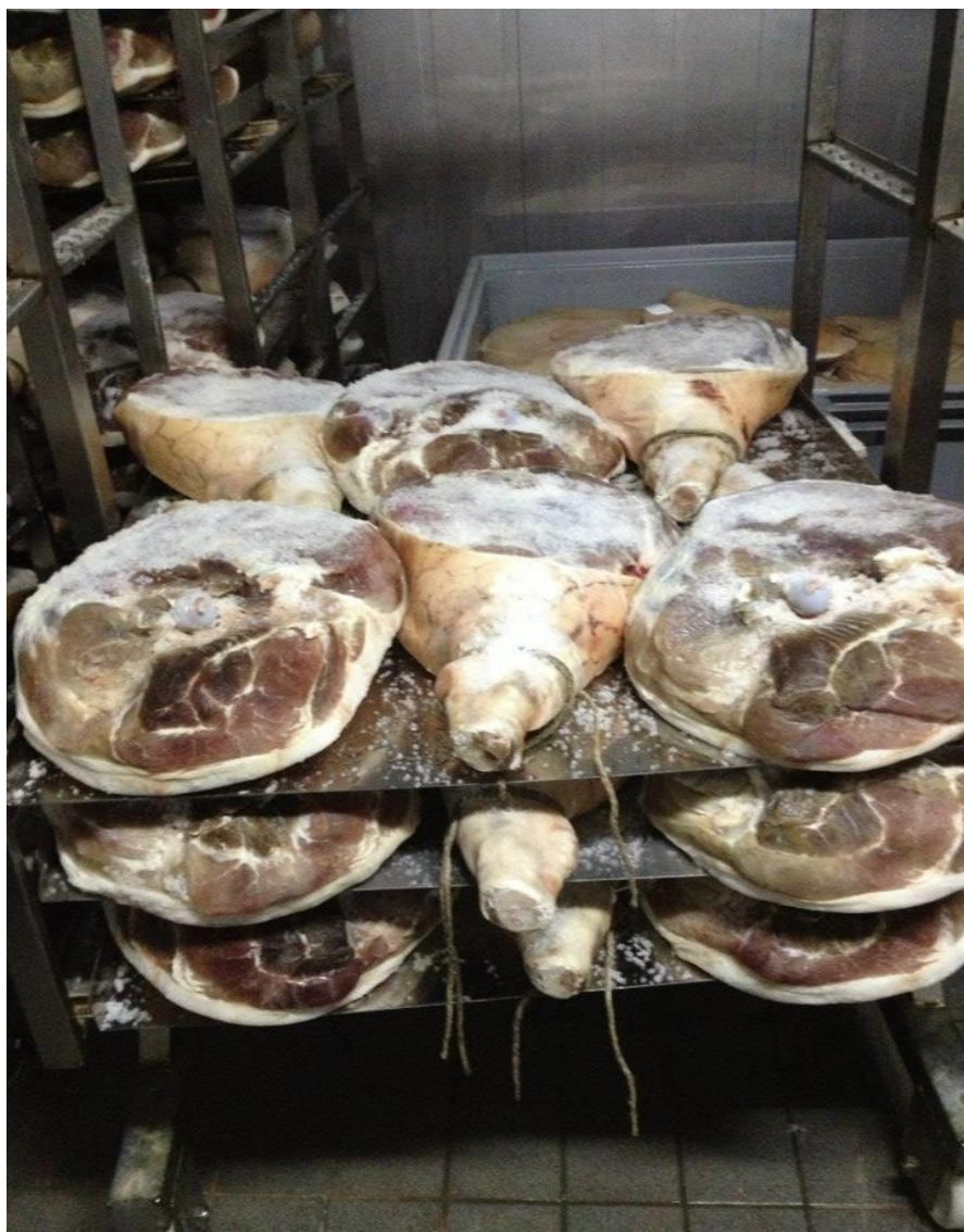
Slika 6. Prešanje Dalmatinskog pršuta

preskoči faza prešanja nakon soljenja u periodu 14 - 20 dana, ostave se još 7 - 10 dana bez preslagivanja, te se tek onda ispiru i cijede. Kao i kod soljenja temperatura je određena i za fazu prešanja i mora iznositi 2 - 6°C, a relativna vlaga zraka mora također biti viša od 80%.