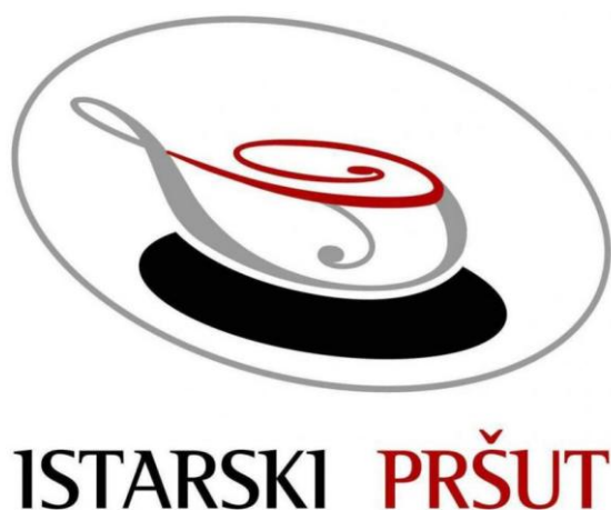
Slika 11. Žig Istarskog pršuta

Zajednički žig istarskog pršuta grafički je također različit od žiga Dalmatinskog pršuta. Žig predstavlja stilizaciju otvorenog pršuta na pladnju, u položaju za narezivanje. Tijelo pršuta je sive boje, gornji otvoreni dio i riječ „pršut“ su crvene boje, a pladanj i riječ „Istarski“ su crne boje.