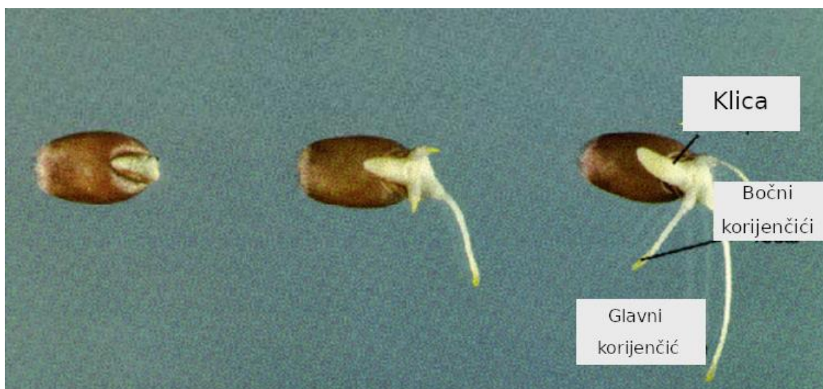
Slika 3 Prikaz klijanja pšeničnog zrna (Bewley, 1985.)

normalnog razvitka embrija u klijalištu zrna potrebno je omogućiti upuhivanje zraka određene temperature koja je obično 2°C niža od temperature zrna i relativnu vlažnost zraka od 70% do 90%. Proizvod procesa klijanja ili germinacije zove se zeleni slad (Narziss, 1999.)