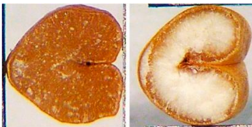
Slika 2 Prikaz presjeka staklavog (lijevo) i brašnavog (desno) zrna (Baasandorj i sur., 2015.)

zrno je staklavo i sadrži više proteina. Jezgre koje izgledaju poput stakla i prozirne su nazivaju se staklastim, dok se jezgre koje nemaju prozirnost ili su svijetle, neprozirne, nazivaju nestaklastima, škrobastima ili brašnastima. Staklave jezgre se osim s većim sadržajem proteina povezuju i s većom sposobnošću upijanja vode. U staklastom endospermu adhezija između škrobnih granula i skladišnih proteina mnogo je jača u usporedbi sa škrobnim (brašnastim) endospermom, što dovodi do čvršće zbijene strukture. Čimbenici koji utječu na svojstva staklastog zrna pšenice su nasljedstvo, vremenske prilike, obrada tla i gnojidba. Međutim, staklastost je uglavnom kontrolirana dostupnošću dušika kao i temperaturom tijekom razdoblja rasta zrna (Baasandorj i sur., 2015.).