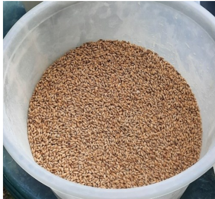
Slika 1 Ječmeni slad

1996). Tradicionalno, pivari su sami pripremali svoj slad, no danas većina njih kupuje slad (Aasen, 2020).