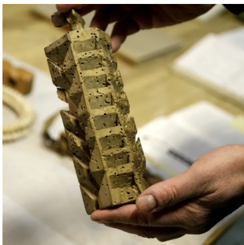
Slika 3 Drvena cjepanica za kveik kvasac

Tradicionalno, kveik kvasci čuvali su se tako da se velika drvena cjepanica uroni u posudu gdje se odvija fermentacija i stavi se sušiti. Potrebno je osigurati veliku površinu cjepanice da na njoj zaostane što veća količina kvasca ( Slika 3 ). Još jedan način čuvanja kveik kvasaca, koji se pokazao najboljim, podrazumijeva postupak sušenja te zamrzavanja ( Slika 4 ). Međutim, najlakši način skladištenja kvasca je čuvanjem u staklenci u hladnjaku (Aasen, 2020).