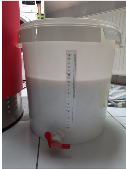
Slika 7 Pretakanje sladovine u posudu za fermentaciju (vlastita arhiva)

Tijekom ovog procesa, fermentabilni šećeri nastali tijekom ukomljavanja prevode se u alkohol i CO 2 . Fermentacija traje sve dok se flokule kvasca ne istalože na dno ili isplivaju na površinu. Završetak fermentacije se može pratiti i preko postotka koji pokazuje koliko šećera je prešlo u alkohol (Aasen, 2020). Završetkom fermentacije, pivo se hladi na temperaturu između 0-4 °C kako bi se zaostale tvari (kvasac, hmeljne smole, proteini) istaložile na dno te dale bistrije pivo (Anytime Ale, n.d).