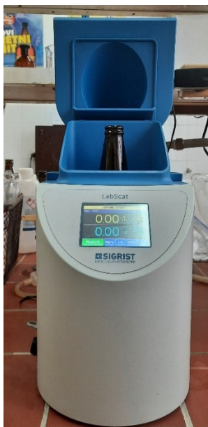
Slika 9 Turbidimetar LabScat Sigrist

(Bolf, 2020). Profiltrirani uzorci piva prebačeni su u staklene boce i stavljeni su na mjerenje bistroće pomoću turbidimetra ( Slika 9 ). Analize su provedene u Osječkoj pivovari d.o.o.