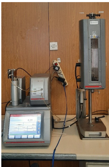
Slika 8 Analizator piva DMA 4500 M

Prethodno profiltrirani uzorci stavljaju se, jedan po jedan, na prostor za bocu na analizatoru piva DMA 4500 M te se pokrene uređaj ( Slika 8 ). Analizator radi na princip da se preko igle za uzorkovanje povuče uzorak i izmjeri zadane parametre.