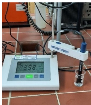
Slika 10 pH metar FiveEasy

Prethodno profiltrirani uzorci piva, prebacuju se u čašice te im se pomoću pH-metra mjeri pH vrijednost ( Slika 10 ). U uzorak se uroni elektroda i na uređaju se pritisne tipka „Read“ nakon čega se pH vrijednost prikaže na zaslonu uređaja. Nakon završetka mjerenja, elektrodu je potrebno isprati destiliranom vodom.