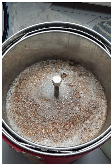
Slika 5 Postupak ukomljavanja

Kao što je navedeno, temperatura ukomljavanja se mora pažljivo odabrati jer se pri toj temperaturi aktiviraju enzimi. Odabrana temperatura se održava određeno vrijeme kako bi enzim mogao provoditi specifične kemijske reakcije. Takvo održavanje temperature naziva se temperaturna stanka. Najbitniji enzimi kod ovakvog procesa su amilaze, odnosno \alpha -amilaza i \beta -amilaza koje razgrađuju škrob. Aktivnost \alpha -amilaze najbolja je pri 63-70 °C i pH vrijednosti od 5,7. Ako temperatura prelazi 70 °C dolazi do denaturacije ovog enzima. Za razliku od \alpha -amilaze, \beta -amilaza se aktivira pri temperaturama 55-65 °C i pH vrijednosti između 5,4-5,6. Kako bi se oba enzima aktivirala, ukomljavanje je najbolje provoditi pri temperaturama 65-67 °C. Pri kraju ukomljavanja podiže se temperatura kako bi se enzimi denaturirali (Mosher i Trantham, 2017). Postoje dva načina ukomljavanja: infuzija i dekokcija. Infuzijski način ukomljavanja predstavlja lagano zagrijavanje sladovine do željene temperature, a ukomljavanje dekokcijom znači odlijevanje dijela komine u posebnu posudu koja se zagrijava te se vraća i miješa (Raguž, 2021). Nakon toga slijedi ispiranje slada. Cilj ovog postupka je odvojiti sladovinu od suspendiranih sastojaka odnosno tropa (Marić, 2009).