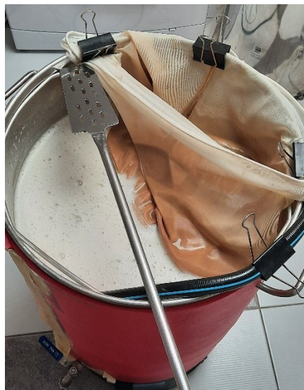
Slika 6 Kuhanje sladovine s dodatkom hmelja

2009). Tijekom kuhanja sladovine dodaje se hmelj iz kojeg se tada ekstrahiraju gorki sastojci, tj. \alpha - i \beta - kiseline koje daju gorčinu, zatim hmeljno ulje koje je odgovorno za aromu piva i taninski sastojci koji doprinose koagulaciji proteina ( Slika 6 ). Ovisno o tome kada se dodaje hmelj, on doprinosi karakterističnom gorkom okusu i karakterističnoj aromi piva. Hmeljna ulja su hlapiva pa se tijekom kuhanja gube zajedno s otparenom vodom. Iz tog razloga, aromatične sorte hmelja dodaju se u kotao tek 15-20 minuta prije završetka kuhanja. Što je hmelj usitnjeniji, to je veća brzina ekstrakcije i iskorištenje gorkih sastojaka pa se u praksi češće koriste mljevene šišarice, hmeljni peleti i hmeljni ekstrakti (Marić, 2009).