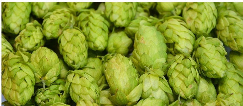
Slika 2 Šišarice hmelja

Hmelj se općenito može podijeliti u dvije skupine: gorki i aromatični hmelj. Za razliku od aromatičnog hmelja, gorki hmelj ima visok udio alfa kiselina, no aromatični hmelj daje poželjniju aromu piva (Palmer, 2006).