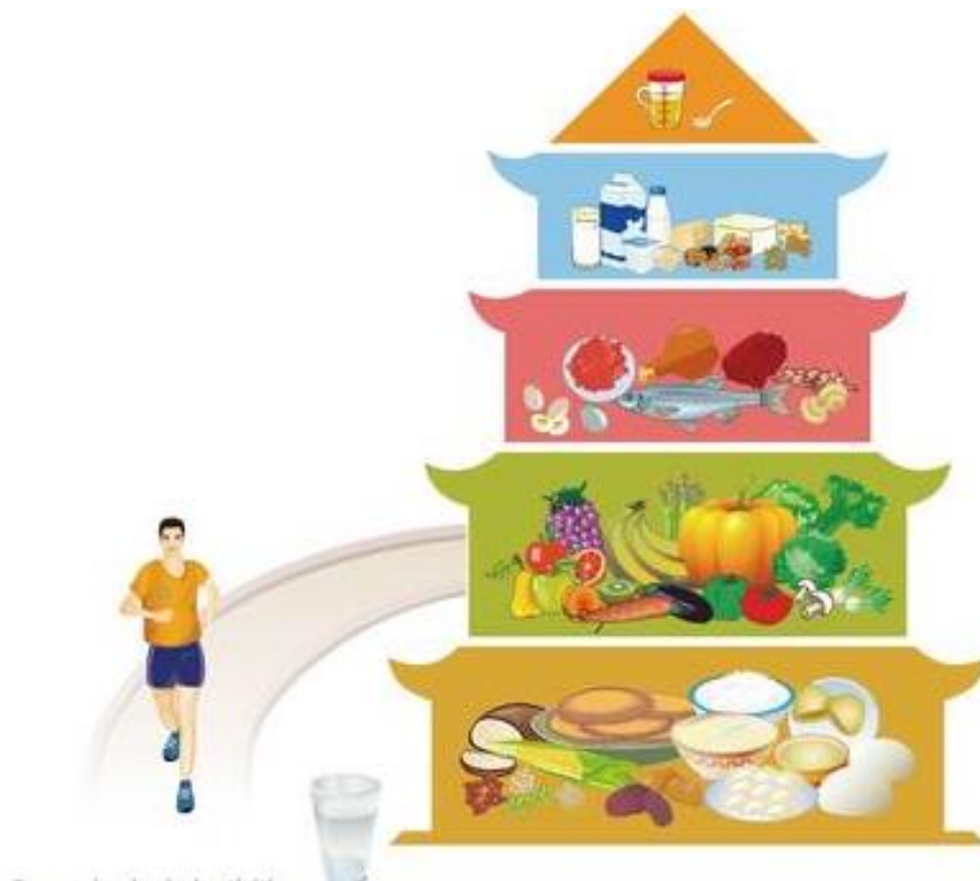
Slika 5 Prehrambene smjernice Kine (FAO, 2022)