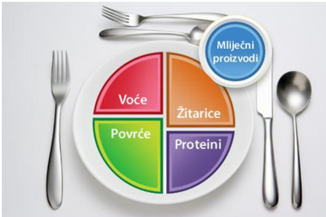
Slika 3 Moj tanjur

Pola tanjura trebalo bi činiti voće i povrće, a drugu polovicu proteini i žitarice s naglaskom na cjelovite žitarice. Uz sam tanjur nalazi se i prikaz „čaše mlijeka“ kao podsjetnik da je u prehranu važno uključiti mlijeko i proizvode.