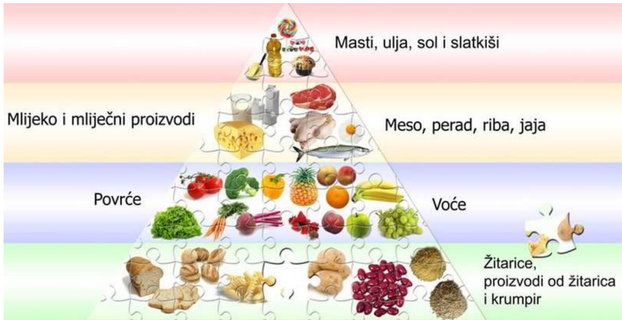
Slika 6 Hrvatske smjernice za pravilnu prehranu (FAO, 2022)

Formalni prikaz smjernica pravilne prehrane za populaciju u Republici Hrvatskoj je izvorni oblik piramide pravilne prehrane ( Slika 6 ). Smjernice za odrasle objavljene su 2002. godine, smjernice za djecu dobi 7-10 godina 2008. godine a smjernice za adolescente dobi 11-15 godina 2012 godine (FAO, 2022).