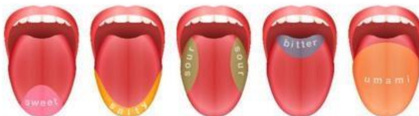
Slika 6. Shematski prikaz ljudskog jezika i položaja receptora okusa (Habschied i sur., 2022)

Senzorska analiza se definira kao znanstvena disciplina koja se bavi procjenom okusne senzacije. Kao znanstvena disciplina pojavila se u 20. stoljeću i bila definirana kao procjena organoleptičkih svojstava hrane isključivo od strane ljudskih osjetila. Senzorska analiza bila je ključni dio ljudske povijesti te se koristila za određivanje jestivih i nejestivih tvari, kao za procjenu razvrstavanja poželjnih namirnica od nepoželjnih. Senzorska procjena sastoji se od pet osnovnih osjetila: 1. olfaktometrija – miris; 2. okus; 3. opipljivost – dodir; 4. izgled – vid; 5. sluh (Habschied i sur., 2022.)