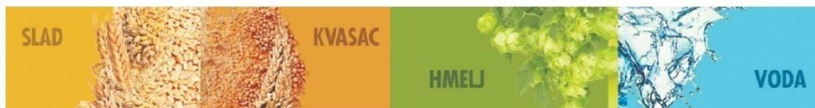
Slika 1. Osnovni sastojci za proizvodnju piva (Šarić, 2020.)