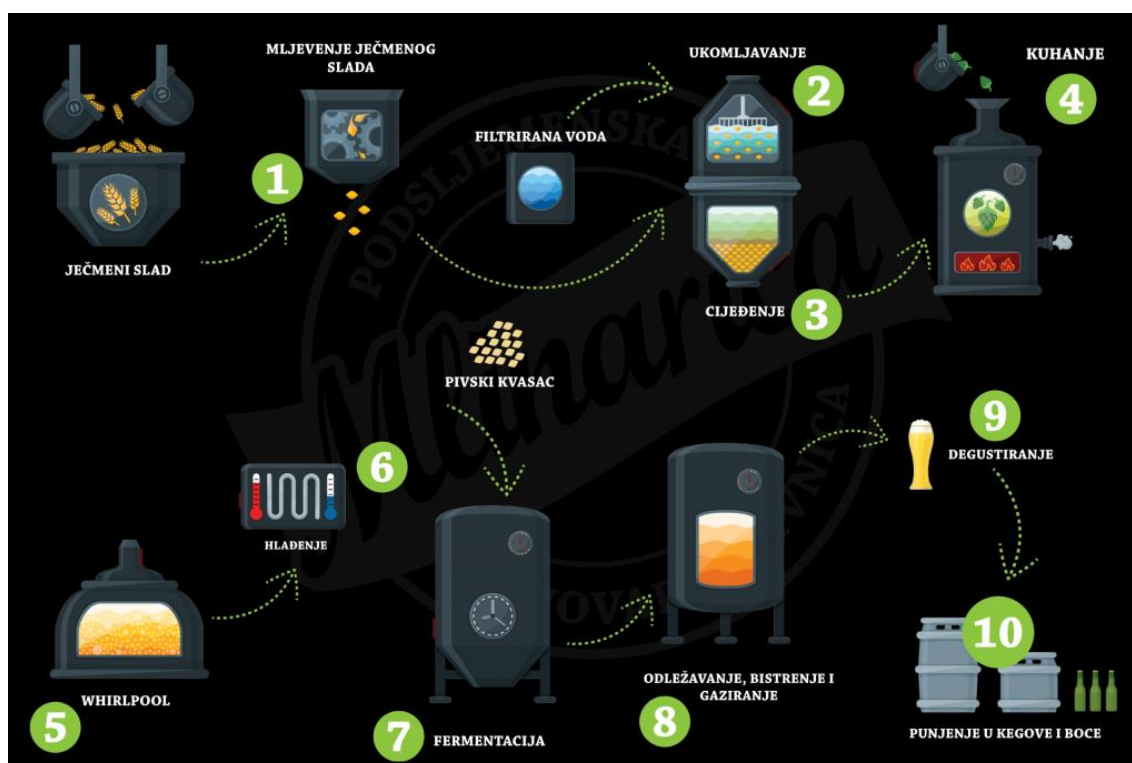
Slika 3. Shematski prikaz proizvodnje piva ( https://mlinarica.hr/proizvodnja-piva/ , n.d.)