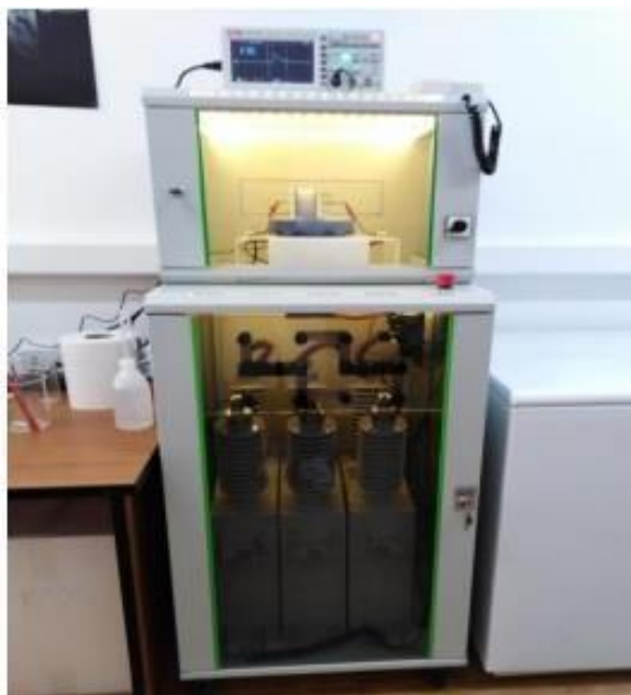
Slika 5. PEP uređaj „Grom“ – Prehrambeno-tehnološki fakultet Osijek