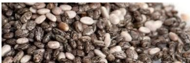
Slika 2 Tamne i bijele sjemenke chie

Chia se može upotrebljavati u obliku cijelog sjemena, brašna, gela i ulja sjemenki. Sjemenke imaju osobinu izrazite hidratacije te pomiješane s vodom nabubre i povećaju svoj volumen do 3 puta. Nakon namakanja postoji bezbroj načina upotrebe, mogu se koristiti za pripravljanje: palačinki, salata, raznih kolača, tradicionalnih jela, ali i juha, sendviča ili umaka. Sjemenke se moraju dodati u jelo na kraju kuhanja kako ne bi bile podvrgnute dužoj termičkoj obradi jer povišena temperatura uništava veći dio hranjivih tvari. Chia sjemenke ne sadrže gluten, pa brašno proizvedeno mljevenjem sjemenki može poslužiti kao zamjena za pšenično brašno kod osoba koje su osjetljive na gluten.