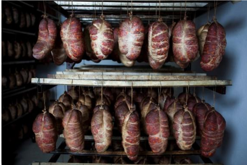
Slika 7. Sušenje kulena

stvaranja naslaga smole iz dima na površini. Dimljenje treba biti blago, hladnim dimom graba ( Carpinus sp. ), jasena ( Fraxinus sp. ) ili bukve ( Fagus sp. ). Za dimljenje je moguće koristiti drvo i/ili piljevinu navedenih vrsta drveća. U komori se kulen zadržava 12 dana i izgubi od početne težine 14 - 18% pri temperaturi 12 - 22 °C i relativnoj vlazi 76 - 92%.