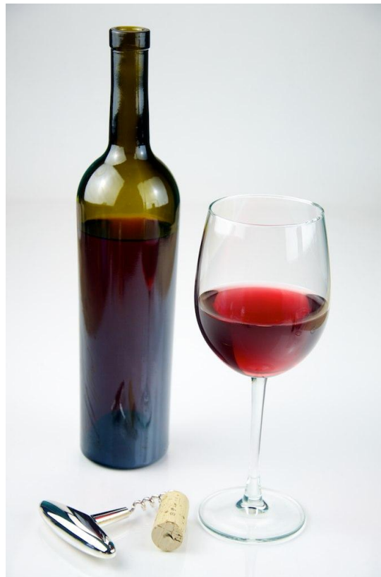
Slika 7 Vino

Vino je alkoholno piće koje se proizvodi od soka grožđa, vrlo je osjetljivo i podložno kvarenju. Zbog same osjetljivosti vina vrlo je bitno u postupku pakiranja vina izabrati najkvalitetniju i najprikladniju ambalažu. Odabirom pogodne ambalaže zajedno s pravilnom obradom vina u procesu proizvodnje i procesa zatvaranja ambalaže može se omogućiti dugotrajno kvalitetu i zdravstvenu ispravnost vina. Današnji zahtjevi za vino su postavljeni vrlo visoko i traži se sve veća trajnost i kvaliteta vina. Gledajući sva svojstva vina može se zaključiti da je staklena ambalaža najprikladnija za njegovo pakiranje (sprječavanje oksidacije, zaštita od svjetla, sprječavanje reakcija između tanina i antocijana, sprječavanje pigmentacije). Punjenje vina u staklene boce donosi dozu profinjenosti i podiže proizvod na jednu višu razinu, a samim time raste i cijena što pogoduje proizvođačima (Slika 7).