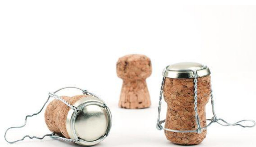
Slika 3 Pluteni čep

Pjenušava vina se dobiju tako da se vino prvo stabilizira i pročišćava, a zatim dugo fermentira. Šećer i kvasac dodaju se zajedno. Poznato je pravilo da 4 grama šećera na litru vina proizvede jednu atmosferu tlaka ugljikovog dioksida, a obično je poželjan konačni tlak od 6 atmosfera. Pjenušava vina koja fermentiraju u boci pune se u boce za šampanjce, koje se pečate velikim plutenim čepom koji je pritegnut žicom (Slika3). Tako pripremljene boce stavljaju se u vodoravan položaj, na hladno mjesto da fermentiraju, a taj proces traje nekoliko tjedana. Nakon toga vina se ostavljaju da odleže 1-4 godine kako bi vino sazrelo. Kada je vino sazrelo boce se stavljaju na police s prečkama i započinje proces odstranjivanja kvasnog taloga. Naginjanjem i okretanjem svake boce, talog se pomiče u grlo boce. Grlo boce stavlja se u ledenu kupku što dovodi do stvaranja ledenog čepa koji sadrži talog. Boca se zatim okrene u kosi položaj i otvori, pri čemu se ledeni čep pri pritisku plina istisne van. Zatim se dodaje sirup (dosage) koji regulira slatkoću vina, ako je potrebno razina vina se nadopuni, a boca se ponovno čepi. Današnja proizvodnja vina je većinom automatizirana, strojevi su zamijenili ruke, a preko računalnih programa upravlja se i kontrolira sva svojstva vina (Robertson, 1993.)