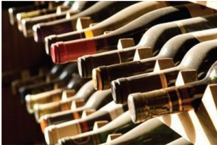
Slika 6 Skladištenje vina

https://www.google.hr/search?q=vina+u+bocama&espv=2&biw=1600&bih=794&source=lnms&tbn=isch&sa=X&ved=0ahUKEwjhPTa3bnPAhWGuxQKHRYBA1kQ_AUIBigB#imgrc=O6gloWFA9sulgM%3A