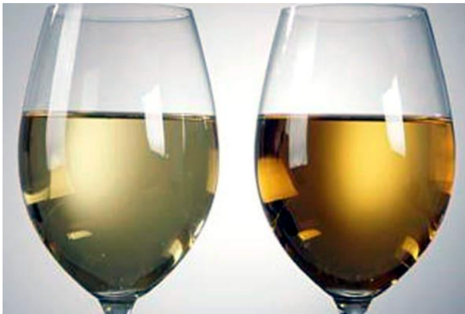
Slika 4 Normalno i oksidirano vino (desna čaša)

Neposredno prije pakiranja može se dodati mala količina sumporovog dioksida u vino koje se nakon toga podvrgava filtraciji. Potencijalno štetni efekti oksidacije u raznim ambalažama, kao i u samom vinu mogu se spriječiti ili minimalizirati raznim postupcima. Iz vina se može izvući otopljeni kisik postupkom propuštanja mjehurića dušika kroz vino, a ambalaža se može pročistiti dušikom ili ugljikovim dioksidom i puniti ispuštajući plin bez uvođenja zraka. Mogu se koristiti i drugi antioksidansi (kao što je askorbinska kiselina) ili inhibitori rasta mikroorganizama. Pasterizacijom ili filtracijom kroz membranu, postiže se da vino pri pakiranju bude sterilno. (Robertson, 1993.)