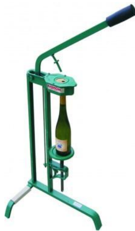
Slika 5 Flaširanje vina

Najčešći način pakiranja vina je u staklenu bocu začepljenu prirodnim plutenim čepom. Pluto je vanjska kora crnike, zmizelena vrsta Quercus suber koja raste u Španjolskoj. Čvrsto je, lagano i elastično. Na većinu vina sunčeva svjetlost može djelovati negativno, uzrokujući promjene na vinu pa su i zbog toga boce obično od obojenog stakla, najčešće zelenog ili smeđeg. Vina u bocama se najčešće skladište u vodoravnom položaju tako da zatvarač bude vlažan i tako bolje sprječava ulazak kisika. Staklena boca koja je na pravilan način zatvorena vinu osigurava najveći stupanj zaštite od kisika (prikazano na slici 5), koji dovodi do promjene karaktera vina, stvarajući smeđu boju i nepoželjan okus (Robertson, 1993).