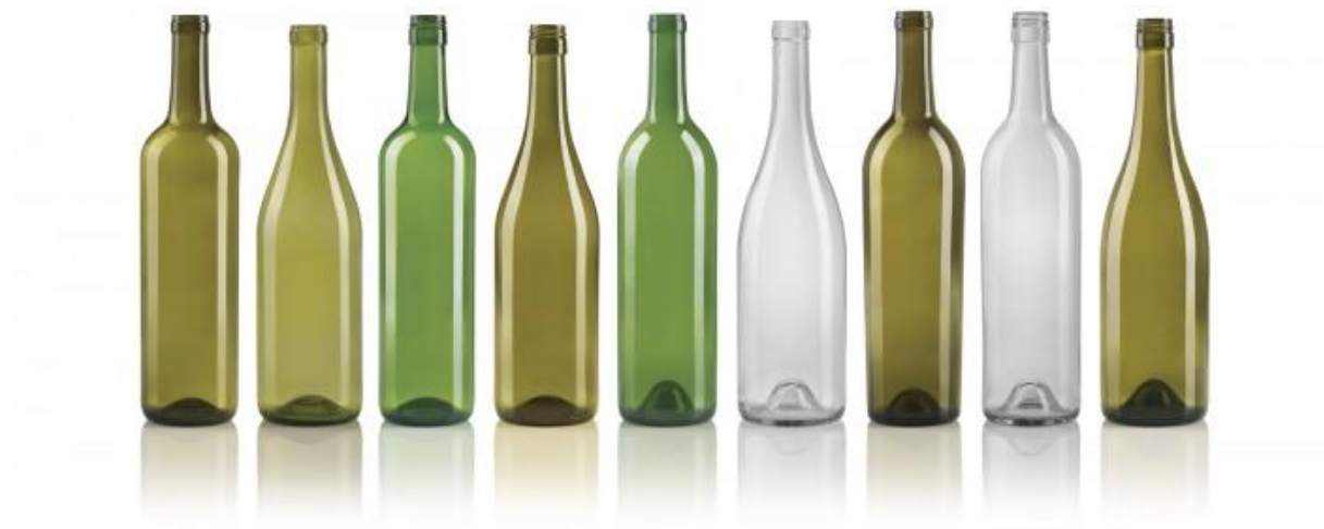
Slika 1 Primjer staklene ambalaže

Sadrži oksid kalija, oksid olova i silicijev dioksid. Olovno staklo lako se topi i ima veliki indeks loma svjetla. Koristi se za izradu kristalnog stakla, za izradu leća i kao ambalaža za pakiranje luksuzne kozmetičke robe (Vujković i sur.,2007).