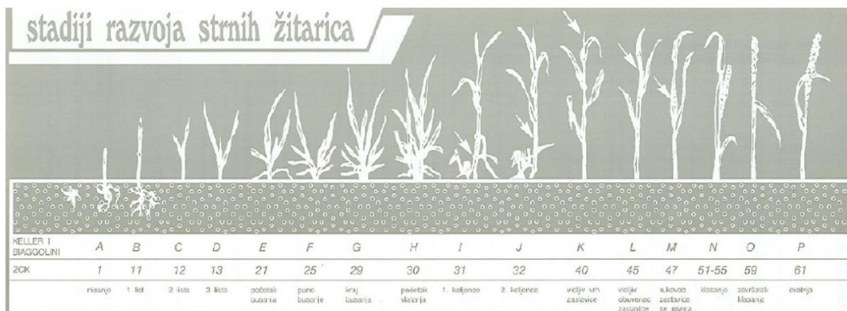
Slika 4 Stupnjevi razvoja strnih žita

Faze koje biljka prolazi u svom životnom ciklusu: bubrenje i klijanje, nicanje, ukorjenjavanje, busanje, vlatanje, klasanje, cvjetanje i oplodnja, formiranje, naljevanje i sazrijevanje zrna.