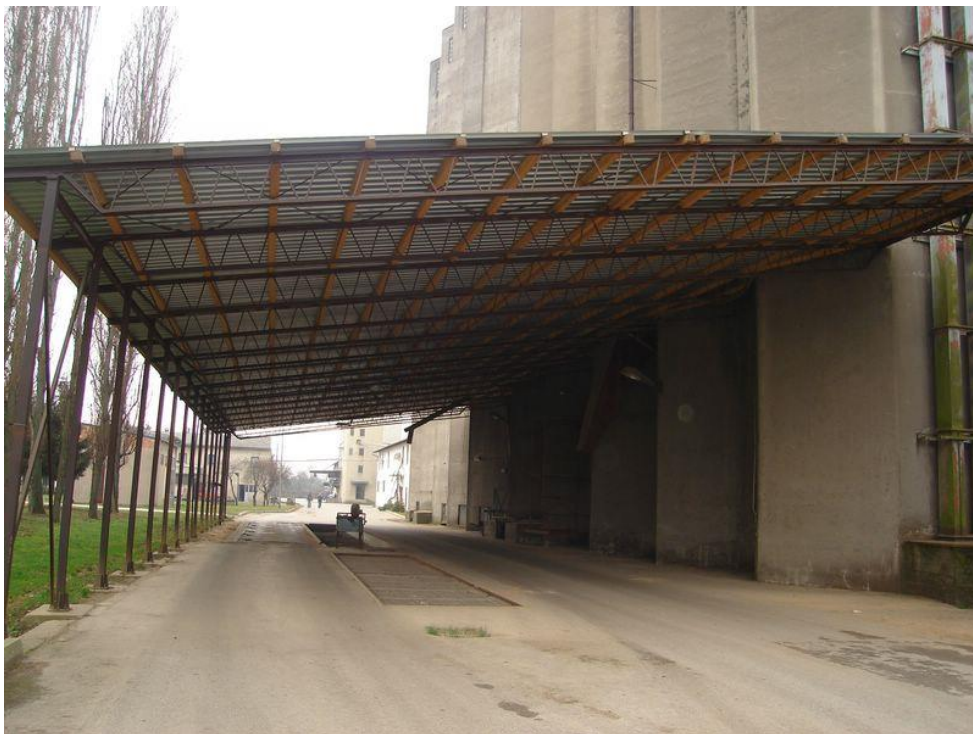
Slika 14 Prijemni bunker

Nakon što vozilo uđe u krug silosa, ide na istovar pšenice. Istovar se vrši na način da se vozilo parkira na ležište (tzv. bertoju) te se samoistovara, ukoliko vozilo ima takvu mogućnost, ili se pomoću hidrauličkog cilindra nagne kako bi se pšenica istovarila. Pšenica se istovara na rešetke ispod kojih se nalazi prijemni bunker, u kojem se nalazi transporter (redler), a iznad rešetke se nalazi sakupljač prašine.