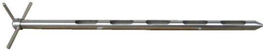
Slika 6 Ručna sonda

Uzorak se uzima s više mjesta na prikolici. Radi se većinom o pet uboda sondom, u kutevima prikolica te samo središte. Uzorkovanje se mora obaviti na ovaj način kako bi se dobio reprezentativni uzorak.