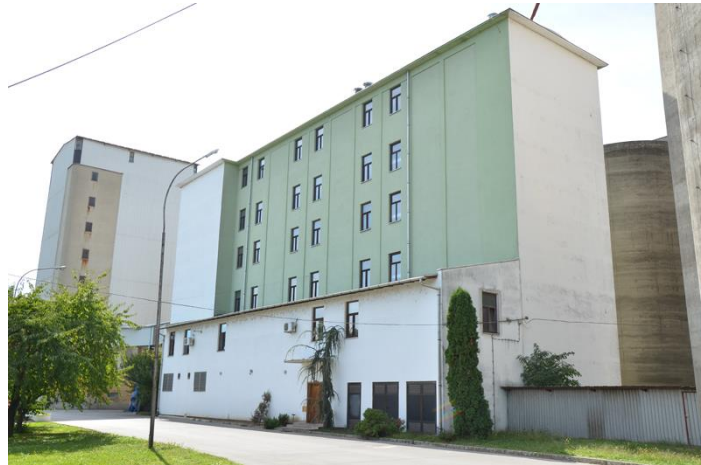
Slika 2 „Slavonija Županja“ d.d.