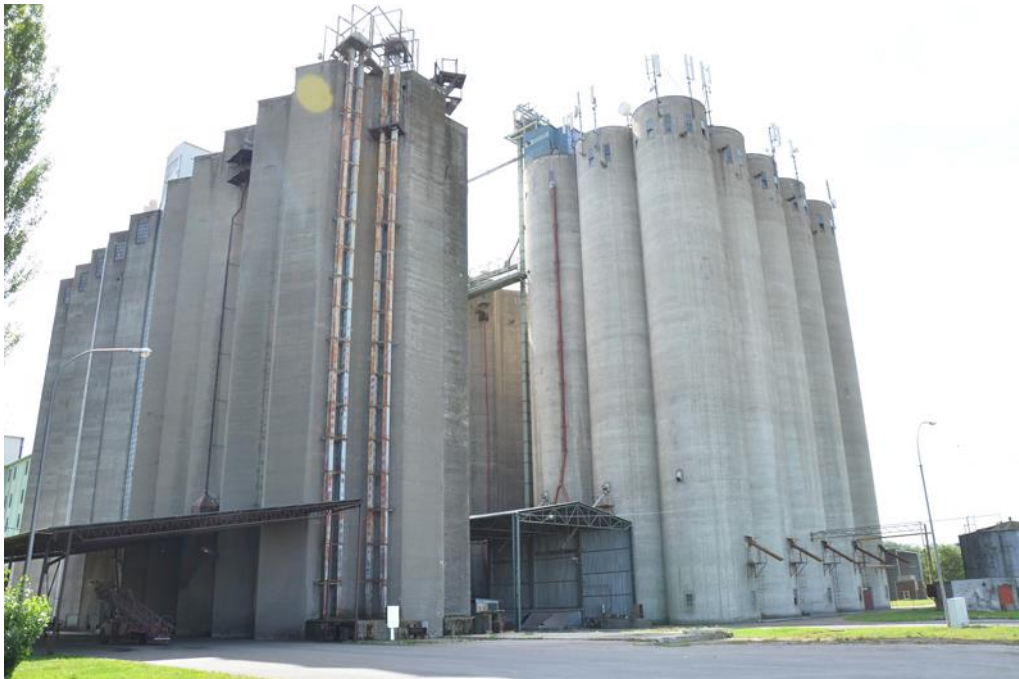
Slika 15 Silos

Ukoliko pšenica ide na skladištenje sprema ju se u određenu komoru gdje odležava određeno vrijeme, obično oko 10-tak dan, nakon čega slijedi njeno prvo čišćenje te premještanje u drugu komoru. Pšenica se premješta pomoću elevatora ili pomoću redlera.