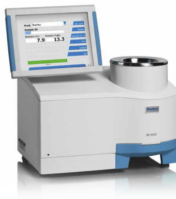
Slika 7 Infarmatik (Web 1)

Uzorak pšenice sipamo u uređaj te pritisnemo 'Analiziraj!'. Nakon kratkog vremena prikazuje se rezultat kojeg zapisujemo, a uzorak uklanjamo iz uređaja.