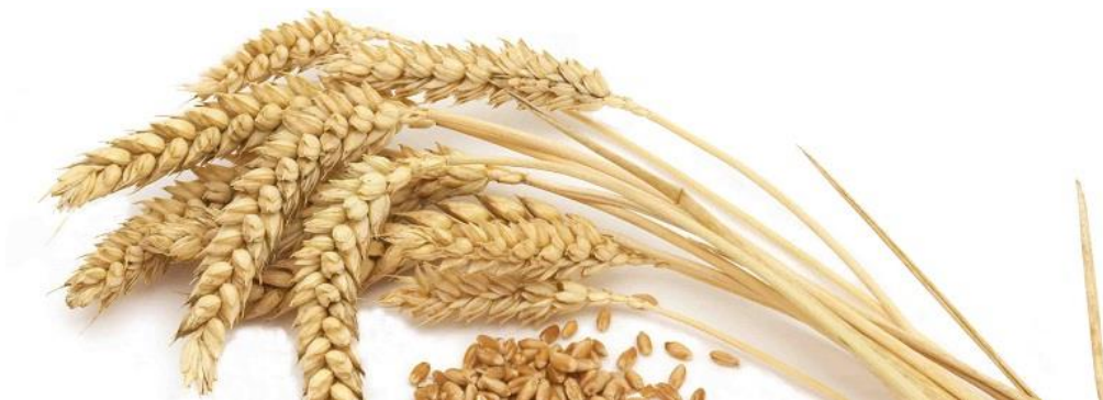
Slika 8 Zdravi klas pšenice (web 2)

Traženi parametri uzorka uspoređuje se sa specifikacijom ili standardom.