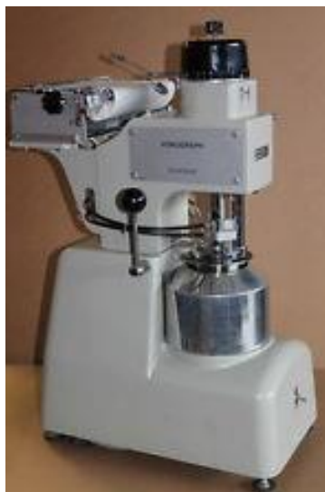
Slika 13 Amilograf

m2 – vrijeme, u minutama, koje protekne od trenutka uključivanja grijača do trenutka kad krivulja dosegne maksimum.