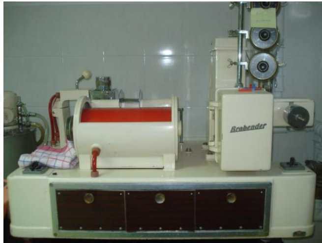
Slika 12 Ekstenziograf

neimenovani broj i predstavlja količnik brojčane vrijednosti otpornosti na petom centimetru rastezanja i brojčane vrijednosti rastezljivosti.