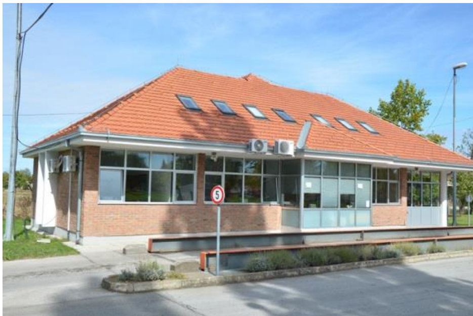
Slika 5 Vaga

Pšenica se u silos dovozi kamionima ili traktorima. Pšenica koja se dovozi s vlastitih njiva ima svoj broj iz bloka, a svaki kooperant ima svoj broj pod kojim je prijavljen. Ovaj podatak je vrlo bitan zbog sljedivosti koja se vodi unutar kompanije. Vozilo kada stigne u krug tvornice staje na vagu, gdje se određuje masa i uzima uzorak. Uzorak se uzima pomoću sonde (automatske). Slijedi određivanje vlage i hektolitarske mase pšenice te uzimanje uzorka za daljnje analize. Kad se odrade ove dvije analize vozaču se predaje papir na kojem piše udio vlage i hektolitarska masa te ga se uputi na istovar pšenice. On odlazi, a uzorak koji je uzet dalje se analizira. Pšenica koja se prima na čuvanje i ona koje se otkupljuju, mora biti zrela, zdrava, bez znakova pojave štetnih organizama, bez stranog okusa i mirisa te upotrebljiva za ljudsku prehranu. Ukoliko ne udovoljava navedenim kriterijima svrstava se u stočnu pšenicu, osim sorti namijenjenih za konditorsku industriju.