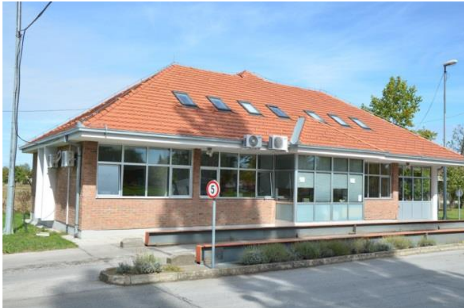
Slika 5 Vaga

Pšenica se u silos dovozi kamionima ili traktorima. Pšenica koja se dovozi s vlastitih njiva ima svoj broj iz bloka, a svaki kooperant ima svoj broj pod kojim je prijavljen. Ovaj podatak je vrlo bitan zbog sljedivosti koja se vodi unutar kompanije. Vozilo kada stigne u krug tvornice staje na vagu, gdje se određuje masa i uzima uzorak. Uzorak se uzima pomoću sonde (automatske). Slijedi određivanje vlage i hektolitarske mase pšenice te uzimanje uzorka za daljnje analize. Kad se odrade ove dvije analize vozaču se predaje papir na kojem piše udio vlage i hektolitarska masa te ga se uputi na istovar pšenice. On odlazi, a uzorak koji je uzet dalje se analizira. Pšenica koja se prima na čuvanje i ona koje se otkupljuju, mora biti zrela, zdrava, bez znakova pojave štetnih organizama, bez stranog okusa i mirisa te upotrebljiva za ljudsku prehranu. Ukoliko ne udovoljava navedenim kriterijima svrstava se u stočnu pšenicu, osim sorti namijenjenih za konditorsku industriju.