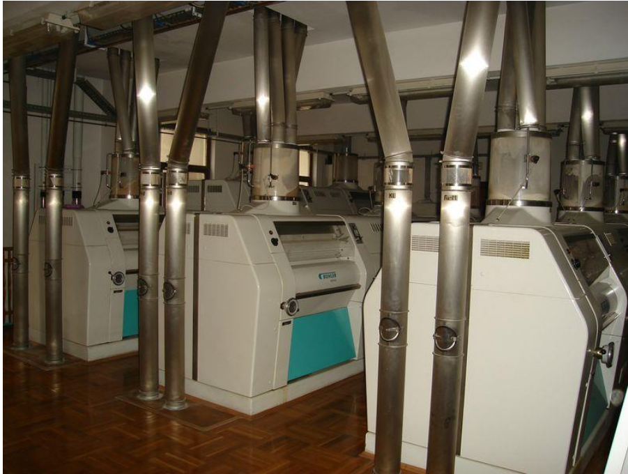
Slika 10 Mlin