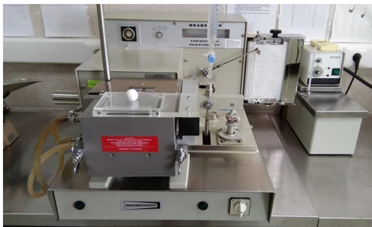
Slika 11 Farinograf

Kvalitetni razred, na dobivenom farinogramu planimetrira se površina trokuta što je zatvaraju: linija središnjica, koja se ucrtava u krivulju počevši od njezina maksimuma do završetka farinogramu 15 minuta, linija konzistencije postignuta u rasponu od 490 FJ do 510 FJ i okomica koja spaja liniju središnjicu sa linijom konzistencije. Za utvrđenu površinu trokuta, izraženu u cm 2 , u tablici po Hankoczyu pročitava se kvalitetni broj brašna a tom broju odgovara određena klasa (A1, A2, B1, B2, C1, C2).