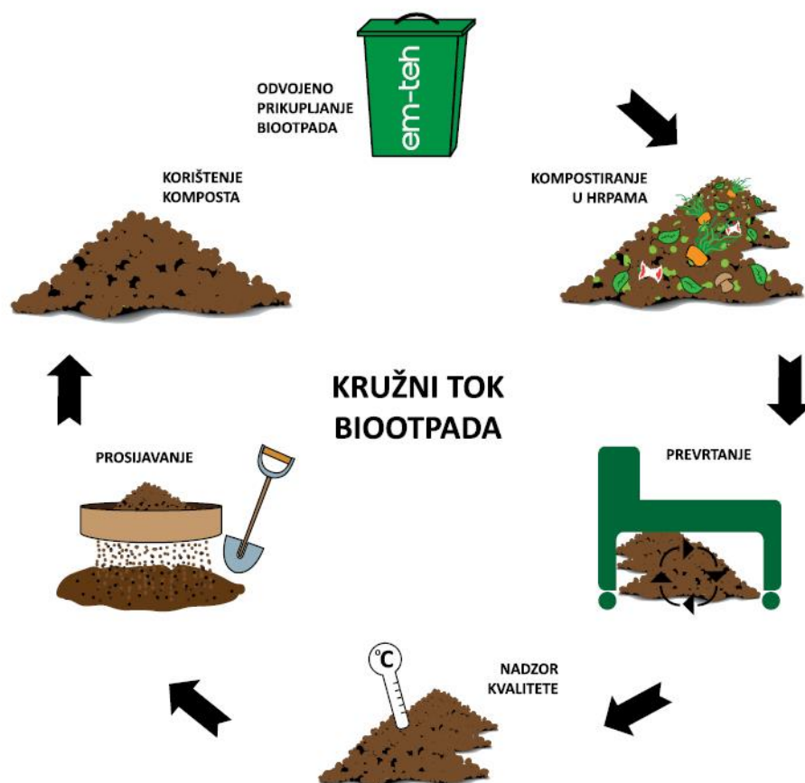
Slika 2. Kompostiranje bio otpada

Biootpad je kuhinjski otpad (ostaci od pripreme hrane) i vrtni ili zeleni otpad. Čini gotovo trećinu kućnog otpada i vrijedna je sirovina za proizvodnju kvalitetnog biokomposta. Najbolje je da se biootpad biološki prerađuje na mjestu njegovog nastanka kompostiranjem. Kompostiranjem biootpada se u kontroliranim uvjetima odvija razgradnja organske tvari u stabilno stanje u kojemu dobivamo koristan proizvod koji može poslužiti kao poboljšivač tla. U procesu kompostiranja ključnu ulogu imaju mikroorganizmi koji uz odgovarajući stupanj vlažnosti i kisika prerađuju organsku tvar u kompost. Na brzinu procesa kompostiranja ograničavajući činitelj je udjel ugljika i dušika u sastavu organske tvari, jer su ta dva elementa neophodna za mikrobiološku aktivnost i rast. Naime, ugljik (C) je izvor energije, a dušik (N) je neophodan za rast mikroorganizama koji sudjeluju u procesu kompostiranja organske tvari. Stoga dodavanje kultura mikroorganizama u kompostnu masu može značajno utjecati na brzinu kompostiranja i kvalitetu kompostne mase.