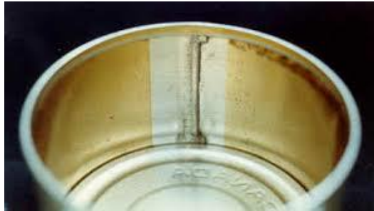
Slika 7 Korozija omotača limenke

Na Slici 7 prikazana je korozija unutrašnje strane omotača limenke u koju je vjerojatno bila upakirana jedna vrsta mesne prerađevine kod koje je uslijed nejednakog nanosa zaštitnog sloja na unutrašnjosti omotača limenke došlo do kemijske reakcije između metalne osnove i soli iz otopine upakirane namirnice.