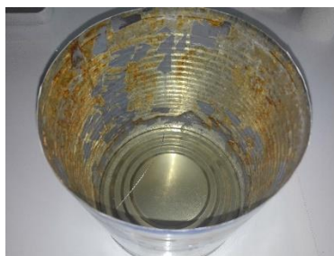
Slika 6 Korozija limenke za pakiranje voćnog kompota

Na Slici 6 prikazana je korozija unutrašnjeg dijela metalne ambalaže (limenka) u koju je bila zapakirana jedna vrsta voćnog kompota. Korozija je vjerojatno nastala uslijed nejednoličnog nanosa kositra ili organske prevlake na metalnu osnovu unutrašnjosti limenke što je uvjetovalo kemijsku reakciju između sastojaka voćnog kompota i metalne osnove limenke.