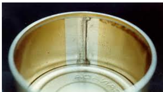
Slika 7 Korozija omotača limenke

Na Slici 7 prikazana je korozija unutrašnje strane omotača limenke u koju je vjerojatno bila upakirana jedna vrsta mesne prerađevine kod koje je uslijed nejednakog nanosa zaštitnog sloja na unutrašnjosti omotača limenke došlo do kemijske reakcije između metalne osnove i soli iz otopine upakirane namirnice.