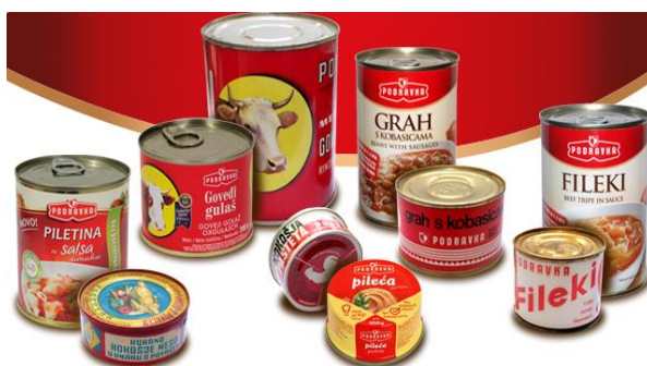
Slika 1 Proizvodi upakirani u metalne limenke

Limenke mogu biti raznih oblika: okrugle, četvrtaste, ovalne, trapezaste. Izrađuju se najčešće od aluminija ili bijelog lima. Konstrukcijski, limenke, se mogu podijeliti u dvodijelne i trodijelne, a prema unutrašnjem obliku mogu biti cilindrične i konusne. Proizvode se spajanjem omotača s poklopcem i dnom. Limenke se upotrebljavaju za hermetičko zatvaranje namirnica zbog svoje nepropusnosti na plinove, vodenu paru, mikroorganizme te elektromagnetska zračenja. Pogodne su za termičku obradu, pakiranje higroskopskih proizvoda te za pakiranje u atmosferi zraka (Jakobek, 2016.). Na Slici 1 prikazan je različiti izgled limenki i proizvodi koji se pakiraju u ovu vrstu metalne ambalaže.