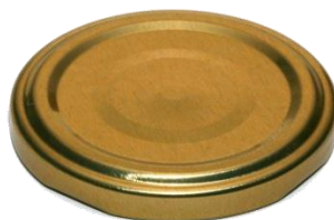
Slika 2 Twist off poklopac

Poklopci i zatvarači razlikuju se prema načinu uporabe: poklopci se upotrebljavaju za zatvaranje staklenki dok zatvarači za zatvaranje boca. Najčešće upotrebljavani poklopci su: Twist off, Omnia, Pano te zatvarači: krunski, aluminijski-navojni, plitki aluminijski (Jakobek, 2016.). Na Slici 2 prikazan je Twist off poklopac.