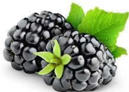
Slika 1. Kupina