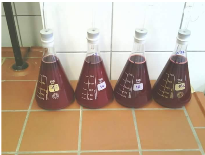
Slika 3. Procijeđeno kupinovo vino nakon maceracije

Daljnja fermentacija provedena je pri sobnoj temperaturi tijekom 8 dana. Po završetku fermentacije mlado kupinovo vino iz tikvica pretočeno je (odekantirano je vino s taloga) u nove tikvice te je u svaku tikvicu dodano 8 % bijelog konzumnog šećera na volumen vina u tikvicama. Osim šećera, u tikvice je također dodan K_2S_2O_5 (10 g / hL preračunato na volumen vina u tikvici nakon pretakanja) te sredstvo za bistrenje (pentagel, 10 g / hL preračunato na volumen vina u tikvici nakon pretakanja). Tikvice su zatim prenesene u hladnjak, gdje su 4 dana čuvane na 2 °C kako bi se vino što bolje izbistilo. Nakon toga, izbistreno vino pretočeno je u tamne boce te ostavljeno da zrije i odležava u hladnjaku na 5 °C do provođenja analiza. Tijekom odležavanja, vino je u dva navrata pretakano.