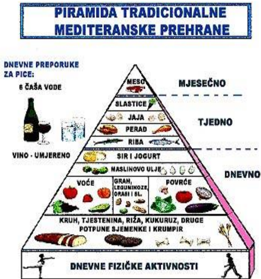
Slika 3. Piramida tradicionalne mediteranske prehrane

javnog zdravstva te OPET 4 -a i grčkih znanstvenika razvijena je Piramida tradicionalne prehrane. Istu prikazuje Slika 3.