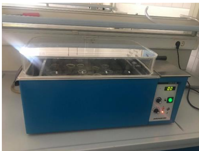
Slika 4 Termostatska tresilica Polytest 20 (Bioblock Scientific)

Učinkovitost uklanjanja arsena na navedenom adsorbensu, ispitana je kroz različite čimbenike koji utječu na adsorpciju arsena poput početne masene koncentracije arsena u modelnoj otopini arsena pH vrijednosti modelne otopine te vremenu adsorpcije. Eksperimenti adsorpcije provedeni su uz pomoć termostatske tresilice ( Slika 4 ). Ispitivanje adsorpcijskih svojstava navedenog adsorbensa provedeno je na način da se u Erlenmayerove tikvice dodalo 100 mL modelne otopine arsena. Nakon toga, dodana je određena masa adsorbensa te je postupak proveden u termostatskoj tresilici s 120 protresanja u minuti kroz određeno vrijeme i pri sobnoj temperaturi. Nakon provedene adsorpcije, uzorci su profiltrirani na grubom filter papiru te je određena koncentracija arsena nakon adsorpcije. Pokusi su odrađeni u dvije paralele.