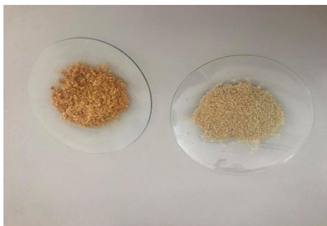
Slika 3 Uzorak ljuske bundeve prije modifikacije (lijevo) i nakon modifikacije (desno)

Kemijskom modifikacijom materijala postignuto je unakrsno povezivanje funkcionalnih grupa s epiklorhidrinom, etilendiaminom i trietilaminom. Masa sirovog materijala bila je 2 g, a nakon modifikacije dobilo se oko 10 g adsorbensa (Nujić, 2017). Slika 3 prikazuje nemodificiranu ljusku bundeve (lijevo) i ljusku bundeve nakon modifikacije (desno).