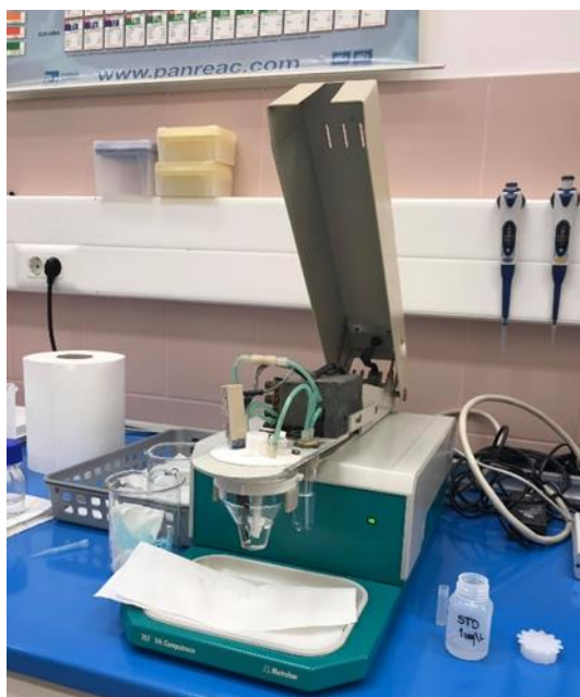
Slika 5 Uređaj Computrace 757 VA za određivanje koncentracije arsena

Ovom metodom, ukupni arsen, As(III) i As(V), određuje se na sljedeći način: As(V) je elektrokemijski neaktivan pa se tako tijekom određivanja reducira u As(III). Zajedno s već prisutnim As(III) u otopini se dalje reducira u As(0) i taloži se na zlatnu elektrodu. Tijekom otapanja s elektrode istaloženi As(0) se reoksidira u As(III) i daje analitički signal.