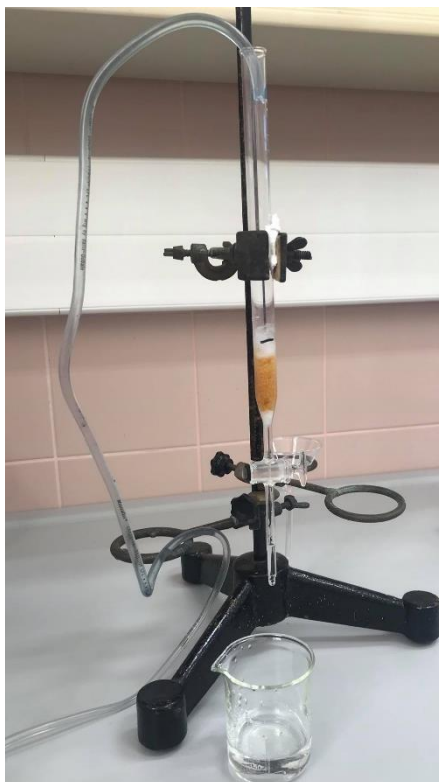
Slika 7 Kolona napunjena adsorbensom