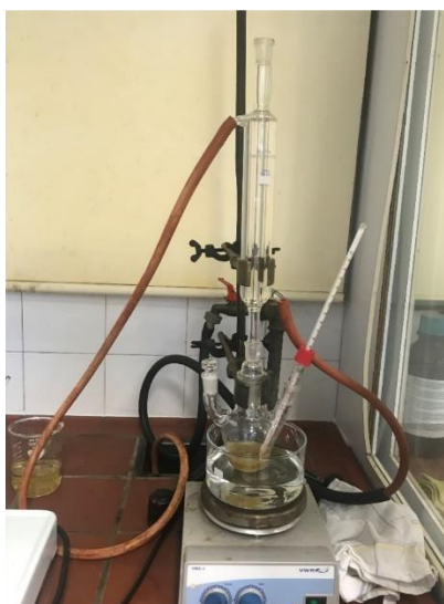
Slika 1 Aparatura potrebna za modifikaciju ljuske bundeve

Slika 1 prikazuje aparaturu potrebnu za modifikaciju ljuske bundeve.