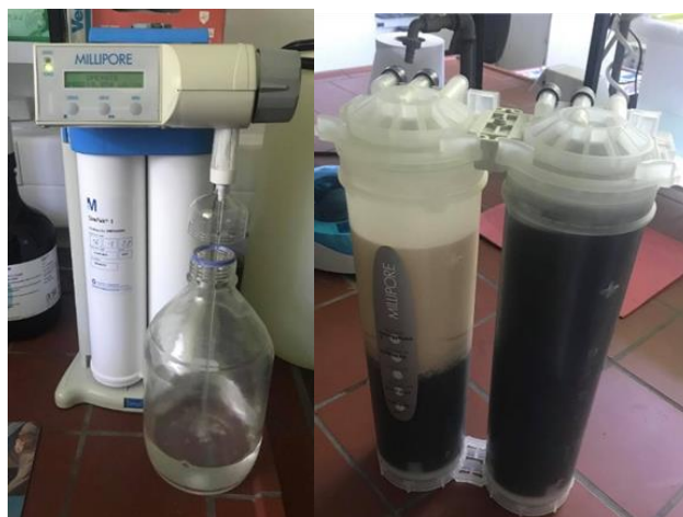
Slika 2 Uređaj za dobivanje vode visoke čistoće (lijevo) i filtri koji se nalaze u uređaju (desno)

minuta na 70 °C. Dodano je 2,5 mL etilendiamina te se nastavilo s miješanjem sljedećih 45 minuta. Nakon toga, dodano je 13 mL trietilamina te je miješanje nastavljeno idućih 120 minuta na 70 °C. Finalni proizvod (modificirana ljuska bundeve) isprana je s 1 L demineralizirane vode visoke čistoće (milli-Q, Merck) kako bi se isprao višak kemikalija. Slika 2 prikazuje uređaj za dobivanje vode visoke čistoće (a) i pod (b) su filtri koji se nalaze u uređaju.