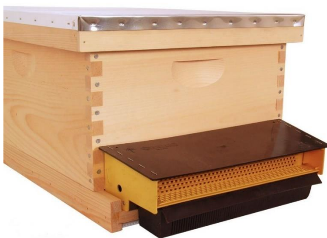
Slika 1 Skupljač pčelinje peludi postavljen na leto košnice (Medno, 2016)

Skupljač na letu se postavlja ispred leta košnice u obliku kutije kroz koju je okomito provučena plastična perforirana ploča ( Slika 1 ). Skupljač je širi od otvora i prijanja na prednju stjenku košnice, tako da pčele ne mogu ući u košnicu drukčije nego kroz prepreku. Nedostatak ovog skupljača predstavlja smanjeni pristup zraka u košnicu kada dođe do masovnog povratka sakupljačica u košnicu koje svojim tijelima zatvore otvore na sakupljaču. Osim toga, kako se ovaj tip skupljača nalazi izvan košnice, izložen je vanjskim utjecajima i potrebno ga je svakodnevno prazniti što može predstavljati problem ukoliko pčelinjak nije blizu mjesta stanovanja pčelara (Levaković, 2014).