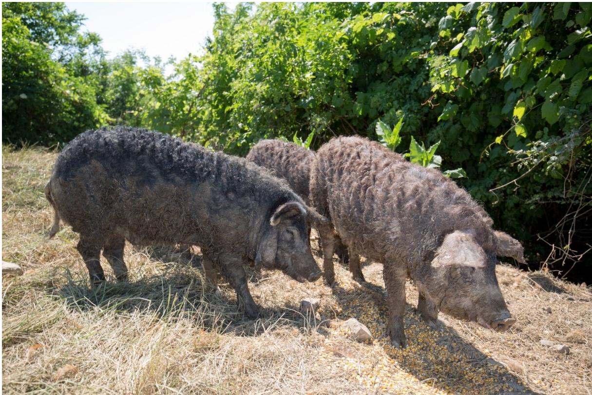
Slika 2. Mangulica ( https://www.jutarnji.hr/vijesti/hrvatska/je-li-ova-cupava-domaca-zivotinja-kljuc-nove-renesanse-naseg-stocarstva-njezino-se-meso-u-njemackoj-i-svicarskoj-prodaje-i-po-60-eura-za-kilogram-6176651 )

Mesnato-masne pasmine koje se još nazivaju prijelazne pasmine svinja, pogodne su za poluintenzivan uzgoj, a samim time su i odlična sirovina za proizvodnju autohtonih mesnih proizvoda. Kao primjer mesnato-masne, odnosno prijelazne pasmine svinja, na području Hrvatske najpoznatija je crna slavonska svinja. U trenutku postizanja mase od 95 do 110 kg ima dobru tovnost i mesnatost. Međutim, prilikom dostizanja mase od 120 do 140 kg, udio masnog tkiva u polovicama se kreće od 40 do 45%. Korištenjem ove pasmine mogu se popraviti konstitucijska svojstva i kvaliteta mesa (prvenstveno intramuskularno masno tkivo) mesnatih pasmina svinja (Kovačević, 2004.). U istraživanju koje su proveli Karolyi i suradnici, kako bi se poboljšali plodnost i mesnatost pasmine, predlaže se križanje s produktivnijim pasminama poput duroka. Pri tome bi se očuvala kakvoća mesa i njegova karakteristična svojstva poput većeg udjela intramuskularne masti.