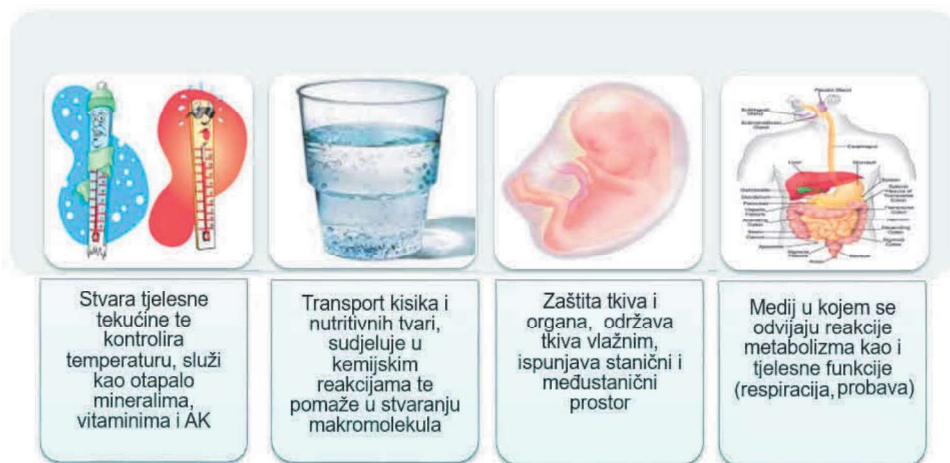
Slika 1. Funkcije vode u ljudskom organizmu Figure 1. Functions of water in the human body

omogućuje njihov transport u organizmu, podmazuje zglobove, štiti organe i tkiva, regulira tjelesnu temperaturu, olakšava probavu te potpomaže eliminaciju otpadnih tvari i toksina iz organizma. Kontinuirano održavanje neophodnog udjela vode u organizmu tijekom 24 sata postiže se izravnim unosom tekućine (1500-2000 mL), unosom putem krute hrane (300-450 mL), dok dio vode nastaje oksidacijom organskih tvari tijekom metaboličkih procesa (300-450 mL). Redoviti unos vode u organizam pridonosi i redovitom izlučivanju štetnih tvari iz organizma (Habuda-Stanić i sur., 2016).