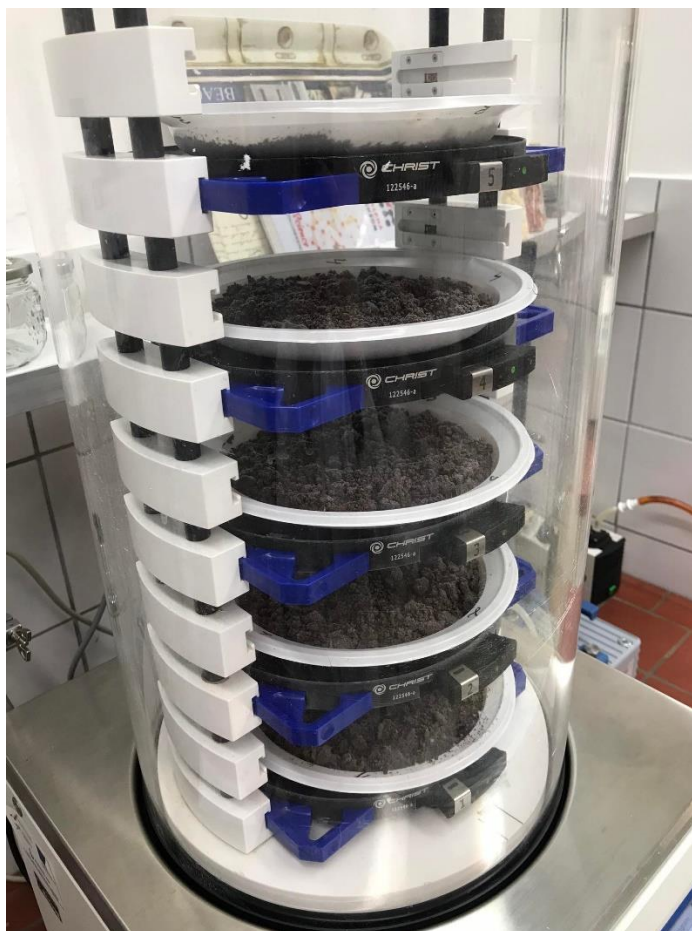
Slika 11 Uređaj za liofilizaciju

mikser s visokim naponom smicanja, najprije je usitnjen šećer do fine praškaste strukture, nadalje su dodani kakaov prah, kakaova ljuska, lecitin, hidrokoloidi i 15 mL vode zbog aglomeracije čestica. Miješanje u mikseru provedeno je sve dok se sastojci nisu sjedinili, trajanje pripreme i miješanja je bilo oko 15 minuta. Nakon aglomeracije čestica slijedilo je sušenje. Od svake recepture napravljene su po dvije probe, jedna je bila preko noći u zamrzivaču na - 80 °C te je zatim osušena u liofilizatoru prikazanom na Slici 11 . Druga proba je nakon aglomeracije osušena u sušioniku na 40 °C. Dobiveni instant kakao napitci su pohranjeni na suho i tamno mjesto.