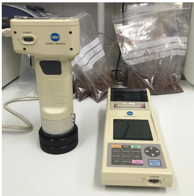
Slika 13 Kromametar Konica Minolta CR-400

Ukupna promjena boje ( \Delta E ) računa se po formuli 1: