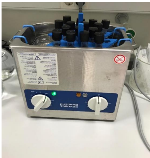
Slika 18 Ultrazvučna kupelj