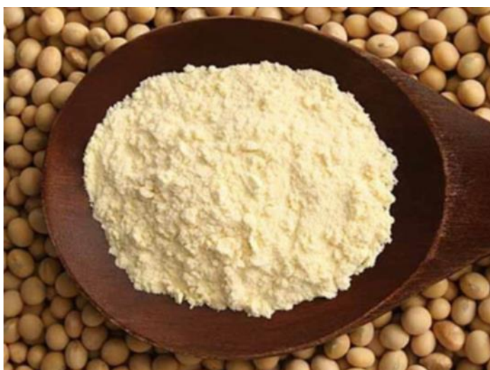
Slika 4 Sojin lecitin u prahu (Web izvor 3)

Lecitin je prirodni emulgator i može se dobiti iz žumanjaka i raznih sjemenki uljarica kao što su lan, kukuruzne klice, sjemenke suncokreta, uljane repice i soje. Najčešće se koristi sojin lecitin ( Slika 4 ) zbog svoje stalne dostupnosti i izvrsnih emulgirajućih svojstava. Osim u prehrambenoj industriji sojin lecitin se koristi u poljoprivrednoj, farmaceutskoj i tehničkoj industriji. Dobiva se iz sojinog ulja u 4 koraka, a to su: hidratacija fosfatida, odvajanje mulja, sušenje i hlađenje (Nieuwenhuyzen, 1976).