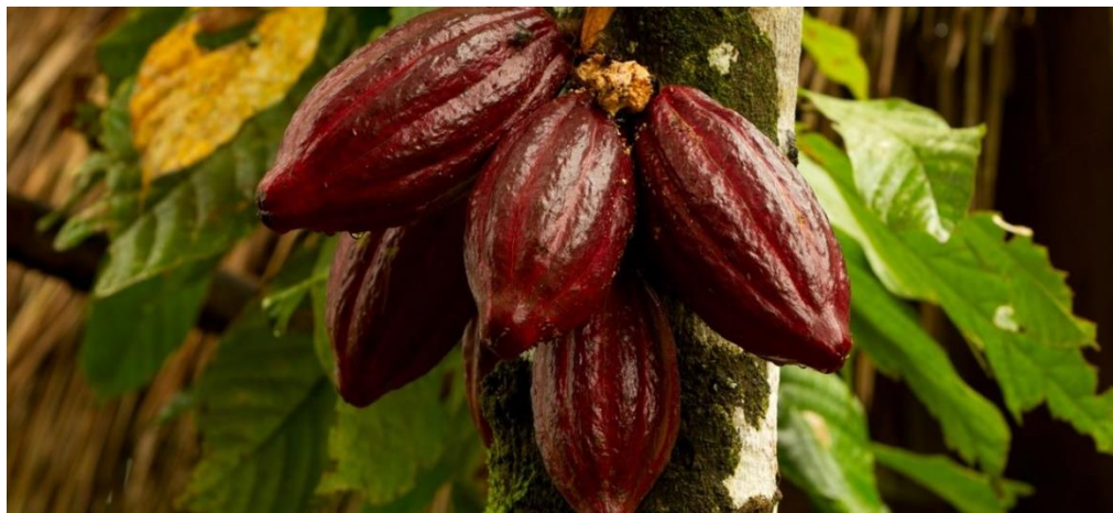
Slika 1 Drvo kakaovac

Zrna se iz ploda vade ručno te se u roku 24 sata moraju podvrgnuti fermentaciji. Dobro provedena fermentacija je glavni preduvjet za dobivanje kvalitetnog zrna, a može se provesti na dva načina, na „hrpi“ i u sanducima. Kakao koji je fermentiran u manjim količinama ima bolju aromu (Babić, 2017).