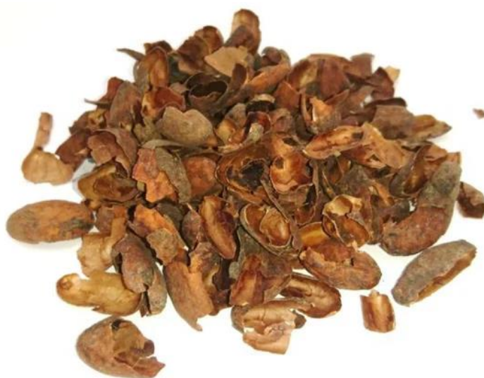
Slika 2 Kakaova ljuska (Panak Balentić i sur., 2018)

Kakaova ljuska je bogata raznim spojevima kao što su prehrambena vlakna, proteini, polifenoli, metilksantini, itd. (Barišić i sur., 2020). Zbog svoje čokoladne boje i okusa koji se ne razlikuju znatno od boje i okusa kakaovih zrna teži se što većoj upotrebi kakaove ljuske u proizvodnji raznih konditorskih proizvoda (Okiyama i sur., 2017). Osim spojeva koji mogu doprinijeti iskorištenju kakaove ljuske u prehrambenoj industriji ona može sadržavati i spojeve štetne za ljudsko zdravlje kao što su mikotoksini, policiklički aromatski ugljikovodici i teški metali te različite mikroorganizme (Barišić i sur., 2020).