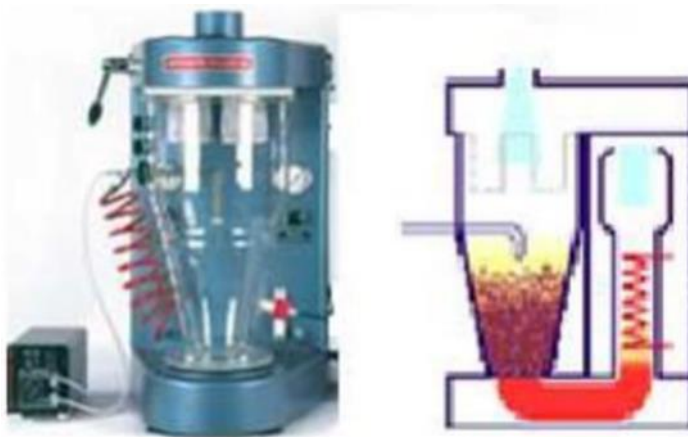
Slika 8 Uređaj za aglomeraciju i sušenje raspršivanjem (Benković i Bauman, 2011)

Dehidrirani proizvod kao što je instant kakao napitak može imati loša rehidrationska svojstva. Kada se dodaje u vodu, čestice praha plivaju po površini, stvaraju grudice i teško se mogu rehidrirati. Rehidrationska svojstva mogu se poboljšati aglomeracijom čestica (Pichler, 2018). Aglomeracija kakao napitaka je nužna jer neaglomerirane kakao mješavine imaju loša svojstva rekonstituiranja i tečenja. Prilikom miješanja osnovnih sastojaka dodaje se i određeni udio vode, površina čestice se vlaži i dolazi do sljepljivanja (aglomeracije) čestica. Aglomeracija nastaje kada se vlažne čestice sudare jedna od drugu i između njih nastane tekući most, zatim kad dođe do naknadnog sušenja, voda isparava i nastaje čvrsti most. Za aglomeraciju instant kakao praha mogu se koristiti različite tehnike: aglomeracija parom, aglomeracija u fluidiziranom sloju, termalna aglomeracija i mikseri s visokim naponom smicanja koji se koriste za mokru aglomeraciju (Benković i Bauman, 2011). Primjer uređaja za aglomeraciju i sušenje raspršivanjem prikazan je na Slici 8 .