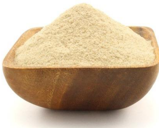
Slika 6 Ksantan guma u prahu (Web izvor 5)

Ksantan guma ( Slika 6 ) je izvanstanični polisaharid kojeg luči bakterija Xanthomonas campestris , komercijalno se proizvodi fermentacijom bakterije u dobro prozračenom fermentoru. Kada se fermentacija završi, otopina bogata izvorom ugljikohidrata npr. glukozom, izvorom dušika i hranjivom tvari se zagrijava kako bi se uništile bakterije, a ksantan guma se rekonstruira iz otopine taloženjem s izopropilnim alkoholom. Polimer se zatim suši, melje i pakira (Katzbauer, 1998).