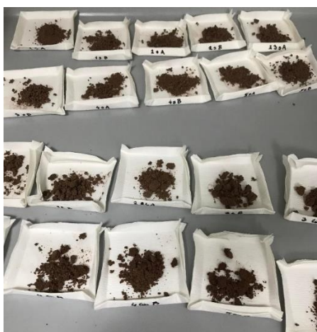
Slika 15 Sušenje odmašćenog uzorka

heksana kako bi se uklonili lipidi. Preostala odmašćena suha tvar se sušila na filter papiru na zraku 24 sata ( Slika 15 ). Nakon sušenja proveden je postupak ekstrakcije bioaktivnih komponenti na sljedeći način: odmašćeni uzorak je pomiješan s 5 mL 70 % metanola na vortex mješalici ( Slika16 ), zatim je tretiran ultrazvukom 30 min ( Slika 17 ) i centrifugiran 10 minuta pri 3000 o/min. Nakon centrifugiranja supernatant je dekantiran u odmjernu tikvicu od 10 mL. U preostali talog ponovno je dodano 5 mL 70 %-tnog metanola te je ponovljen postupak ekstrakcije na ultrazvučnoj kupelji i centrifugiranje. Dobiveni supernatant se opet odvaja u istu tikvicu od 10 mL, zatim se tikvica sa spojenim ekstraktima nadopuni do oznake sa 70 %-tnim metanolom.