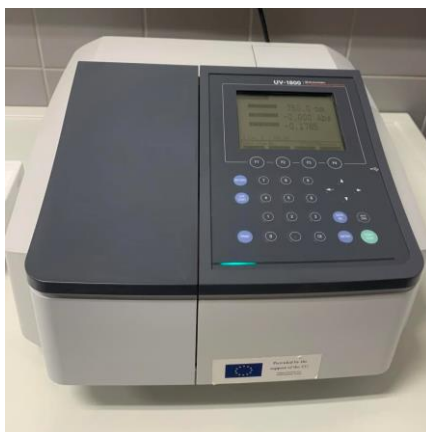
Slika 19 Shimadzu UV- 1800 spektrofotometar

Za određivanje udjela ukupnih polifenola korištena je modificirana Folin-Ciocalteuova metoda (Vinson i sur., 2001). Metoda se provodi u kiselim uvjetima bez dodatka \text{Na}_2\text{CO}_2 . Korištena je kako bi se spriječila interferencija šećera s Folin-Ciocalteu reagensom. Prije mjerenja, 0,1 mL ekstrakta je pomiješano s 1 mL 10 %-tnog Folin-Ciocalteu reagensa nakon čega je miješano 2 minute. Zatim se smjesa inkubirala u mraku 20 minuta na sobnoj temperaturi. Mjerenje je provedeno na Shimadzu UV- 1800 spektrofotometru ( Slika 19 ) kojemu je mjerni raspon valnih duljina od 190 do 1100 nm. Apsorbancija je određena na 750 nm u odnosu na slijepu probu. Za standard prilikom kvantifikacije korištena je galna kiselina, a rezultati su izraženi kao mg ekvivalenta galne kiseline po g odmašćenog uzorka (mg GAE/g).