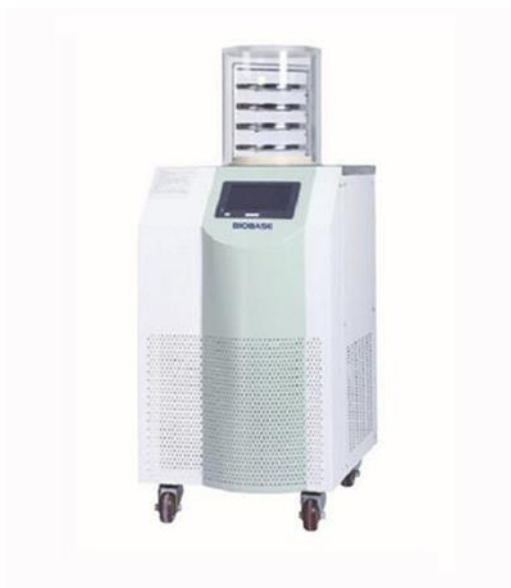
Slika 9 Laboratorijski liofilizator (Web izvor 7)

Liofilizacija je postupak sušenja kod kojega se voda iz namirnice uklanja u smrznutom stanju. Postupak sušenja liofilizacijom se sastoji od sljedećih faza: priprema namirnice, zamrzavanje namirnice, pothlađivanje zamrznute namirnice, sublimacija leda (primarna dehidracija) i izotermna desorpcija (sekundarna dehidracija). Zamrzavanje namirnice se provodi pomoću različitih rashladnih uređaja, dok se faze pothlađivanja, primarne i sekundarne dehidracije provode u liofilizatoru (Moslavac, 2015). Primjer laboratorijskog liofilizatora prikazan je na Slici 9 .