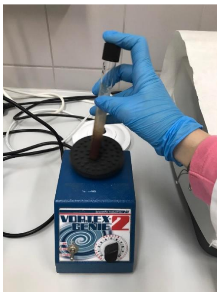
Slika 16 Miješanje odmašćenog uzorka i 70 %-tnog metanola