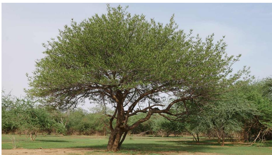
Slika 7 Acacia senegal

Guma arabica ili arapska guma je prirodni polimer dobiven iz Acacia senegal ( Slika 7 ) i Acacia seyal stabala koji pripadaju porodici leguminoza. Stabla uspijevaju u području od zapadne Afrike do Indijskog poluotoka. Najviše arapske gume se bere u sušnim zemljama kao što su Sudan, Nigerija, Senegal i Etiopija. Sudan je najveći izvoznik, a slijedi ga Nigerija. Naziv arapska guma dobila je po Arapima, odnosno arapskim trgovcima koji su ju predstavili Europi i imali veliku ulogu u njenom širenju diljem svijeta. Arapska guma složeni je polisaharid koji može biti neutralan ili blago kiseo, a zbog svojih svojstava emulgiranja, stabilizacije i zgušnjavanja ima veliku upotrebu u prehrambenoj industriji. Najčešće se koristi u proizvodnji sladoleda, želea, bombona, bezalkoholnih pića, sirupa i žvakaćih guma (Patel i Goyal, 2015).