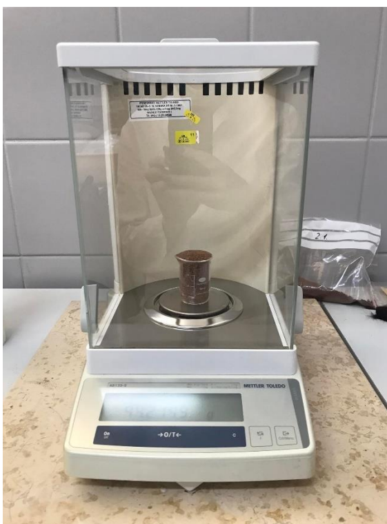
Slika 14 Određivanje nasipne gustoće u posudi poznate mase i volumena

Specifični volumen i nasipna gustoća određeni su prema metodi koju su opisali de Escalada Pla i sur. (2012). Za mjerenje nasipne gustoće svaki uzorak je usipan do vrha u posudu poznate mase i volumena, zatim je svaki uzorak izvagan pomoću analitičke vage kako bi se odredila masa koju uzorak zauzima u posudi poznatog volumena ( Slika 14 ). Mjerenje je provedeno u tri ponavljanja za svaki uzorak na sobnoj temperaturi. Specifični volumen izračunat je kao inverzna vrijednost prividne gustoće.