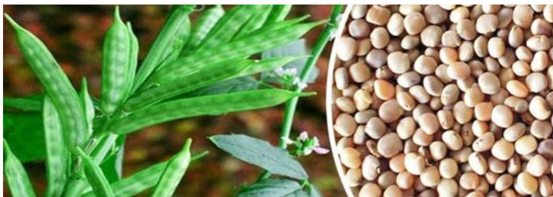
Slika 5 Biljka Cyamopsis tetragonolobus i sjemenke (Web izvor 4)

Guar guma je endosperm sjemena Cyamopsis tetragonolobus ( Slika 5 ) koje pripada obitelji leguminoza. Uzgaja se u sušnim dijelovima zapadne i sjeverozapadne Indije, Pakistana, Sudana i u dijelovima SAD-a. Biljka guar visoka je oko 0,6 m, a izgledom podsjeća na biljku soje, mahune veličine 5-12,5 cm sadrže u prosijeku 5-6 kuglastih, svijetlosmeđih sjemenki. Iz tih sjemenki ekstrahira se guar guma (Thombare i sur., 2016).