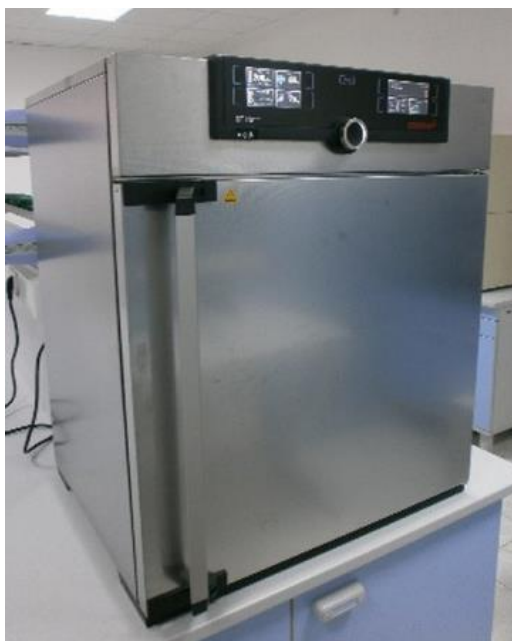
Slika 10 Laboratorijski sušionik

Još jedan primjer sušenja aglomerirane kakaove mase je sušenje u sušioniku prikazanom na Slici 10 . Sušionik spada u najjednostavnije tipove sušnica i u pravilu je diskontinuiran. Sastoji se od jedne izolirane komore (prostor za smještanje materijala), ventilatora i grijača (Moslavac, 2015). U komornim sušnicama toplina se prenosi kontaktno preko metalne plohe (Pichler, 2018). Cilj sušilice je opskrbiti proizvod s više topline nego što je dostupno u okolini. Tlak para vlage sadržane u proizvodu raste kako bi se poboljšala migracija vlage unutar proizvoda. Relativna vlažnost zraka se smanjuje kako bi se povećala njegova sposobnost nošenja vlage i osigurao dovoljno nizak ravnotežni sadržaj vlage (Dincer i Sahin, 2004). Važna prednost sušenja na visokim temperaturama je smanjenje vremena sušenja čime se povećava produktivnost proizvodnje (Anese i sur., 1999).