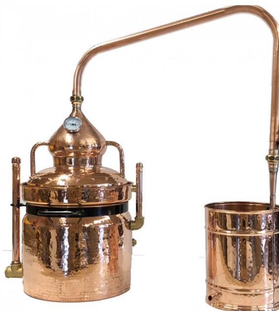
Slika 3 Tradicionalni Alambic uređaj

destiliramo. Korišteni mošt određuje alkoholnu vrijednost dobivenog destilata koji se zove sirovi destilat. U drugoj destilaciji je cilj pojačati i pročistiti alkohol. U drugoj destilaciji sirovi destilat se ponovno destilira u tri frakcije. Prva frakcija se naziva prvijenac, na engleskom 'heads' i čini od 1 do 1, 5% ukupnog destilata. U ovoj frakciji se nalaze komponente s niskim vrelištem i uglavnom nepoželjni spojevi koji daju oštar, neugodan i snažan okus destilatu. Vremenski traje oko 15 minuta.