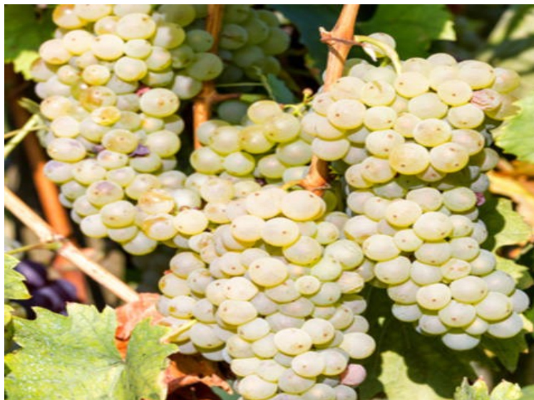
Slika 2 Sorta 'Graševina' ( https://ordinacija.vecernji.hr/zdravi-tanjur/jedi-zdravo/znate-li-sve-o-grasevini/ )

Kako bi se grožđe maksimalno sačuvalo, potrebno je provesti brze postupke branja uz adekvatne tehnološke uvjete. Potrebno je osigurati tehnološku opremu (sva oprema mora biti čista i dezinficirana) i temperaturne uvjete (za bijelo grožđe između 10°C i 15°C) u cilju sprječavanja ili usporenja procesa razgradnje sastojaka iz sirovine (Dhiman i Attri, 2011). Uslijed nedostatka pravilnog rukovanja dolazi do ekstrakcije hlapljivih spojevi kao što su metanol i octena kiselina koji štete kvaliteti budućeg vinjaka. Za proizvodnju vinjaka, berba je većinom mehanizirana što olakšava i osigurava dopremu cijelih i očuvanih bobica do vinarije. Sljedeći koraci nakon berbe su runjenje, muljanje i prešanje. Zbog potencijalnog razvitka plijesni koje prouzrokuju kvarenje, prešanje se provodi nedugo nakon berbe (Dhiman i Attri, 2011). Nakon prešanja, mošt se transportira u bačve ili kace gdje se odvija fermentacija. Prethodno fermentaciji treba odstraniti peteljke i sjemenke s obzirom da sadrže potencijalne toksične tvari i tvari koje narušavaju okus. U pravilu se ne dodaje sumporov dioksid kod vina od kojih se proizvodi vinski destilat, između ostalog, iz razloga jer njegov dodatak može dovesti do povećanog formiranja acetaldehida što utječe na aromatski profil proizvoda, odnosno smanjuje njegovu karakterističnu aromu (Lurton i sur.; 2012).