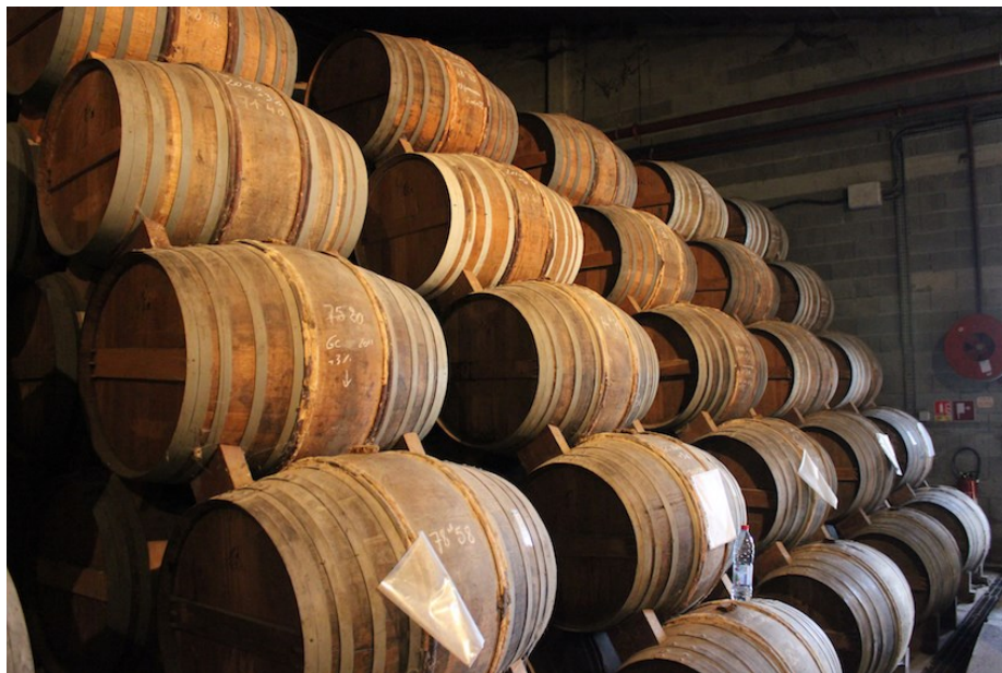
Slika 4 Hrastove bačve