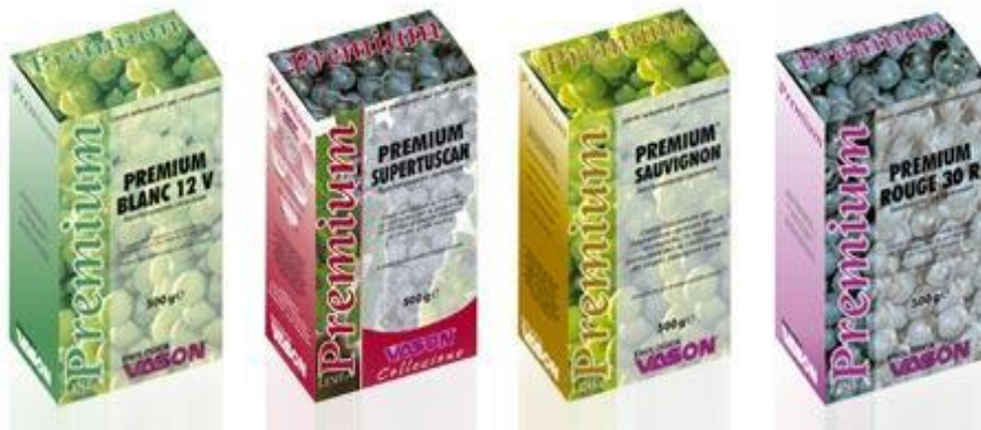
Slika 2 Selekcioniirani vinski kvasci (web 6)