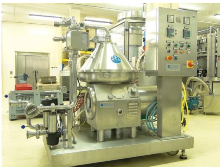
Slika 3 Centrifuga u industriji (web 1)

Najbrža metoda za pročišćavanje mošta je centrifugiranje te ju koriste veliki proizvođači. Centrifuga radi na principu centrifugalne sile, bubanj se rotira velikom brzinom odvajajući krupne (teže) čestice koje su u moštu (komadići zemlje, peteljke, bobice,...) i izbacuje ih kroz perforirani dio bubnja, dok mošt ostaje u središnjem dijelu bubnja ( Slika 3 ). Centrifuge se koriste za čišćenje mošta prije vrenja, bistrenje mladog vina, predbistrenje i fino bistrenje u proizvodnji svih vrsta vina i bistrenje vina neposredno prije punjenja u boce (Zoričić, 1996 ; web 3).