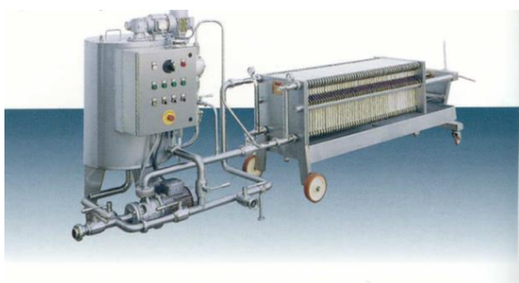
Slika 5 Filtar preša (web 3)

Filtar preše se prvenstveno koriste za filtriranje taloga. Konstrukcijski su slične pločastim filterima, ali imaju ugrađene vreće za prihvatanje filtriranog materijala, rezervoar s pumpama i mješalicama za mješanje materijala ( Slika 5 ).