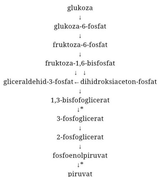
Slika 1 Glikoliza (web 2)

Glikoliza je skup reakcija koje kataliziraju mnogobrojni enzimi ( Slika 1 ). Važan korak u glikolizi je nastajanje gliceraldehid-3-fosfata jer se troši energija u obliku 2 molekule ATP-a. Nakon nastanka gliceraldehid-3-fosfata slijedi niz reakcija koje dovode do nastanka pirogroždane kiseline te energije u obliku 4 molekule ATP-a. Nakon toga u aerobnim uvjetima dolazi do dekarboksilacije piruvata i stvaranja acetila koji se vezan na koenzim A dalje razgrađuje u ciklusu limunske kiseline i oksidativne fosforilacije.