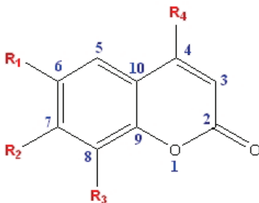
Slika 1. I) Herniarin R_1, R_3, R_4 = H, R_2 = OCH_3 ; II) Eskuletin R_1, R_2 = OH, R_3, R_4 = H ; III) Eskulin R_1 = 6\text{-glukozid}, R_2 = OH, R_3, R_4 = H ; IV) Skopoletin R_1 = OCH_3, R_2 = OH, R_3, R_4 = H ; V) Izoskopoletin R_1 = OH, R_2 = OCH_3, R_3, R_4 = H ; VI) Umbeliferon R_1, R_3, R_4 = H, R_2 = OH ; VII) Dihidro-kumarin R_1, R_2, R_3, R_4 = H ; VIII) 8-OAc-6-hidroksi-7-metoksi-4-metilokumarin R_1 = OH, R_2 = OCH_3, R_3 = COOCH_3, R_4 = CH_3 (Zolek i sur., 2003)

naveden na deklaraciji. Do usklađivanja s novom uredbom Europskog vijeća 1334/2008, u Hrvatskoj su propisi dopuštali razinu kumarina u hrani do 2 mg/kg s izuzetkom alkoholnih pića i karamela (do 10 mg/kg) te guma za žvakanje (50 mg/kg). Novom Uredbom ove su vrijednosti višestruko povećane, pa se za većinu namirnica kreću između 5 i 20 mg/kg do čak 50 mg/kg za novouvedenu kategoriju tradicionalnih pekarskih proizvoda s cimetom, koji je naveden na deklaraciji. Većina proizvoda koji nisu odgovarali u pogledu udjela kumarina odredbama Pravilnika o aromama, udovoljava novim zahtjevima (Papić, 2009).