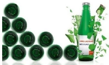
Slika 6 Inovativna PET bočica za pivo koja asocira na staklo

Švicarska tvrtka Sidel , specijalizirana za proizvodnju plastične ambalaže za tekuće proizvode, prošle je godine na tržište plasirala prvu laganu plastičnu bocu za pivo (Slika 6) koja podnosi pasterizaciju te ima dno koje nije u obliku cvijeta kao ostale plastične boce, čime asocira na staklenu bocu.