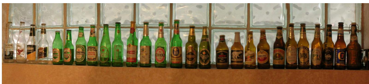
Slika 3 Staklena ambalaža za pivo

Kruna za zatvaranje (čep) izrađen je od bijelog lima i sadrži stlačivu podstavu materijala. Sastav mu se mijenjao tijekom godina. Građen je od čvrstog pluta, plastike i aluminijske folije u raznim kombinacijama. Danas je uporaba pluta vrlo rijetka, a većina čepova je obložena poli(vinil-kloridom) (PVC) ili ponekad polietilenom visoke gustoće (PEHD). Pluta se omotava aluminijskom folijom kako bi mu se poboljšala barijerna svojstava (Robertson, 1993).