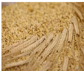
Slika 2 Prikaz ječma

( http://www.val-znanje.com/index.php/ljekovite-biljke/1021-hmelj-humululus-lupulus-l )