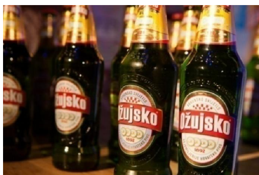
Slika 7 Ožujsko pivo s termoosjetljivom etiketom

Jedan od oblika takve vrste pakiranja su limenke piva koje se same hlade i na taj način osiguravaju kupcu održavanje osvježavajuće temperature jednog od omiljenih napitaka.