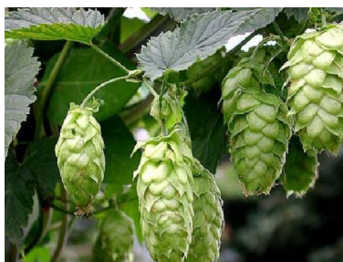
Slika 1 Prikaz biljke Hmelj

https://www.google.hr/search?q=je%C4%8Dam&espv=2&biw=1821&bih=857&site=webhp&source=lnms&tbm=isch&sa=X&ved=0CAYQ_AUoAWoVChMIxon6-rXtxwIV Ae8UCh0GVAdH&dpr=0.75#imgrc=qno0TW27MpHAHM%3A