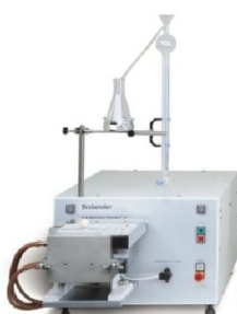
Slika 11 Farinograf (Web 7)

Farinograf je uređaj kojim se određuju svojstva i ponašanje tijesta pri miješanju. Princip rada farinografa se temelji na mjerenju otpora koje pruža tijesto pri miješanju u vremenu od trenutka formiranja tijesta do punog razvoja i tijekom daljnjeg miješanja do zaustavljanja miješalice. Analiza počinje zamjesom tijesta i traje 15 minuta, za to vrijeme uređaj ispisuje graf (farinogram) analize tijesta. Očitanjem farinograma se dolazi do podataka povezanih uz sposobnost upijanja, razvoj tijesta, stabilnost tijesta, otpor tijesta, stupanj omekšanja te elastičnosti i rastezljivosti tijesta, te se izračunavanjem površine koju zatvara farinografska krivulja te konzistencija od 500 FJ može odrediti kvalitetni broj i kvaliteta skupina. (Kljusurić, 2000)