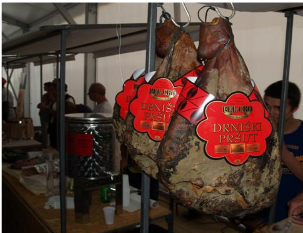
Slika 4 Drniški pršut (foto: Kovačević, D., 2016.; 3. Međunarodni festival pršuta, Drniš 2016.).