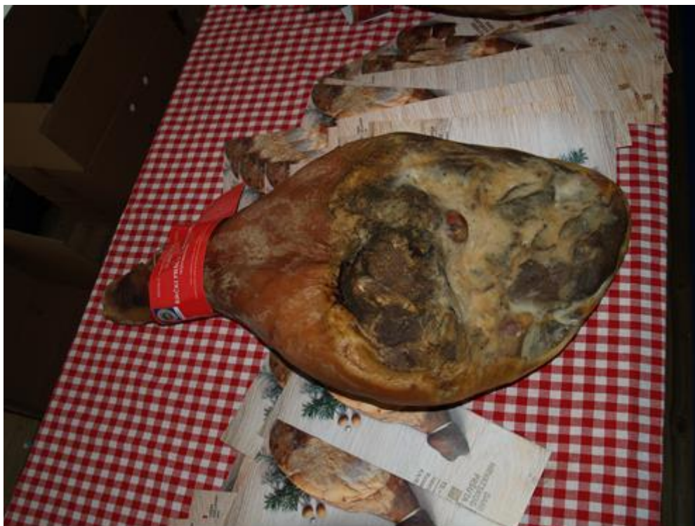
Slika 1 Krčki pršut (foto: Kovačević, D., 2016.;3. Međunarodni festival pršuta, Drniš 2016.).