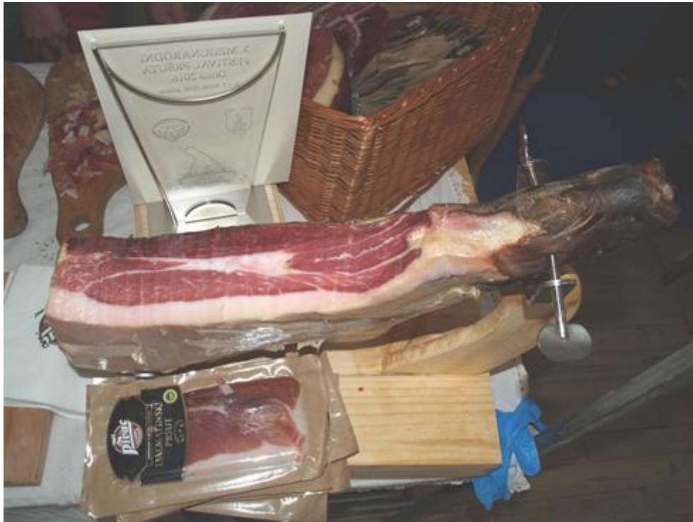
Slika 3 Dalmatinski pršut (3. Međunarodni festival pršuta, Drniš 2016.).