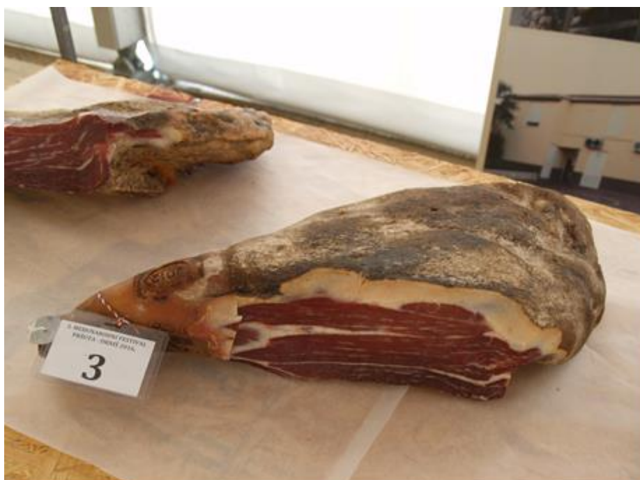
Slika 2 Presjek Istarskog pršuta (foto: Kovačević, D., 2016.; 3. Međunarodni festival pršuta, Drniš 2016.)