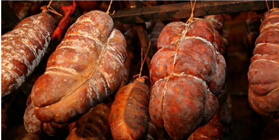
Slika 8. Pojava plijesni tokom zrenja

vlažnost zraka. Plijesni stvaraju nepoželjne crne, smeđe, bijele i zelene mrlje na površini, stvaraju neugodan miris i okus proizvoda, pogoduju razvoju truležnih bakterija i proizvode mikotoksine koji mogu predstavljati zdravstveni rizik za potrošače.