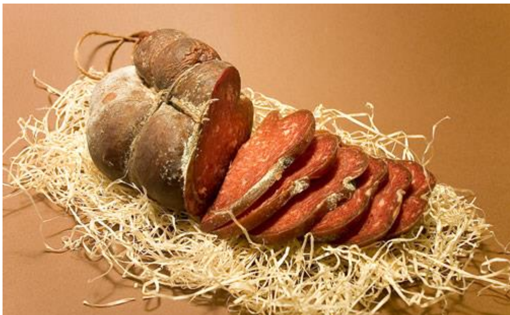
Slika 1. Slavonski kulen

Svake se jeseni u slavonskim gospodarstvima kolje stanoviti broj uhranjenih svinja za kućne potrebe. Takvo se klanje najčešće naziva svinjokoljom, a ima i drugih naziva kao što je kolinje, te karmina oko Slavonskog Broda. U gospodarstvima se klalo toliko svinja, koje se zvalo bravcima, pojišćima ili hranjenicima, koliko je prema broju članova u kućnoj zadruzi trebalo smoka, tj. mrsa od mesa i slanine. Obično se računalo tako da se za svaki oženjeni par zadruge ukućana zakolje po jedan bravac. Klalo se kad vrijeme zahladi i kad se počne smrzavati, a najviše od Svete Kate, 25. studenoga, do Božića i do kraja godine. Slavonski kulen je u pogledu hranidbene vrijednosti visokovrijedan proizvod od mesa s velikim udjelom bjelančevina i masti, a razmjerno malom količinom vode što predstavlja bogat izvor vrijednih bjelančevina i kalorija. Zbog svog posebnog i gurmanski svojstvenog okusa, kao i arome, pruža poseban užitak za uživatelja. Iz razloga što je izvorno-tradicijski povezan s hrvatskim običajima i načinom života, sve se više upoznaje i traži čak i u krajevima u kojima njegova proizvodnja nije uobičajena. Iz istih razloga je naročito prepoznat u svijetu što uvelike povećava njegovu potražnju na tržištu i potrebu za industrijskom proizvodnjom koja je pomno organizirana i kontrolirana po fazama proizvodnje. Svojom prepoznatljivošću je zauzeo važnu ulogu u restoranima i ugostiteljstvu gdje ga se sve češće pronalazi na jelovnicima kao hladno predjelo (Petričević, 1999.).