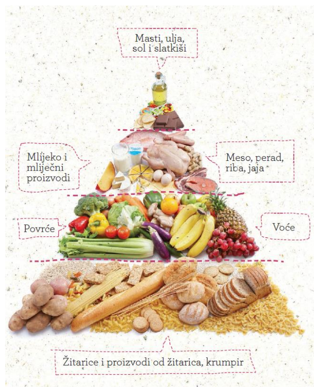
Slika 1 Klasična piramida zdrave prehrane (MZ, 2012)

Od doba prapovijesti čovjek se hranio različitom hranom i pronalazio nove načine dolaska do hrane. U svojim se početcima hranio sirovom hranom (ličinkama, suhim plodovima, ptičjim jajima, gušterima, itd.), no kasnije, izumom luka i strijele te drvenog koplja počinje loviti veće životinje. U starom se vijeku počinju izrađivati stvari potrebne za obradu zemlje, uzgajaju se žitarice, voće, povrće, vinova loza te masline. Tijekom srednjeg vijeka zemljoradnja je bila slabije razvijena te su se ljudi hranili većinom mesom i mliječnim proizvodima. Kasnije, u razdoblju renesanse, Marco Polo je kroz svoja putovanja skupljao začine, namirnice i nove načine za pripremu hrane pa su se tako pojavile nove namirnice poput krumpira, rajčice, krastavca, lješnjaka, kestena, banana, itd. U novom vijeku većina ljudi živi u gradovima i više nisu ovisni o obradi zemlje i vrtovima jer je omogućena kupnja namirnica u trgovinama. Na taj je način započela masovna distribucija hrane, a tako i suvremeno doba (E-Medica, ND).