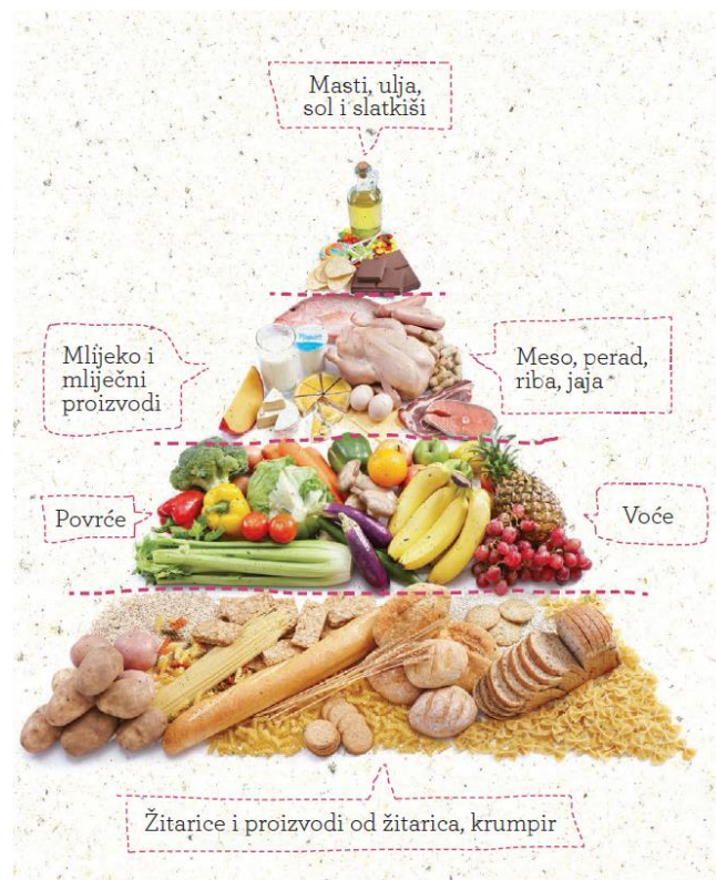
Slika 1 Klasična piramida zdrave prehrane (MZ, 2012)

Od doba prapovijesti čovjek se hranio različitom hranom i pronalazio nove načine dolaska do hrane. U svojim se početcima hranio sirovom hranom (ličinkama, suhim plodovima, ptičjim jajima, gušterima, itd.), no kasnije, izumom luka i strijele te drvenog koplja počinje loviti veće životinje. U starom se vijeku počinju izrađivati stvari potrebne za obradu zemlje, uzgajaju se žitarice, voće, povrće, vinova loza te masline. Tijekom srednjeg vijeka zemljoradnja je bila slabije razvijena te su se ljudi hranili većinom mesom i mliječnim proizvodima. Kasnije, u razdoblju renesanse, Marco Polo je kroz svoja putovanja skupljao začine, namirnice i nove načine za pripremu hrane pa su se tako pojavile nove namirnice poput krumpira, rajčice, krastavca, lješnjaka, kestena, banana, itd. U novom vijeku većina ljudi živi u gradovima i više nisu ovisni o obradi zemlje i vrtovima jer je omogućena kupnja namirnica u trgovinama. Na taj je način započela masovna distribucija hrane, a tako i suvremeno doba (E-Medica, ND).