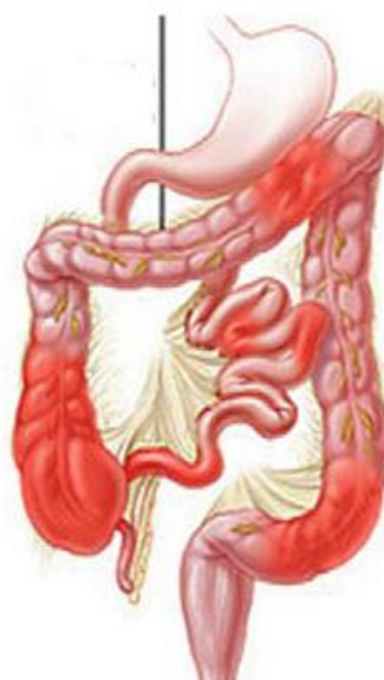
Slika 2 Shematski prikaz crijeva zahvaćenog Chronovom bolešću (Hojsak i sur., 2015)

Chronova bolest javlja se u tri oblika i to kao upalni tip, stenozirajući tip i penetrirajući tip (Vucelić, 2013). Može zahvaćati bilo koji dio probavne cijevi ( Slika 2 ) a najčešći simptomi su proljev, bolovi u truhu i gubitak na težini uslijed malapsorpcije hranjivih tvari. Kod djece se kao klinički simptom bolesti često uočava zastoju rastu i zakašnjeni pubertet, kao i povremeno nejasno povišenje tjelesne temperature (Vucelić i Čuković-Čavka, 2006). Tijek bolesti karakterizira izmjena perioda aktivnosti i remisije bolesti (Vucelić, 2013).