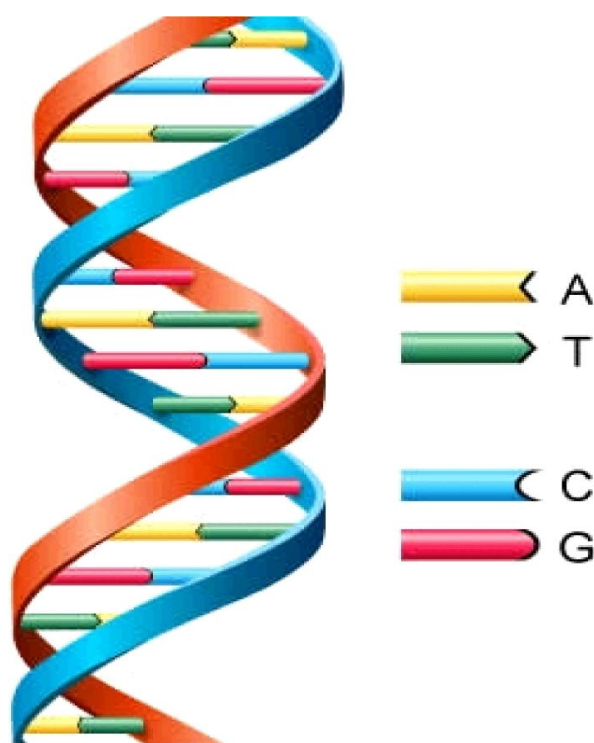
Slika 1 Prikaz molekule DNA i komplementarnih baza (Kabir, 2011)

Deoksiribonukleinska kiselina (DNK) je polimer nukleotida. Ima oblik dvostruke spiralne zavojnice, te je izgrađena od šećera deoksiriboze, fosforne kiseline i dušičnih baza (adenin- A, gvanin- G, timin- T, citozin- C). Nalazi se u jezgri stanice i upakirana je u kromosome. Kromosomi su štapičaste tvorevine vidljive tek u staničnoj diobi. DNA je osnovna molekula nasljeđivanja. Redoslijed baza u DNA određuje redoslijed aminokiselina u strukturi bjelančevina i njenu funkciju u organizmu. Gen je kraći dio molekule DNA i sadrži upute za sintezu bjelančevina i RNK (ribonukleinska kiselina). Čovjek ima oko 100.000 gena. Dva lanca DNA su komplementarna i antiparalelna. Komplementarne baze su adenin-timin i gvanin-citozin ( Slika 1 ). Zbog svoje komplementarnosti gen (DNA) se može umnožiti, rekombinirati ili mutirati (Čorić, 2003).