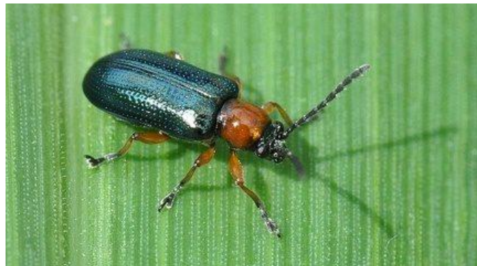
Slika 13. Žitni balac (lema)