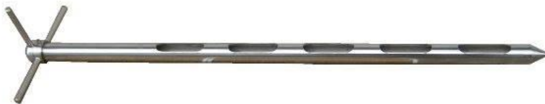
Slika 16. Ručna sonda za uzorkovanje ječma (Web 9)

Uzorkovanje ručnom sondom (Slika 16.) obavlja se na način da se zatvorena sonda zabode u ječam potom se otvaraju zasuni po dužini sonde te se laganim protresanjem sonde omogućava ulazak ječma u cijev sonde. Zasuni na sondi se zatvaraju i sonda se izvlači iz ječma te se nagne nad kantom i ječam se istrese.