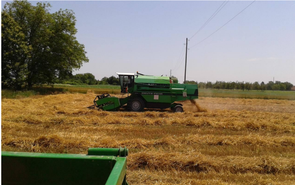
Slika 14. Žetva ječma (Web 8)

gubitke imati na polegnutom ječmu. polijeganje smanjuje prirod i povećava gubitak, ali smanjuje i kakvoću pivarskog ječma jer se smanjuje postotak ugljikohidrata, a povećava postotak bjelančevina (Gagro, 1997).