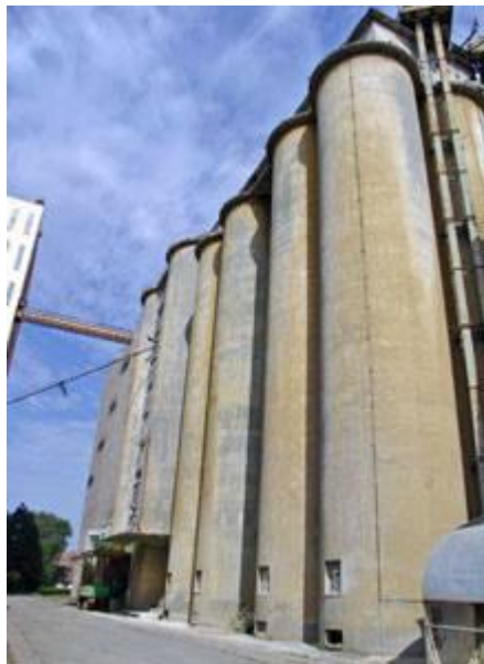
Slika 18. Silos (Web 2)