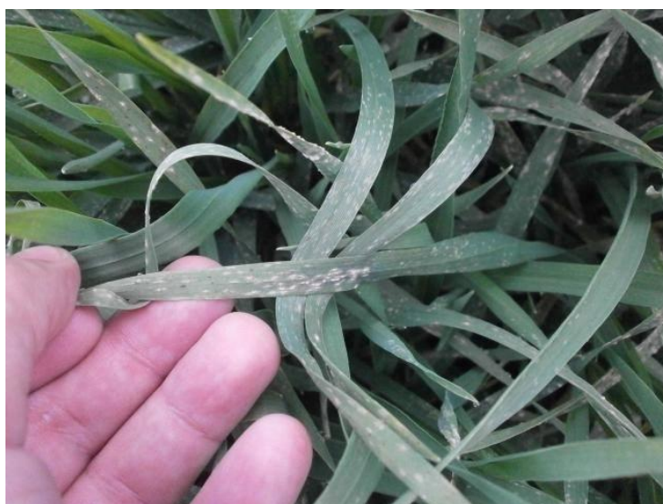
Slika 11. Pepelnica ječma (Web 7)