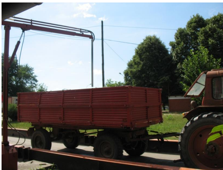
Slika 15. Uzimanje uzorka ječma automatskom sondom

Automatska sonda je uređaj konstruiran u svrhu bržeg, jednostavnijeg i kvalitetnijeg uzimanja uzoraka. Radi na principu pneumatskog transporta zrna, a ostvaruje se pomoću ventilatora ugrađenog u ciklonu smještenog na stolu rukovaoca, te elastičnog crijeva sonde i usisnog grla na vrhu sonde. Ugrađuju se na prijemnim mjestima uz vagu. Dolaskom transportnog vozila na vagu, sonda se pomoću hidraulike zabode do dna vozila (Slika 15.), a u trenutku izvlačenja ječma se uvlači po cijelom nasutom presjeku. Radnja se mora ponoviti više puta i na više mjesta što omogućuje dobivanje reprezentativnog uzorka. Ječam elastičnim crijevom dolazi u prijemni uređaj koji se nalazi u prostoriji. Iz prijemnog uređaja ječam se sipa u posudu iz koje on dalje ide na pakovanje i analizu. Postupak traje maksimalno 1 minutu.