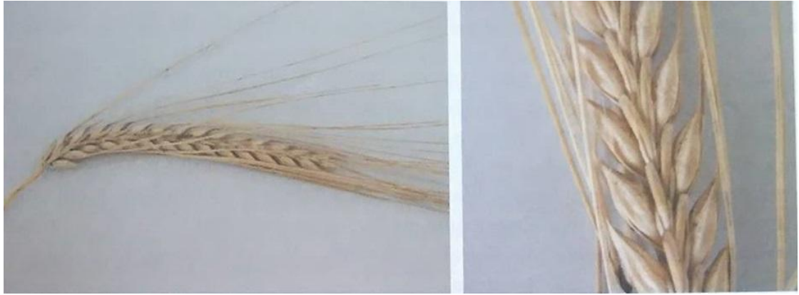
Slika 5. Dvoredni ječam