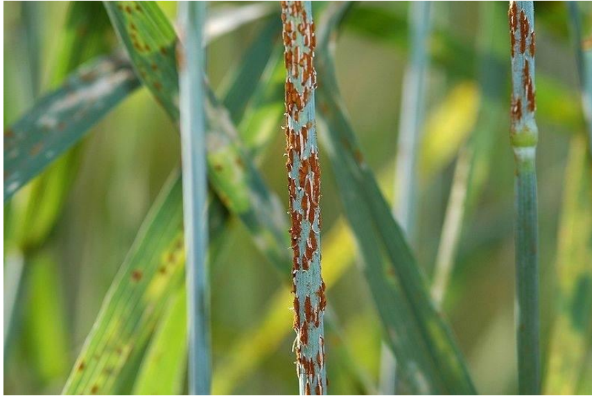
Slika 12. Smeđa rđa ječma (Web 7)