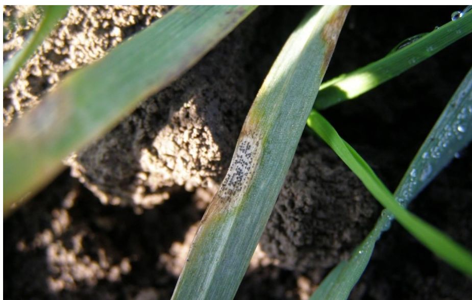
Slika 9. Siva pjegavost ječma (Web 7)

Najznačajnije bolesti kod ječma koje mogu izazvati velike štete su siva pjegavost ječma ( Rynchosporium secalis ) (Slika 9.), zatim mrežasta pjegavost ječma ( Pyrenophora/Helminthosporium teres ) (Slika 10.), pepelnica ječma ( Erysiphe graminis f.sp. hordei ) (Slika 11.) i smeđa rđa ječma ( Puccinia hordei ) (Slika 12.). Neke od aktivnih tvari i njihove kombinacije za suzbijanje ovih bolesti su: azoksistrobin, azoksistrobin + ciprokonazol, epoksikonazol + metiltiofanat, flutriafol, propikonazol + karbendazim, propikonazol + ciprokonazol. Najznačajniji štetnik ječma koji može nanijeti velike štete je lema ili žitni balac ( Oulema melanopus L.) (Slika 13.). Pojavljuje se u drugoj polovici svibnja i početkom lipnja, a najveće štete nanosi ličinka i to najvećim dijelom u jarim usjevima. Suzbijanje se provodi insekticidima na bazi aktivnih tvari: deltametrin, lambda- cihalotrin, esfenvalerat i dr. Kod ječma treba obratiti pažnju i na pojavu lisnih ušiju koje prenose virusnu bolest žutu patuljavost (kržljivost) ječma ( Rhopalosiphum padi L., Rh. maidis fitch, Sitobion avenae F., Schizaphis graminum Rond.). U pojedinim godinama štete mogu biti značajne te je potrebno lisne uši suzbijati odgovarajućim insekticidima (Pospišil, 2010).