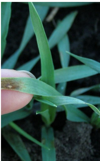
Slika 10. Mrežasta pjegavost ječma (Web 7)