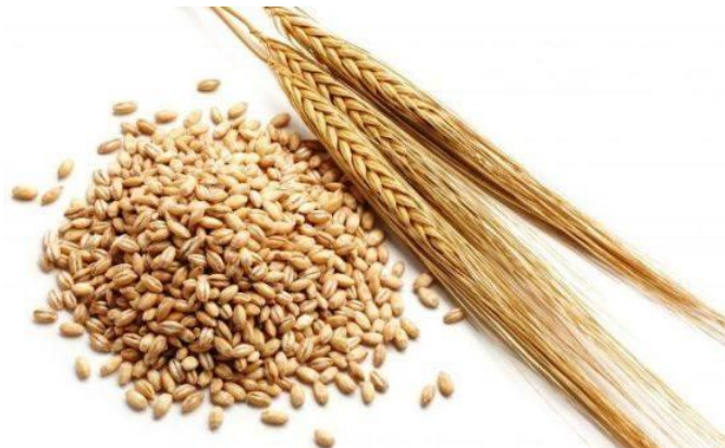
Slika 7. Plod ječma (Web 5)