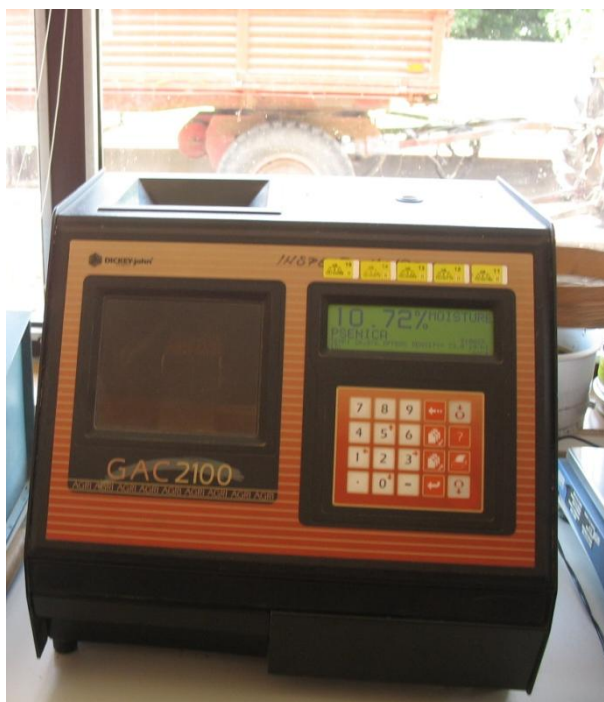
Slika 17. Dickey-John uređaj

iskazuju postotak vlage, hektolitarska masa, te temperatura ječma. Nakon mjerenja ječma pritiskom na tipku pražnjenje uređaj se prazni.