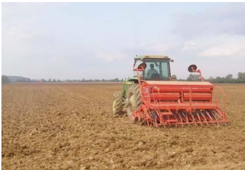
Slika 8. Sjetva ječma (Web 6)

Sjetva ozimog ječma treba započeti potkraj rujna, a završiti najkasnije do polovice listopada. Zbog ranije sjetve ječam prebujan ulazi u zimu, što smanjuje otpornost na niske temperature, na koje je ječam inače osjetljiv. Sjetva nakon polovice listopada također nije dobra jer ječam treba izbusati ujesen i dobro se pripremiti za zimu, a to pri kasnijoj sjetvi nije moguće. Sjetva jarog ječma još je osjetljivija jer loši vremenski uvjeti i vlažno tlo mogu onemogućiti pravodobnu sjetvu. Najbolje rezultate postići ćemo ranom sjetvom, već krajem siječnja i u veljači. Tada ječam ima dovoljno vremena za vegetaciju i može najbolje iskoristiti zimsku vlagu, niske temperature i slabiji intenzitet bolesti i štetnika. U kasnijoj sjetvi sve će to izostati (Gagro, 1997). Sjetva ječma se obavlja žitnim sijačicama u redove razmaka 12, 5 ili 15 cm. Dubina sjetve ovisi o tlu, temperaturi i vlažnosti tla te roku sjetve i iznosi za ozimi ječam 3 - 5 cm. Na lakšim i sušim tlima sije se dublje (4 - 5 cm), a na težim tlima pliće (3 cm). Za jari ječam dubina sjetve iznosi 3 - 4 cm (Pospišil, 2010).