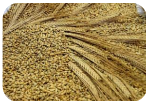
Ječam u klasu i zrnu