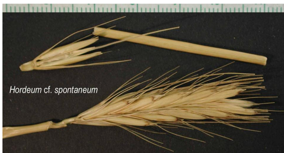
Slika 2. Divlji dvoredni ječam Hordeum spontaneum (Web 4)

Ječam spada u najstarije kulturne vrste. Uzgajan je prije šest do sedam tisuća godina u Egiptu, te prije pet tisuća godina u Indiji i Kini. Dva su ishodišna centra (gen-centri) ječma: istočnoazijski koji obuhvaća područje Tibeta, Kine i Japana, te etiopski centar (Kovačević, Rastija, 2009). Praroditelj kulturnih ječmova još nije točno utvrđen. Smatra se da je dvoredni ječam nastao od divljeg dvorednog ječma Hordeum spontaneum (Slika 2.). Praroditelj višerednih ječmova je divlji dvoredni ječam Hordeum ischnatherum od kojeg je umnožavanjem klasića nastao višeredni ječam. (Pospišil, 2010).