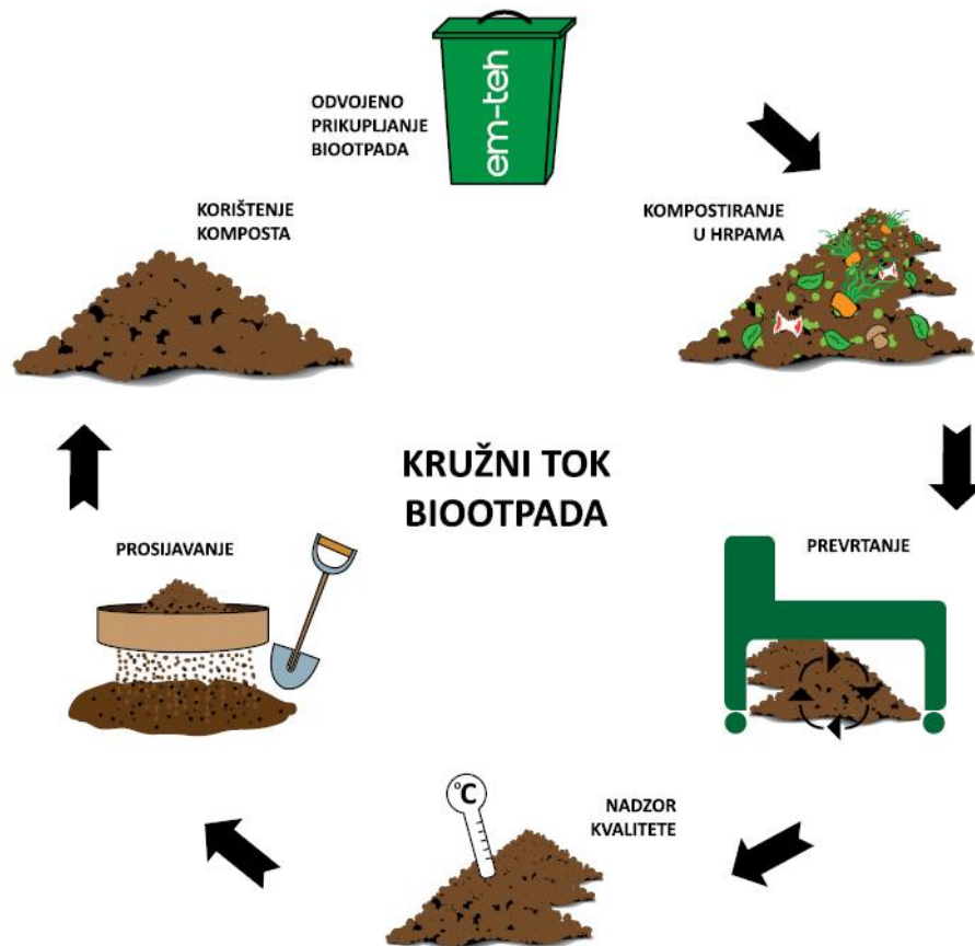
Slika 2. Kompostiranje bio otpada

Biootpad je kuhinjski otpad (ostaci od pripreme hrane) i vrtni ili zeleni otpad. Čini gotovo trećinu kućnog otpada i vrijedna je sirovina za proizvodnju kvalitetnog biokomposta. Najbolje je da se biootpad biološki prerađuje na mjestu njegovog nastanka kompostiranjem. Kompostiranjem biootpada se u kontroliranim uvjetima odvija razgradnja organske tvari u stabilno stanje u kojemu dobivamo koristan proizvod koji može poslužiti kao poboljšivač tla. U procesu kompostiranja ključnu ulogu imaju mikroorganizmi koji uz odgovarajući stupanj vlažnosti i kisika prerađuju organsku tvar u kompost. Na brzinu procesa kompostiranja ograničavajući činitelj je udjel ugljika i dušika u sastavu organske tvari, jer su ta dva elementa neophodna za mikrobiološku aktivnost i rast. Naime, ugljik (C) je izvor energije, a dušik (N) je neophodan za rast mikroorganizama koji sudjeluju u procesu kompostiranja organske tvari. Stoga dodavanje kultura mikroorganizama u kompostnu masu može značajno utjecati na brzinu kompostiranja i kvalitetu kompostne mase.