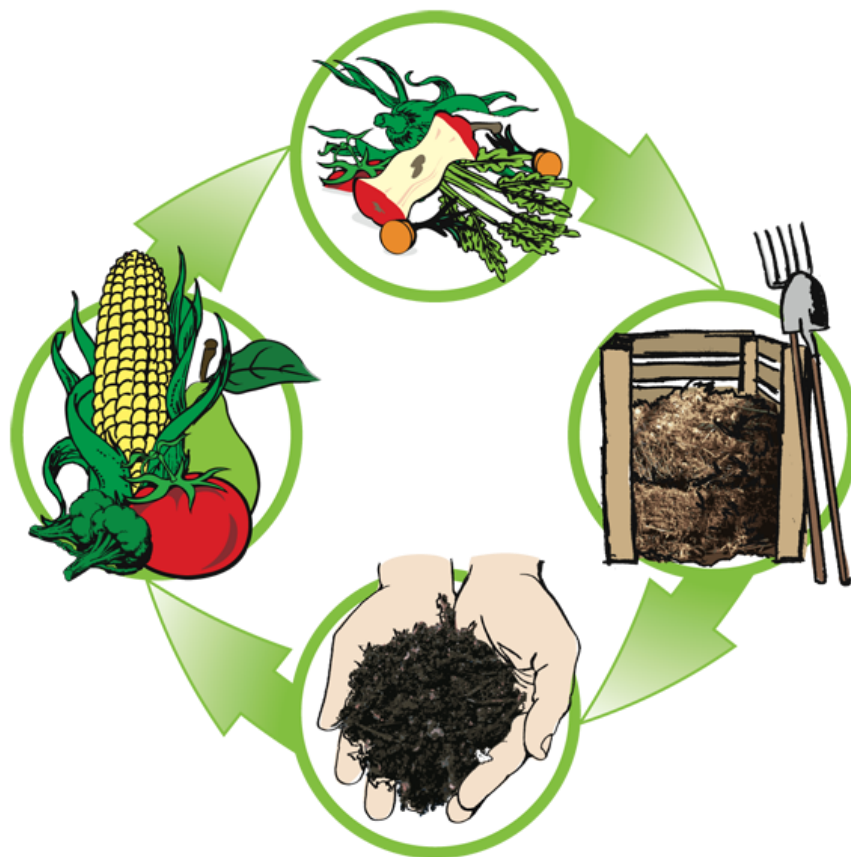
Slika 3. Proces kompostiranja

Kompostirati možemo u hrpi koja može biti slobodnostojeća, ograđena drvom, ciglom, žicom ili u specijalnim komposterima koji se mogu kupiti u trgovini.