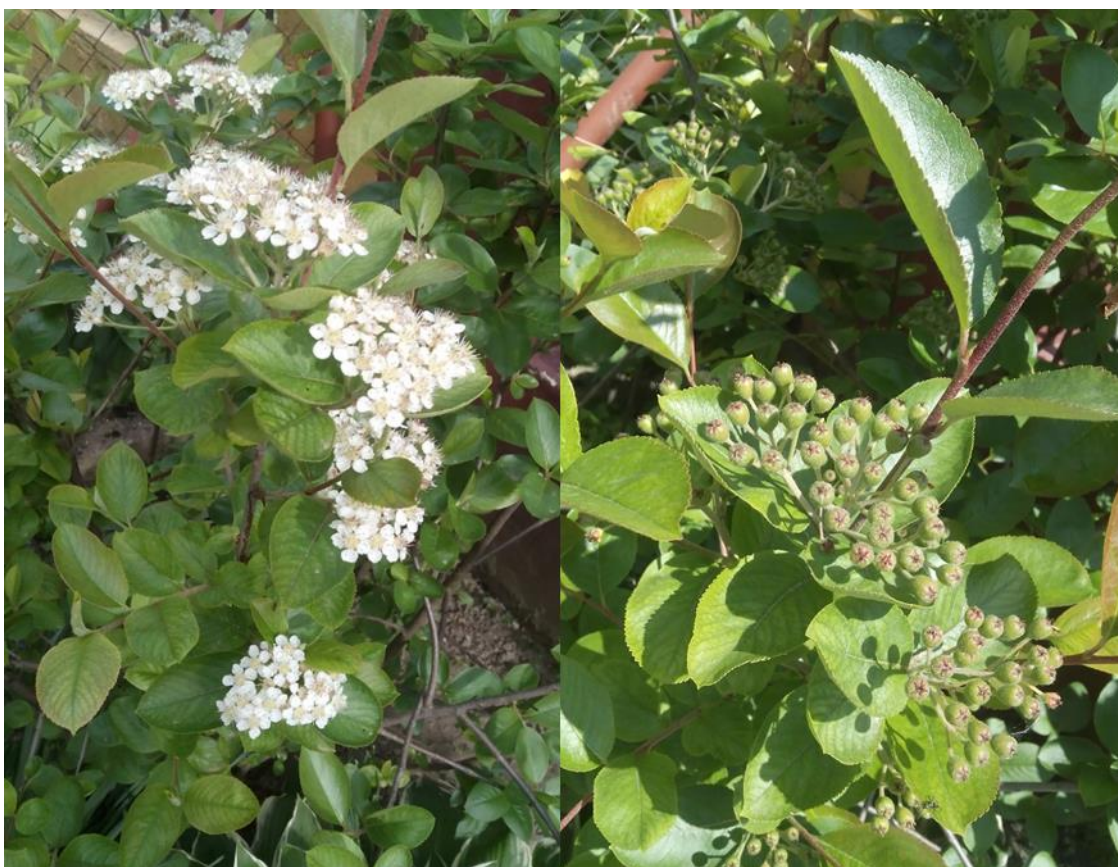
Slika 1 Aronija u fazi cvatnje i formiranja ploda

Aronija je grmovita listopadna biljka koja pripada porodici Rosaceae. Dvije su osnovne vrste aronije: Aronia melanocarpa (Michx.) Elliot i Aronia arbutifolia (L.) Pers., a u literaturi se često navodi i treća Aronia prunifolia koja je hibrid prethodno navedenih (Lupascu i sur., 2016.). Međutim najpoznatija i najviše uzgajana je Aronia melanocarpa tzv. crnoplodna aronija čiji grm doseže visinu do 3 metra, te dužinu od 2,5 metra. Nakon razvoja ovalnih listova nazubljenog ruba dolazi do pojave prvih cvjetova bijele boje koji se sakupljaju u grozdove ( Slika 1 ). Cvatnja počinje u svibnju i traje 10-ak dana (Siroglavić, 2015.).