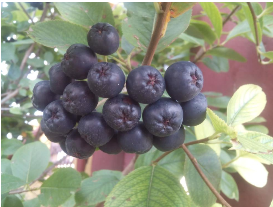
Slika 2 Zreli plodovi crnoplodne aronije

razloga prerade u prihvatljivije oblike. Ukoliko se radi o sokovima tada u obzir dolazi kombiniranje sa sokovima jabuke, kruške i raznog bobičasto voća (Kulling i Rawel, 2008.).