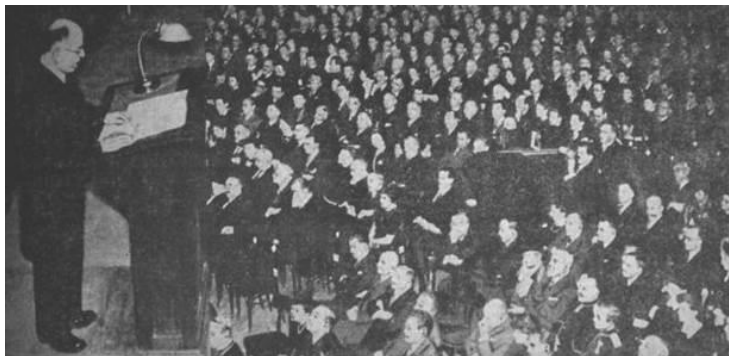
Slika 3. Ružičkino predavanje „Od dalmatinskog buhača do seksualnih hormona“, u Zagrebu, 16. ožujka 1940.

Člankom „Doctor honoris causa dr. Lavoslav Ružička istakao je prilikom svečane promocije vjeru da će naša znanost dati još više lijepih plodova sada, kad su se sve snage hrvatskog naroda ujedinile“, Novosti , god. XXXIV., br. 77, 18. III. 1940., str. 5. – 6., obuhvaćene su i fotografije sa znamenitog Ružičkinog predavanja, održanog 16. ožujka 1940. (jedna je prikazana na Slici 3).