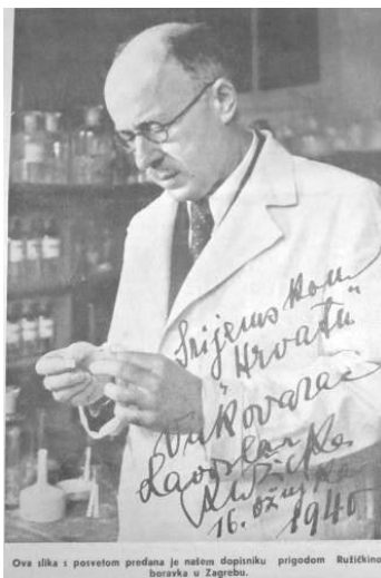
Slika 4. Ružičkina fotografija s posvetom Srijemskom Hrvatu

svećenik-župnik Antun Milfajt, što više podataka iz Ružičkinog života, te da to objavi kao pripremu za organiziranje svečane akademije, na kojoj će se iznijeti djelovanje i rad prof. Ladislava 24 Ružičke, rođenog Vukovarca, koji je odlikovan najvišim odlikovanjem za zasluge u radu na naučnom polju 19. svibnja 1940. u Vukovaru. Autor je objavio i Ružičkinu fotografiju iz laboratorija, na kojoj se Ružička potpisao, kao Vukovarac s posvetom Srijemskom Hrvatu (Slika 4).