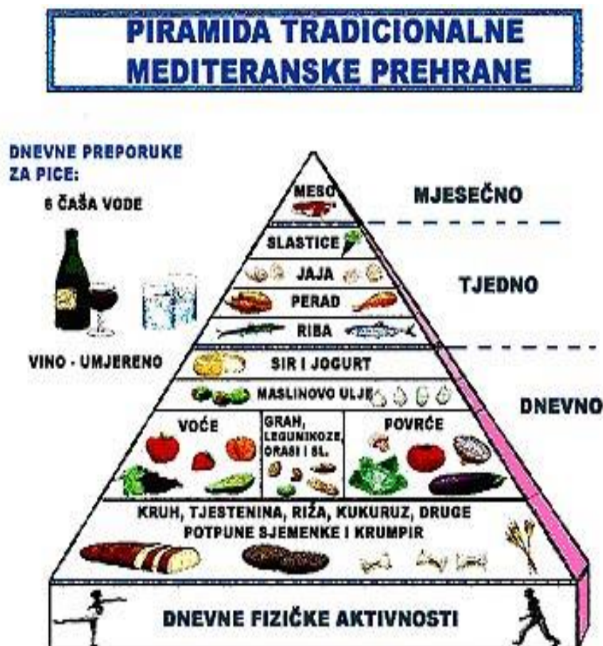
Slika 3. Piramida tradicionalne mediteranske prehrane

javnog zdravstva te OPET 4 -a i grčkih znanstvenika razvijena je Piramida tradicionalne prehrane. Istu prikazuje Slika 3.