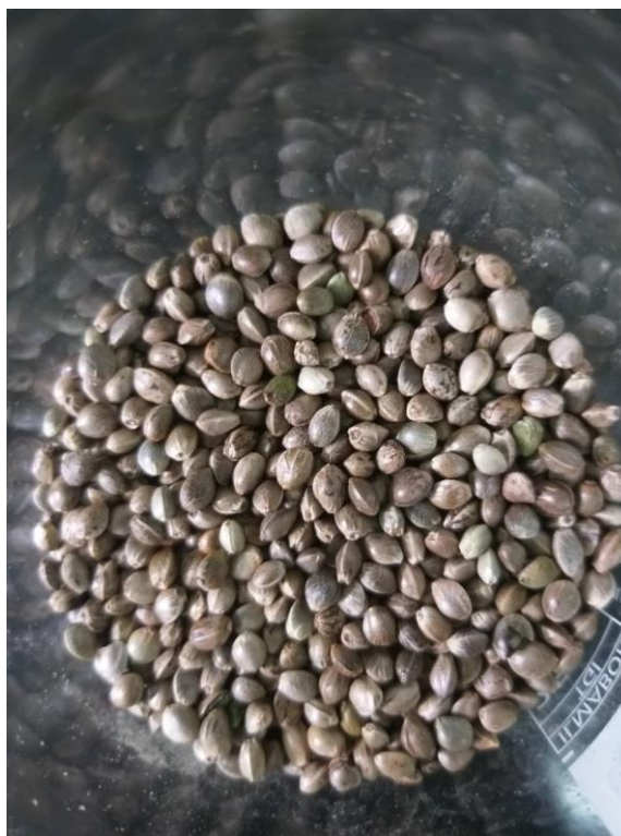
Slika 3 Ispitivani uzorci neoljuštene sjemenke konoplje sorte Finola

U ovom diplomskom radu korišteno je sjeme konoplje sorte Finola . Na Slici 3 prikazani su uzorci očišćenog, osušenog i neoljuštenog sjemena konoplje korišteni za proizvodnju hladno prešanog ulja.