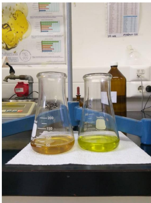
Slika 10 Titracija ulja s NaOH