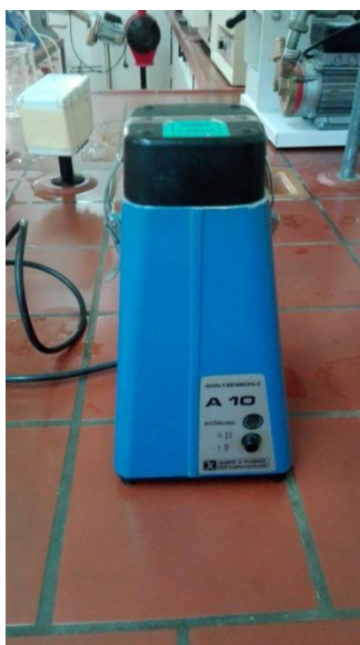
Slika 7 Laboratorijski mlin

m_2 – masa posudice s uzorkom nakon sušenja (g).