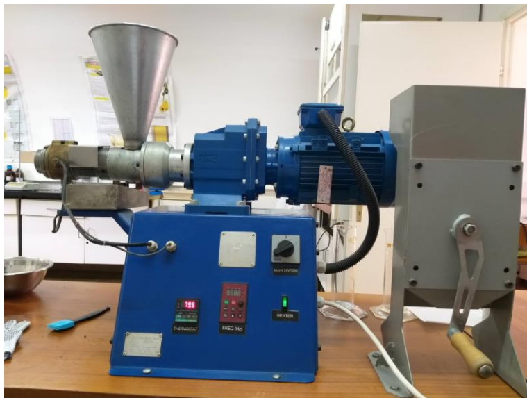
Slika 4 Kontinuirana pužna preša tvrtke ElektroMotor-Šimon

U ovom diplomskom radu za proizvodnju hladno prešanog ulja konoplje korištena je laboratorijska kontinuirana pužna preša tvrtke „ElektroMotor-Šimon“ iz Srbije ( Slika 4 ). Snaga elektromotora je 1,5 kW.