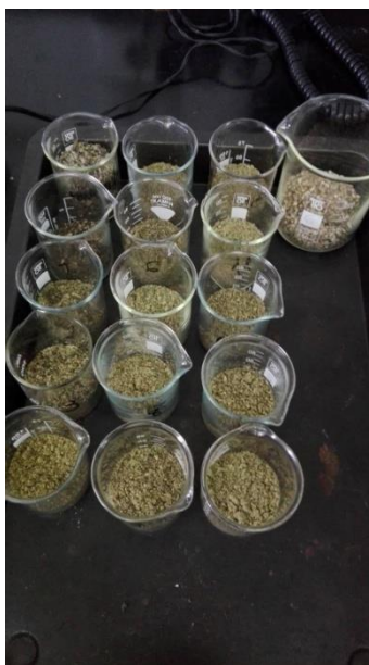
Slika 8 Samljevene pogače konoplje