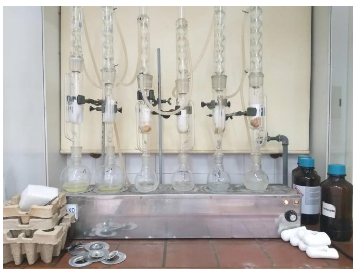
Slika 9 Soxhlet metoda