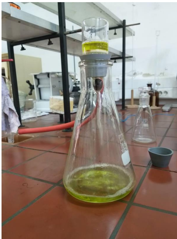
Slika 11 Vakuum filtracija staklenim lijevkom sa sinteriranim dnom

m_2 – masa filter lijevka nakon sušenja s nečistoćama (g).