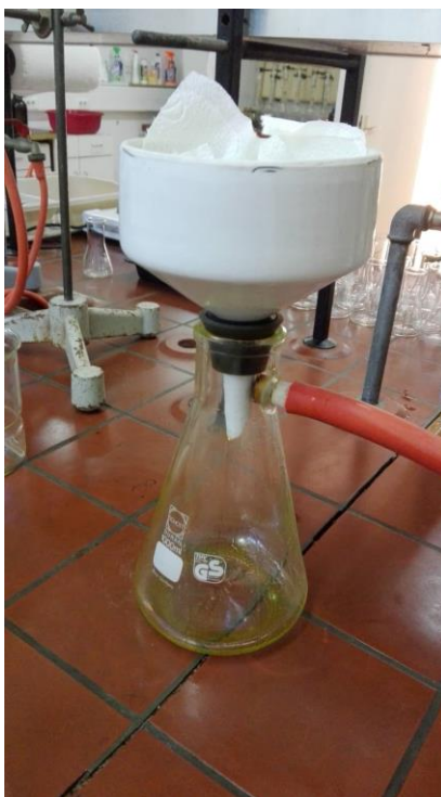
Slika 6 Vakuum filtracija sirovog ulja

Ispitivao se utjecaj sljedećih procesnih parametara na iskorištenje ulja tijekom prešanja sjemenki konoplje: