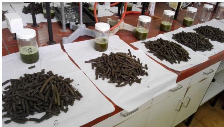
Slika 5 Sirovo ulje konoplje u staklenkama i pogače

Masa konoplje za prešanje u jednom uzorku iznosila je 1 kg, a sveukupno je pripremljeno četrnaest uzoraka. Proizvedeno sirovo ulje je sakupljano u menzuru te su mjereni volumen i temperatura. Sirovo ulje je potom preneseno u staklenke ( Slika 5 ) te ostavljeno u njima u tamnom prostoru 10 dana. Tijekom tog perioda odvijala se prirodna sedimentacija pri čemu su se zaostale krute čestice zbog svoje veće specifične mase nataložile na dno staklenke. Nakon provedene sedimentacije izdvojeno ulje se filtriralo vakuum filtracijom ( Slika 6 ) te je stavljeno na skladištenje u hladnjak u tamnim bocama. Pogača nastala tijekom prešanja se sakupljala i vagala na laboratorijskoj vagi.