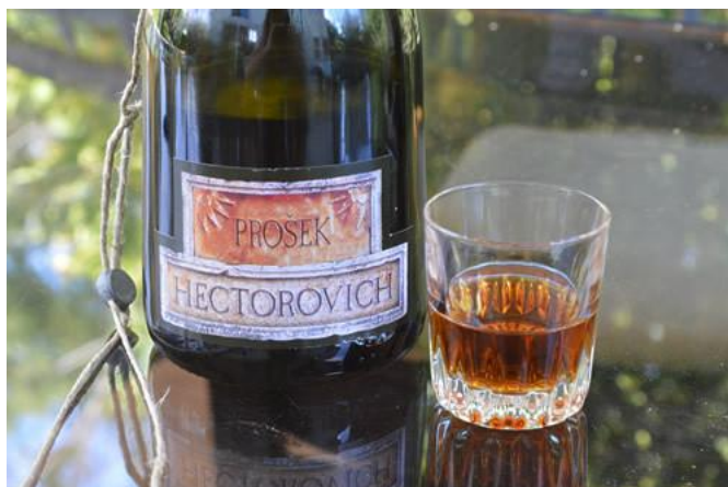
Slika 1 Prošek Hectorovich 2007 (web 7)