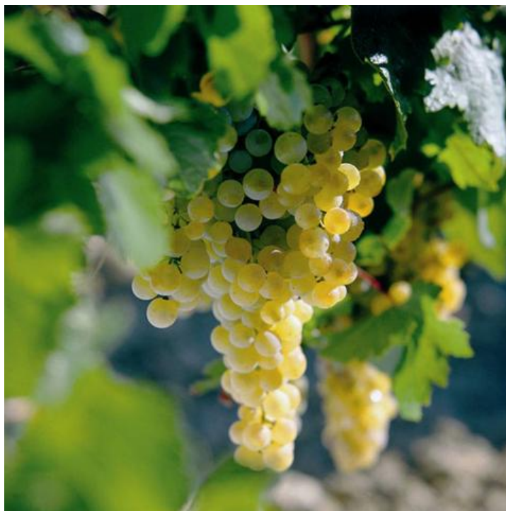
Slika 3 Sorta palomino (web 4)

Nakon završetka alkoholnog vrenja vina sadrže i do 15 vol. % alkohola. Vina se zatim tipiziraju (određuje se tip sherryja koji se želi proizvesti). Nakon tipiziranja vina zriju u otpražnjenim bačvama pri čemu kvasci pokreću proces šerizacije, koji traje nekoliko godina. Tijekom proizvodnje sljubljuju se stare i nove „partije“ vina pomoću sustava solera pa zaton sherryji u pravilu ne nose oznaku godine berbe. Prije samog punjenja u boce provodi se tipizacija i korekcija alkohola (kreće se od 16 do 22 vol. %). Sherryji seposlužuju kao aperitiv ili uz deserte.