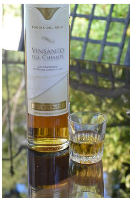
Slika 2 Vin Santo 2006 (web 7)

Jedno od najboljih svjetskih desertnih vina je Vin santo koji se proizvodi po cijeloj Italiji, ali je najcjenjeniji toskanski ( Slika 2 ). Proizvodi se od prosušenih bobica grožđa, najčešće od sorata trebbiano i malvasija (web 3). Grožđe se suši na slamnatim prostirkama, a preša se između studenog i ožujka (što kasnije, to je koncentracija šećera veća). Potom sazrijeva u drvenim bačvama najmanje tri godine. Temperatura koja se mijenja tijekom čuvanja daje vinu pikantnu, intenzivnu voćnu aromu. Ovakvo vino sadrži: alkohola od 14 do 15 vol%, šećera 7 do 12%, ukupnih kiselina od 5 do 7 g/l i suhog ekstrakta od 20 do 23 g/l. Vin santo može biti suho ili slatko vino.