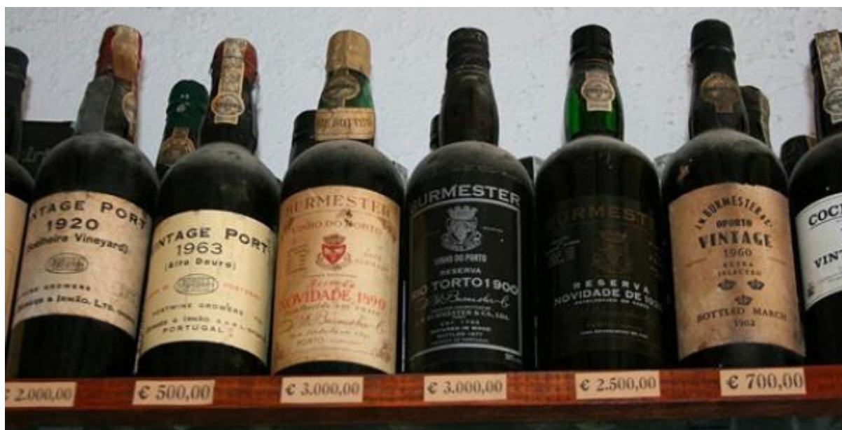
Slika 4 Vintage port ili portos oznakom godišta (web 5)