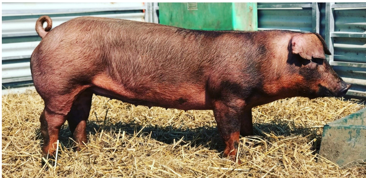
Slika 4. Durok ( https://www.dewsburyspork.com.au/page/our-breeds/ )

Prilagođeni podaci koji opisuju udjele pojedinih tkiva i klaoničku vrijednost crne slavonske svinje, mangulice i „Hypor“ hibrida svinje prikazani su u tablici 1 . Dodatno je prikazan i kemijski sastav musculus longissimus dorsi -ja (Kralik, 2007.).