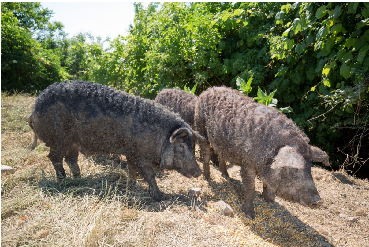
Slika 2. Mangulica ( https://www.jutarnji.hr/vijesti/hrvatska/je-li-ova-cupava-domaca-zivotinja-kljuc-nove-renesanse-naseg-stocarstva-njezino-se-meso-u-njemackoj-i-svicarskoj-prodaje-i-po-60-eura-za-kilogram-6176651 )

Mesnato-masne pasmine koje se još nazivaju prijelazne pasmine svinja, pogodne su za poluintenzivan uzgoj, a samim time su i odlična sirovina za proizvodnju autohtonih mesnih proizvoda. Kao primjer mesnato-masne, odnosno prijelazne pasmine svinja, na području Hrvatske najpoznatija je crna slavonska svinja. U trenutku postizanja mase od 95 do 110 kg ima dobru tovnost i mesnatost. Međutim, prilikom dostizanja mase od 120 do 140 kg, udio masnog tkiva u polovicama se kreće od 40 do 45%. Korištenjem ove pasmine mogu se popraviti konstitucijska svojstva i kvaliteta mesa (prvenstveno intramuskularno masno tkivo) mesnatih pasmina svinja (Kovačević, 2004.). U istraživanju koje su proveli Karolyi i suradnici, kako bi se poboljšali plodnost i mesnatost pasmine, predlaže se križanje s produktivnijim pasminama poput duroka. Pri tome bi se očuvala kakvoća mesa i njegova karakteristična svojstva poput većeg udjela intramuskularne masti.