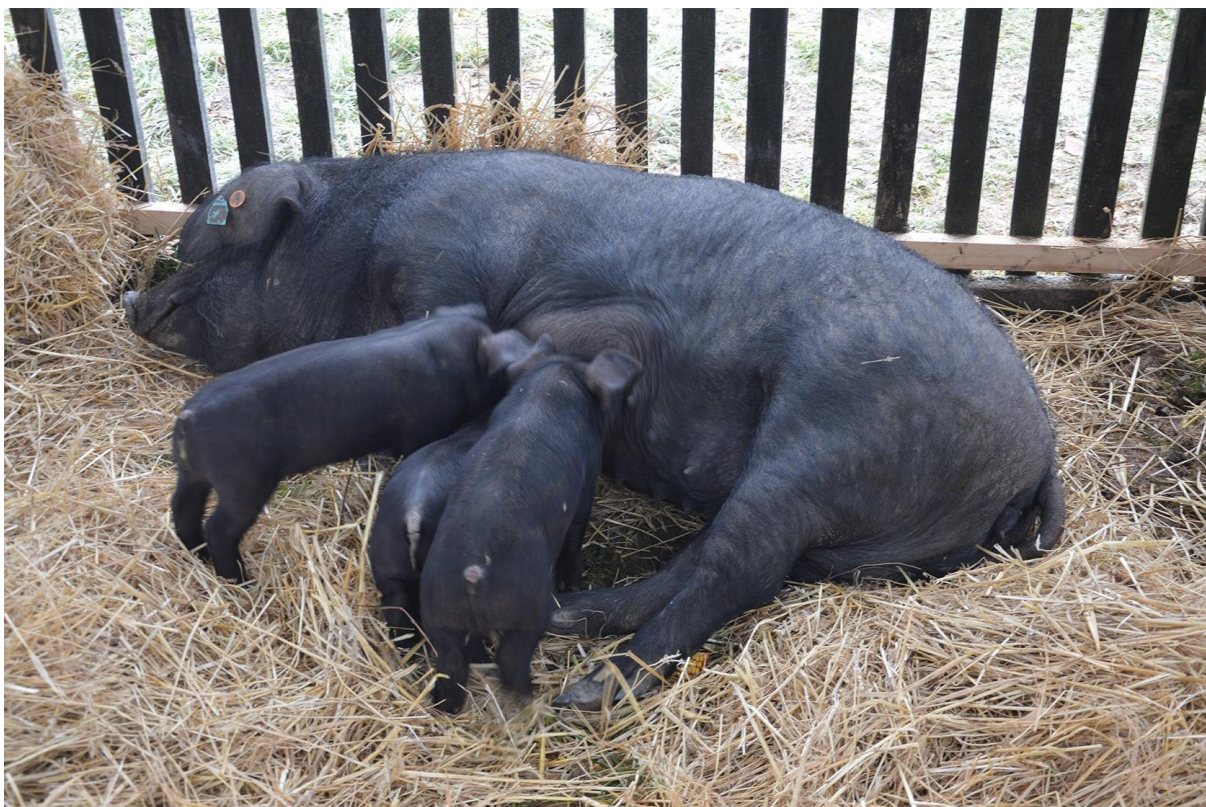
Slika 3. Crna slavonska svinja ( https://compas.com.hr/clanak/1/1732/prvom-cvarkijadom-prezentirane-mogucnosti-uzgoja-crne-slavonske-svinje.html )

Mesnate, odnosno plemenite pasmine svinja predstavljaju najbrojniji proizvodni tip svinja u svijetu. Najznačajniji predstavnici ove skupine svinja su veliki jorkšir, njemačka plemenita svinja, danski landras, njemačka oplemenjena svinja, švedski landras i nizozemski landras. Ove pasmine svinja odlikuju se dobrom plodnošću, tovnošću i mesnatošću, dok se kao glavni nedostaci navode slabija konstitucija praćena sklonošću stresa i nastanka BMV mesa. Karakteriziraju ih razvijen i mišićav vrat te dobro razvijeni butovi i leđni dio trupa. Nastanak i uzgoj izrazito mesnatih pasmina svinja datira nakon 1. svjetskog rata. Karakterizira ih najveća mesnatost u odnosu na druge pasmine, ali su neplodnije, manje otporne na vanjske čimbenike i posebice sklone stresu i nastanku BMV mesa. U ovu skupinu ubrajaju se belgijski landras, pietren, hampšir, durok, kineske pasmine i njemački landras. Ova skupina svinja se koristi u programima križanja zbog visoke mesnatosti, posebice kao terminalne očinske pasmine u tropasminskom križanju ili za proizvodnju nerasta u četveropasminskom križanju (Kovačević, 2004.).