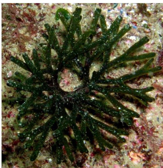
Slika 5 Codium vermilara

(web5- https://www.marinespecies.org/photogallery.php?album=770&pic=15050 , pristupljeno 16. 9. 2022.)