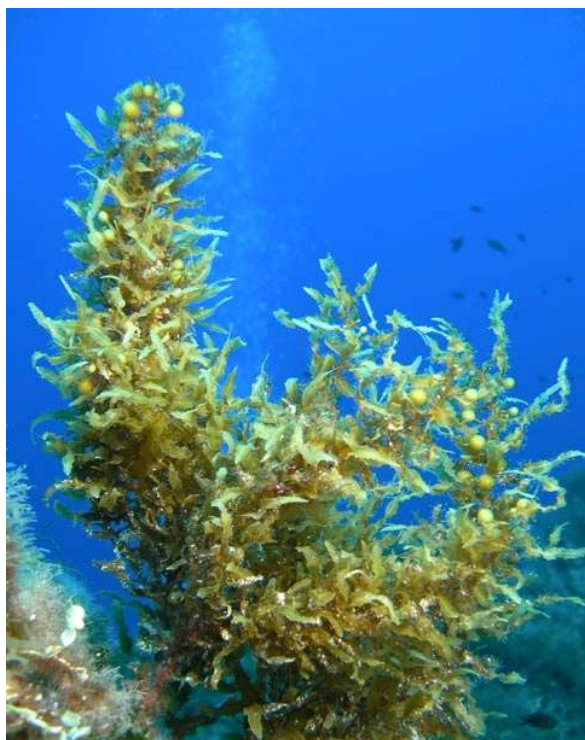
Slika 3 Sargassum hornschurchii