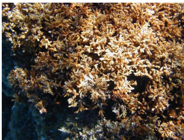
Slika 2 Cystoseira spicata

Slika 2 prikazuje vrstu Cystoseira spicata koja je karakteristična po tome da u ljetnom periodu otpušta dijelove i zaostaje samo kratko stablo. Nalazi se u izobilju u obalnom području Boke Kotorske i Crne Gore. Ekstrakti iz ovih algi imaju dobro antioksidativno, antitrombocitno i antikancerogeno djelovanje in vitro (Stanojković i sur., 2014).