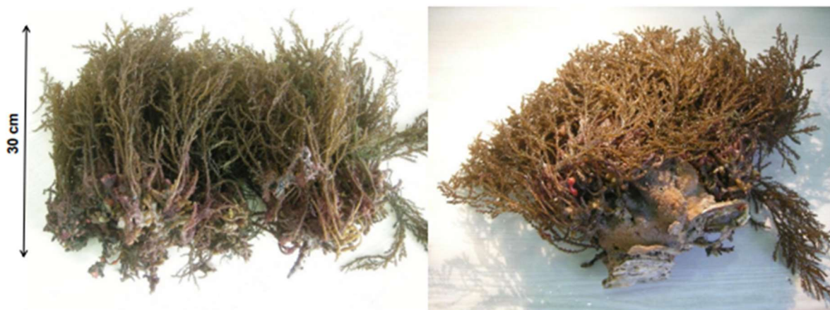
Slika 1 Cystoseira corniculata