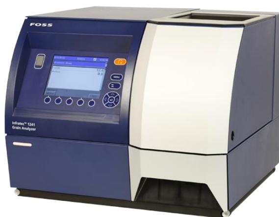
Slika 3. Infratec 1241 Grain Analyzer ( https://www.gerber-instruments.com/en/suppliers/foss/cereals-flour-and-feed-analysis/infratec-1241.html )

Polazni pokazatelji kakvoće pšenice (masa 1000 zrna, udio staklavih zrna, tvrdoća, udio proteina i škroba) određeni su na Poljoprivrednom institutu Osijek na uređaju Infratec 1241 Grain Analyzer (Foss, Danska).