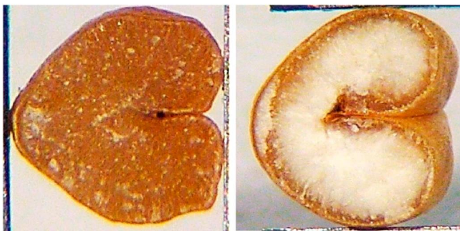
Slika 2. Poprečni presjek staklavog zrna (lijevo) i brašnavog zrna (desno), (Baasandorj i sur., 2015)

sadrži više škroba. Staklava zrna koja pri lomljenju ili rezanju daju veći otpor nazivaju se "tvrda" pšenična zrna, dok brašnava daju manji otpor i ona se smatraju "mekim" pšeničnim zrnom. Staklavost zrna je jedan od najznačajnijih čimbenika ocjenjivanja koji utječu na kvalitetu pšenice za krajnju upotrebu i učinak mljevenja. U staklastom endospermu, u usporedbi sa škrobnim endospermom, adhezija između skladišnih proteina i škrobnih granula je znatno jača, što rezultira gušće zbijenom strukturom (Baasandorj i sur., 2005).