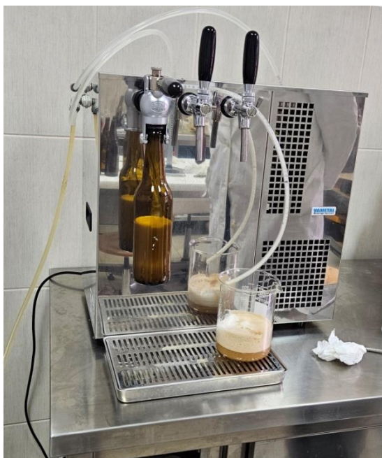
Slika 11 Punjenje gotovog piva u boce