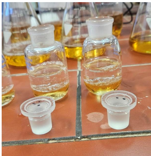
Slika 16 Određivanje gorčine

Pivo se centrifugira 15 minuta na 3000 o/min. U 10 mL izbistrenog piva bez CO 2 doda se 0,5 mL 6 N HCl-a, 20 ml izo-oktana i staklene kuglice. Kivete mućkati 15 minuta u tresilici i centrifugirati 3 minute na 3000 o/min. Nastaju 2 sloja. Gornji sloj, u kojem su izdvojene gorke tvari, se otpipetira u kvarcne kivetice. Spektrofotometrom na 275 nm izmjeriti ekstinkciju izo-oktanskog ekstrakta u odnosu na izo-oktan (slijepa proba).