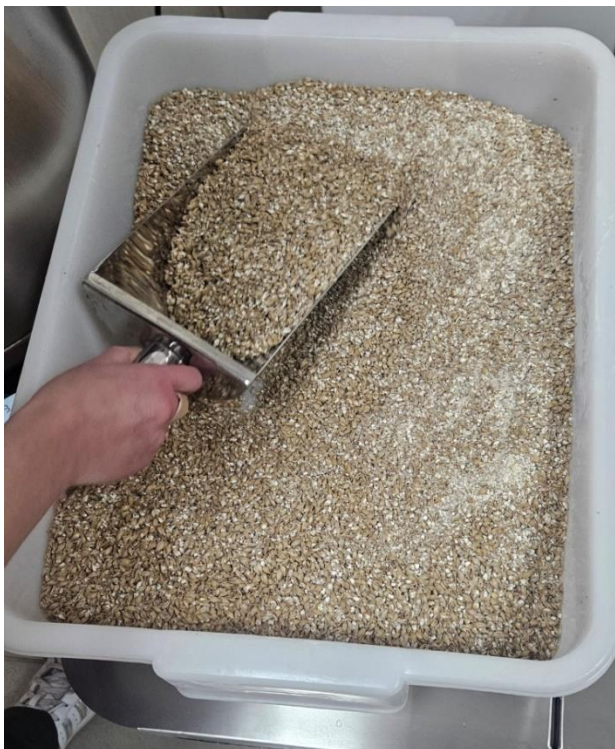
Slika 4 Ječmeni slad "Best Pale Ale"

Kada se kaša od ječmenog slada i vode zagrijavaju na temperaturi od oko 60 °C, enzimi slada, uglavnom amilaze, ali i proteaze, razgrađuju škrob i proteine, što dovodi do nastanka mješavine šećera i peptida ili aminokiselina (Aroh 2018). Tradicionalno, ukomljavanje započinje na 45 °C. Na ovoj temperaturi aktiviraju se proteaze koje razgrađuju proteine na kratke peptide i aminokiseline, koji će tvoriti glavni izvor dušika za kvasce tijekom fermentacije. Na 62-64 °C, škrob želatinizira i postaje pristupačan amilazama. Beta-amilaze odcijepuju maltozu od molekula škroba. Kaša se zatim zagrijava na 72 °C 15-25 minuta, omogućujući razgradnju dugolančanih polisaharida alfa-amilazama. Zagrijavanjem na 78 °C, zaustavljaju se gotovo sve enzimske aktivnosti (Thesseling i sur. 2019). Završetkom ukomljavanja trop se ispiru pripremljenom vodom i sladovina se cijedi kroz filter ploču. Ispiranjem tropa pospješuje se iskorištenje šećera u sladovini, a zaostali trop, nusproizvod, može poslužiti u ishrani stoke.