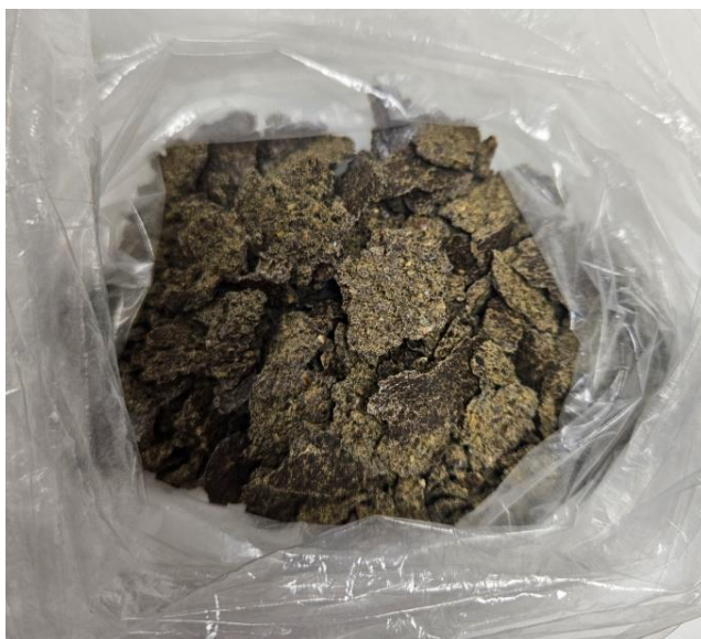
Slika 7 Pogača industrijske konoplje