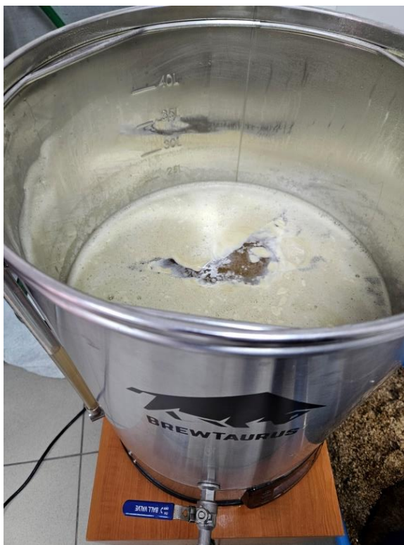
Slika 5 Sladovina nakon uklanjana tropa