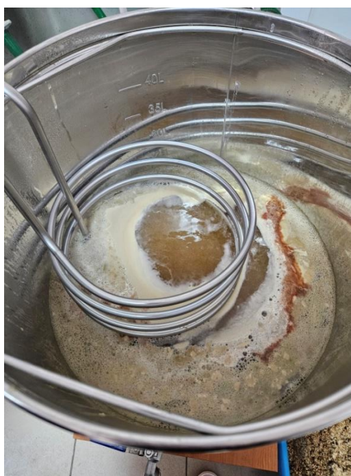
Slika 8 Hlađenje na temperaturu inokulacije

Kako bi se proces fermentacije bolje pratio, nakon kuhanja i hlađenja uzima se uzorak u kojem se određuje ukupna količina fermentabilnih šećera, na uređaju EasyDens, koja je iznosila 11,7 °P. Na temelju ove vrijednosti mogla se pretpostaviti očekivana količina alkohola u pivu nakon fermentacije.