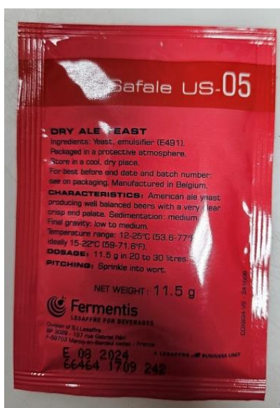
Slika 9 Kvasac

Fermentacija se provodi pri 25 °C. Proces završava kada u otopini više nema fermentabilnih šećera, otprilike nakon 5-7 dana. Nakon 7 dana uzet je uzorak za analizu prevrelosti. Dobivena vrijednost iznosila je 3.9 °P. Pravi stupanj prevrenja je mjera pretvorbe ekstrakta iz sladovine u CO 2 i alkohol. Kada prividni stupanj ekstrakta dostigne 66-68 % za svijetlo, odnosno 60 % za tamno pivo, glavno vrenje završava tj. mlado pivo se hladi i prebacuje u ležne tankove. Mlado pivo ima neprijatan i specifičan miris po kvascu. Sadrži oko 10 % od ukupno fermentabilnih šećera iz sladovine. Zbog niskog sadržaja CO 2 reskost je slabo izražena. Mlado pivo je visoke mutnoće zbog prisustva suspendiranih stanica kvasca i hladnog proteinskog taloga iz sladovine (Mastanjević 2024).