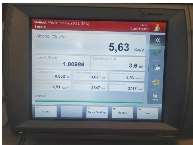
Slika 14 Prikaz rezultata izmjerenih na uređaju DMA 4500 M