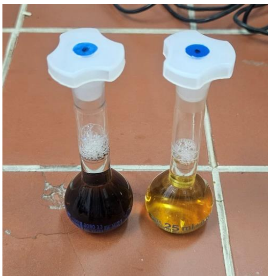
Slika 17 Određivanje ukupnih polifenola