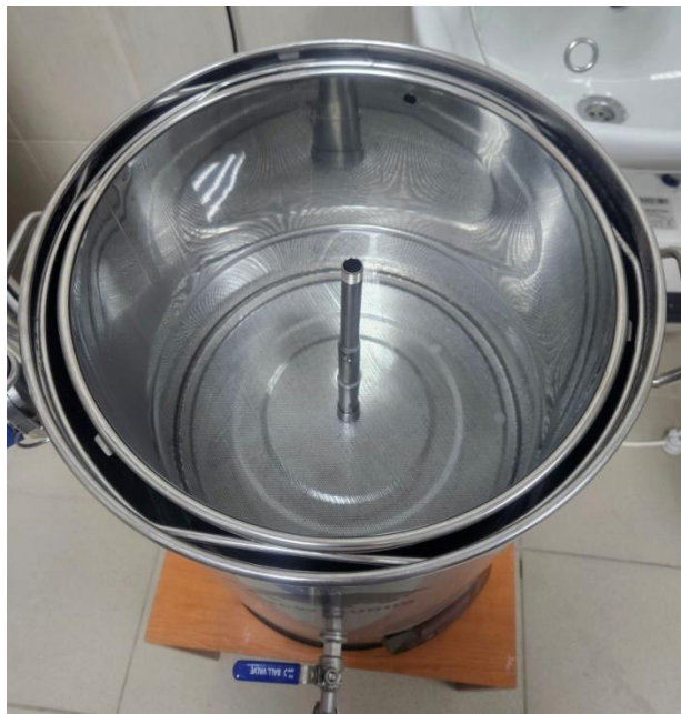
Slika 2 Postavljanje sita i mrežica

dijelu fermentacije kisik je potreban kvascima za rast biomase. Ukomljavanje se provodi na 69 °C kroz 60 minuta.