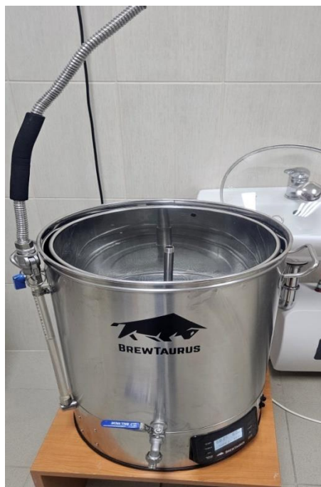
Slika 1 Brewtaurus uređaj za kuhanje piva

U Brewtaurus uređaj ( slika 1 ) ulije se 23 L destilirane vode u koju se doda odgovarajuća količina soli kako bi se postigao pH karakterističan za ukomljavanje pale ale piva: 1,5 g CaSO 4 , 5 g CaCl 2 , 4 g MgSO 4 , 2,5 g NaHCO 3 , 2,5 g CaCO 3 . Dio vode odvoji se za ispiranje tropa i u nju se također dodaju odgovarajuće količine soli: 0,35 g CaSO 4 , 1,1 g CaCl 2 , 0,9 g MgSO 4 , 0,55 g NaHCO 3 , 0,55 g CaCO 3 . Voda se zagrijava na temperaturu od 69 °C kroz 60 minuta.