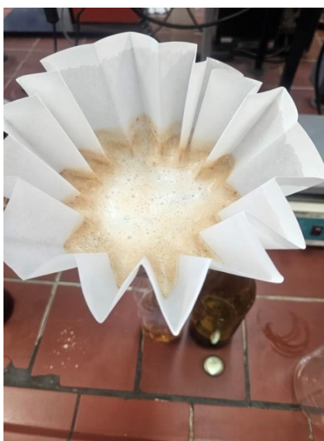
Slika 12 Filtiranje piva

Analiza fizikalno-kemijskih karakteristika provedena je u laboratoriju Osječke pivovare. Prije provođenja ispitivanja pivo je filtrirano pomoć dijatomejske zemlje i filter papira ( slika 12 ). Provedeno je određivanje udjela alkohola, boje, gorčine, pH vrijednosti i ukupnih polifenola.