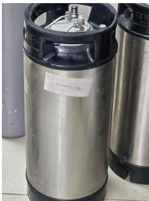
Slika 10 Keg

Pivo je nakon fermentacije pretočeno u keg ( slika 10 ) i stavljeno na hlađenje 3 dana na 2-4 °C. Ohlađeno pivo se gazira pomoću CO 2 u kegu pod tlakom od 2.5 bara. Keg je metalna cilindrična posuda sa ventilom na vrhu. Ventil se spaja na cijev koja ulazi u bačvu, a služi za čišćenje, izlazak CO 2 iz bačve pri punjenju te izlaz piva iz bačve prilikom potrošnje. Danas se proizvode u volumenima od 7 L do 100 L (Mastanjević 2024). Gazirano pivo se puni u tamne staklene boce ( slika 11 ). Kontrolno pivo proizvedeno je na isti način, ali bez dodatka pogače konoplje.