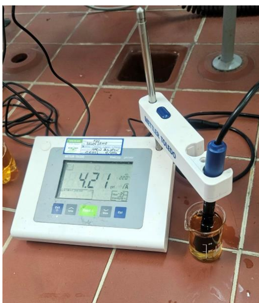
Slika 15 pH metar

pH metar (slika 15) je analitički instrument za određivanje pH vrijednosti. Uzorak se prethodno miješa na mješaču kako bi se uklonio prisutan CO 2 . U uzorak se uroni elektroda pH metra i pritisne se tipka "Read". Kroz par minuta na zaslonu uređaju prikaže se izmjerena vrijednost. Elektrodu je prije i nakon mjerenja potrebno isprati destiliranom vodom.