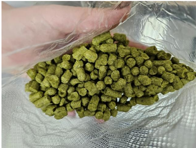
Slika 6 Hmelj