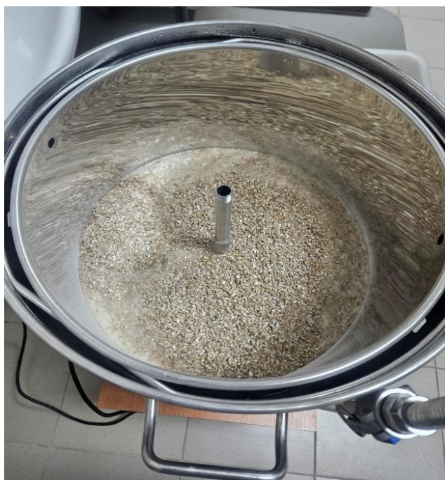
Slika 3 Ukomljavanje (izvor: privatna arhiva)