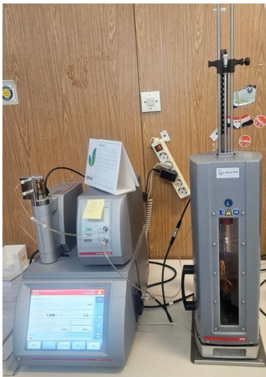
Slika 13 Uređaj DMA 4500 M za analiziranje piva

Za određivanje se koristio uređaj DMA 4500 M, Beer Analyser, tvrtke Antona Paara ( slika 13 ). Profiltrirani uzorak postavlja se u prostor za bocu na analizatoru piva. Pomoću igle za uzorkovanje, uzorak se provuče kroz uređaj te se izmjere zadani parametri.