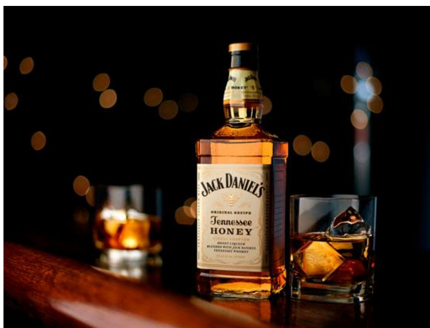
Slika 14. Viski sa medom – Jack Daniel's Honey

Jack Daniel's je jednog od najpoznatijih vrsta viskija, prepoznatljiva po četvrtastoj Boci i crnoj etiketi. Proizvodi se u Linčburgu, Tenesi, SAD, OD Jack Daniel's Distillery osnovane 1866. godine u istoimenom mjestu. Tenesi viski se filtrira kroz ugalj od javorovog šećera, skladišti u velikim drvenim buradima za brže zrenje. Novi proizvod iz porodice Jack Daniel's sadrži prirodni med iz Tenesija. JD Tennessee Honey predstavlja najuspješniji novi proizvod na globalnom tržištu alkoholnih pića. Njegova prodaja je za samo tri godine prestigla milijuna devetolitarskih kartona.