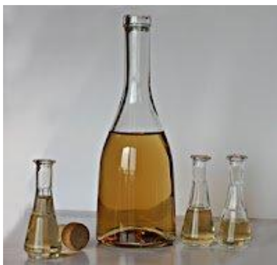
Slika 13. Medena rakija