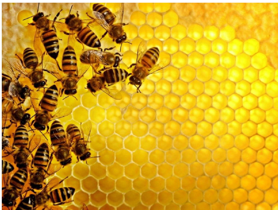
Slika 2. Apis mellifera

Med je nutritivno sladilo sastavljeno od brojnih šećera , uključujući i fruktoze ( 38 % ), glukoza ( 31 % ), maltoza ( 7,2 % ) i saharoze ( 1,5 % ). Med je više gust od svog najbližeg konkurenta, šećera od šećerne trske koja je 100 % saharoza. Žlica meda ima 64 kalorija, u odnosu na 46 kalorija za šećer. No, med je gotovo dvostruko slađi od šećera, čime može proći s manje kalorija za istu slatkoću, a ima i bogatiji osjećaj u ustima. Med ima glikemijski indeks 55, nešto zdraviji u odnosu na 61 za šećer.