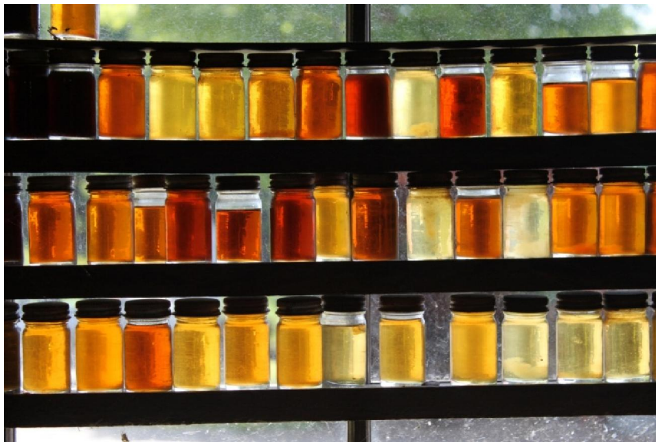
Slika 3. Vrste meda