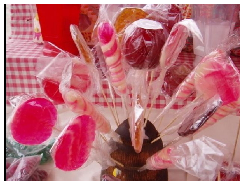
Slika 10. Lizalice sa medom

Lizalice često koriste med kao zaslađivač i vezivo. Sastojci su sjeckani na različite veličine i pomiješani s vrućim medom i šećerom. Ovisno o sastavu i stupnju zagrijavanja šećera (ključujući med), manje ili više kruti produkt dobije se nakon hlađenja. U svakom slučaju, svi takvi proizvodi su prilično higroskopi i trebaju biti pakirani materijalom nepropusnim za vlagu.