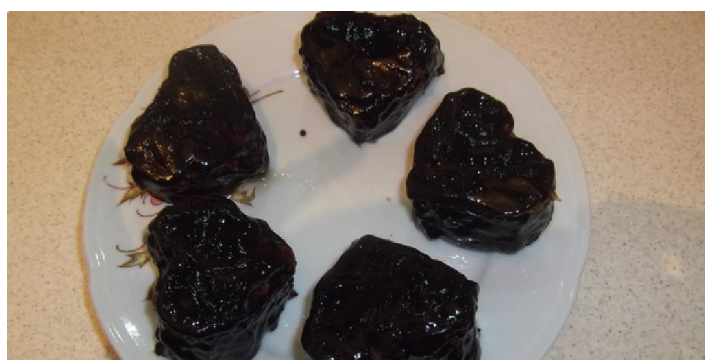
Slika 10. Medeno srce