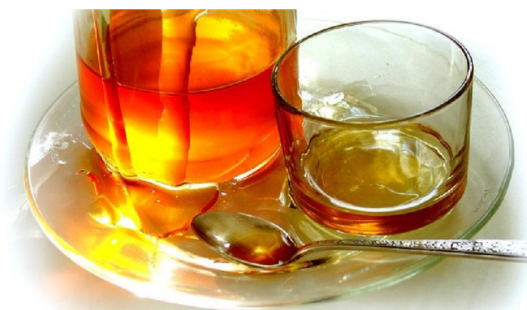
Slika 13. Medovina

Medovina ili gverc, gverc je vino od meda pored medene rakije (Medica - medena rakija proizvedena u Međimurju, medenica, medovača) najvjerojatnije jedno od najstarijih alkoholnih pića koje je čovjek konzumirao. Medovinu dobijemo fermentacijom otopine prirodnog meda koji bi trebao biti što tamnije boje (medljika, kesten...) da dobijemo što tamniju boju. Postupak je isti kao i kod proizvodnje vina od grožđa. Proizvodi se kao alkoholno, obično oko 13-14% alkohola ali i kao bezalkoholno piće. Kvaliteta obje vrste ovisi o kvaliteti meda, samom postupku prilikom fermentacije i skladištenja i grožđu. Medovina je poznato piće koje popravlja krvnu sliku, okrepljuje organizam, poboljšava apetit i usporava starenje organizma. Piće starih anglosaksonaca bila je mješavina vode i saća sa medom nastala vrenjem u glinenoj posudi u koju su se radi arome dodavale razne trave. Ni naši preci, stari Sloveni, nisu tu zaostajali sa medovinom