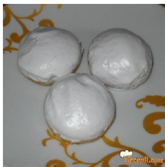
Slika 9. Mekani medenjaci