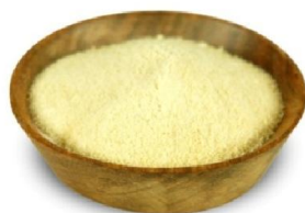
Slika 15. Sušeni med

Smjesa Torte, kruha i pića ili zdravih energijskih prašci koriste sušeni ili dehidrirani med. Drugačije primjene su u kozmetici i alkoholnim pićima, pri čemu je nepoželjan dodatni sadržaj vode ili gdje korištenje tekućina povećava troškove proizvodnje.