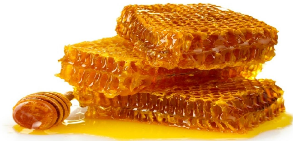
Slika 4. Med u saću

c) PEKARSKI MED – je med koji se koristi u industriji ili kao sastojak hrane koja se potom prerađuje i može: