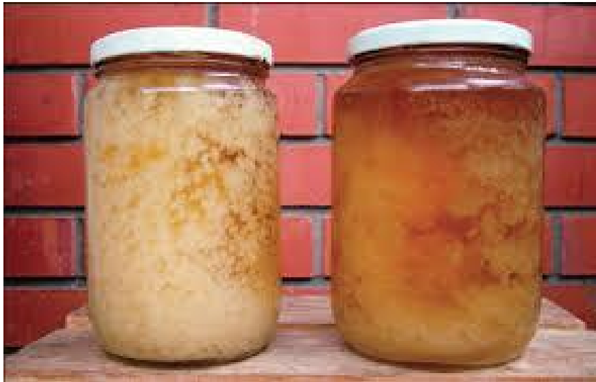
Slika 16. Kristalizacija i dekrizalizacija meda

Mikrovalovi imaju ograničen energetska potencijal pa ne uzrokuju promjene u strukturi tvari - njihove molekule titraju i međusobno se taru što uzrokuje samo porast temperature, a taj je efekt iskorišten u mikrovalnim pećnicama za kuhanje i sušenje. Molekule vode, masti i ugljikohidrata apsorbiraju energiju mikrovalova tijekom dielektričnog zagrijavanja.