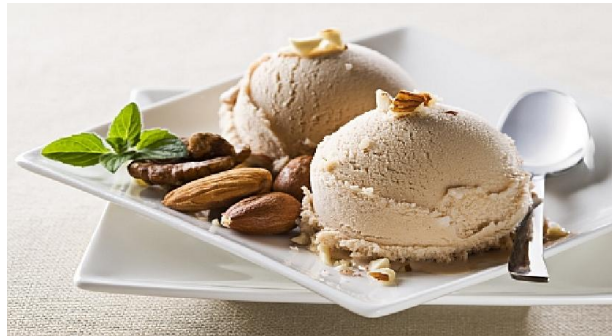
Slika 11. Sladoled s okusom lješnjaka zaslađen medom

Sladoled zaslađen medom nikad nije imao komercijalni uspjeh (osim u Italiji), budući da je lakše topiv i na nižim temperaturama od onih sa šećerom. Ova razlika otežava distribuciju sladoleda izrađenih od različitih sladila zajedno. U drugim zemljama, sladoledi na bazi meda se uspješno prodaju kada je pakiran pojedinačno ili pakovanje od 0,5 do dvije litre. Dodavanje više od 7,5 % meda značajno omekšava sladoled, zbog svoje niže točke smrzavanja.