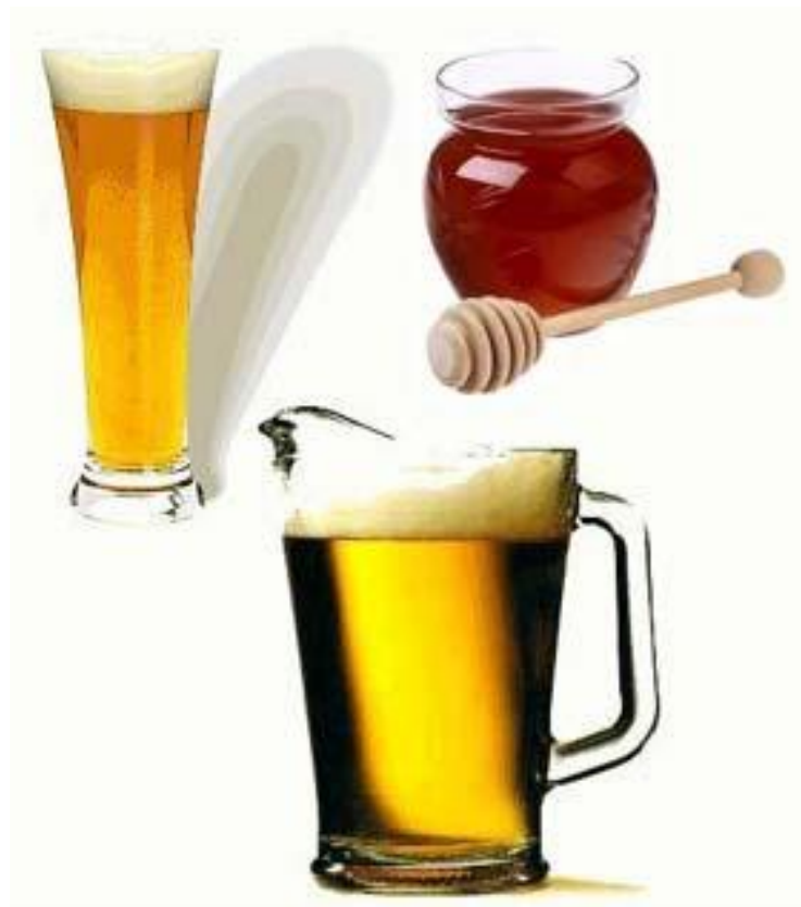
Slika 12. Pivo sa medom

oštrije od ostalih vrsta piva, a med mu daje boju, aromu, gustinu i punoću. Za piva od trava, začina, blijeda engleska piva, tamna engleska piva, jaka i tamna piva, svijetla piva i suha piva preporučljiv je svijetli med od djeteline koji će dati blag ukus; za engleska bijela piva, voćna piva i piva od začina treba uzeti med od maline ili kupine koji će dati delikatan ukus, a za jaka, tamna piva i crna piva pravi izbor je med od heljde. Posebna piva su ona kod kojih posebni dodaci, uključujući med, melasu, karamel, čokoladu i drugo, daju karakterističnu notu. U tom slučaju med je u 23 litara zastupljen sa 1,2 kilograma. Mnogi pivari teže zadržavanju karakteristične arome i ukusa meda kao dopunu ostalim aromama u svojim pivima. Izbor arome je veoma subjektivan. Različite tehnike vrenja, razne vrste kvasaca, slada, aditiva, hmelja, trava i začina, zajedno sa raznim vrstama meda daju mogućnost spravljačima piva da iznova nalaze nove recepte. Nježna aroma meda daje bolji ukus engleskom svijetlom pivu ili laganom njemačkom pivu u koncentraciji od 3 do 10%. Na Zapadu komercijalno najdostupnije vrste meda, kao što su med od djeteline, lucerke, cvijeta narandže, žalfije i poljskog cvijeća u pivu imaju veoma blagu aromu i ukus. Već 11 pa do 30% meda u pivu razviti će primjetnu notu arome meda, a preko 30% ukus meda će dominirati nad ostalim sastojcima.