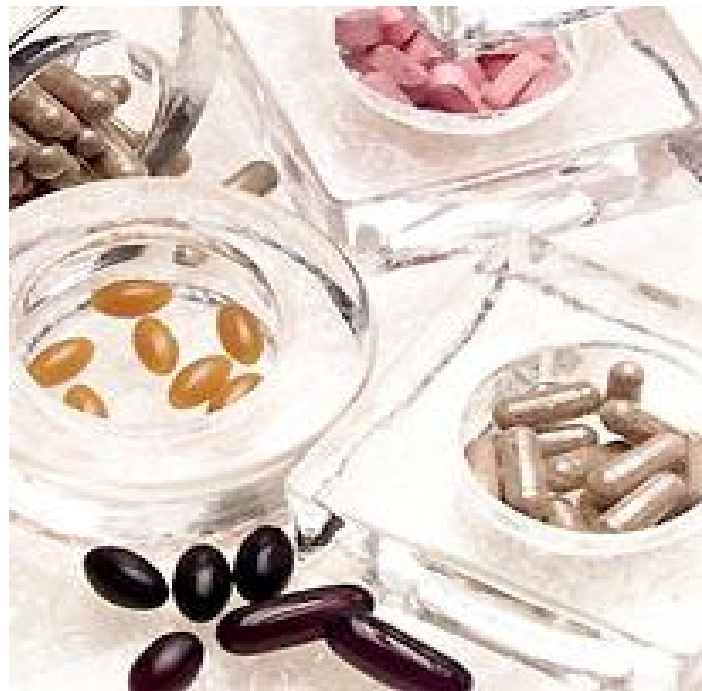
Slika 15. Med u lijekovima

ubrzavanje angiogeneze, tj. stvaranje granulacija, smanjivanje rizika od infekcija, smanjivanje bolova, neugodnih mirisa te broja potrebnih prevoja. Med isušuje ranu stvarajući uvjete koji ne pogoduju razvoju mikroorganizama. Tekući medicinski med dobro ispunjava dublje defekte tkiva, a aplicira se prije Vivamel alginatne obloge s dodatkom meda. Također, dobro hrani i štiti novonastali epitel, pa se svježe epitelizirana rana može zaštititi slojem medicinskog meda. 6