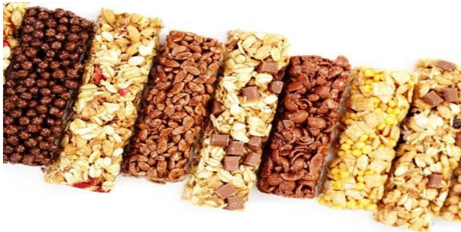
Slika 9. Integralne pločice žitarica sa medom

Energetske pločice od integralnih žitarica, bile same u pakovanju ili u obliku pločica, mogu sadržavati veliki broj kalorija. Iako je doručak najvažniji obrok u danu i u pravilu ga možemo jesti bez grižnje savjesti, ovakvim žitaricama svako jutro možemo unijeti u organizam i do 600 kalorija. Većina ih ima previše šećera i visokofruktoznog kukuruznog sirupa, a vrlo malo vlakana. Kao alternativu, pripravite sami svoje žitarice ili pločice. Stavite omiljeno orašasto i svježe voće, dodajte malo sjemenki i prelijte medom. Potom ispecite smjesu.