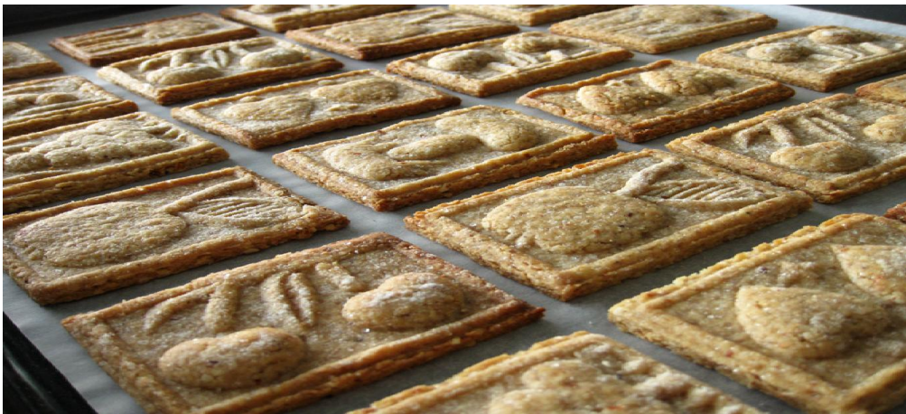
Slika 11. Paprenjaci

A. Šenoa, Zlatarovo zlato , Mladost, Zagreb, 1973., str. 6.