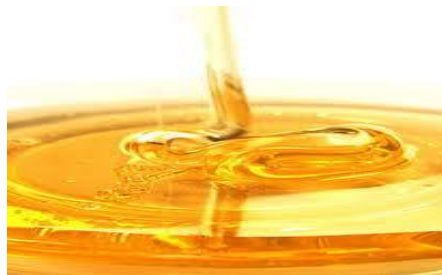
Slika 1. Med