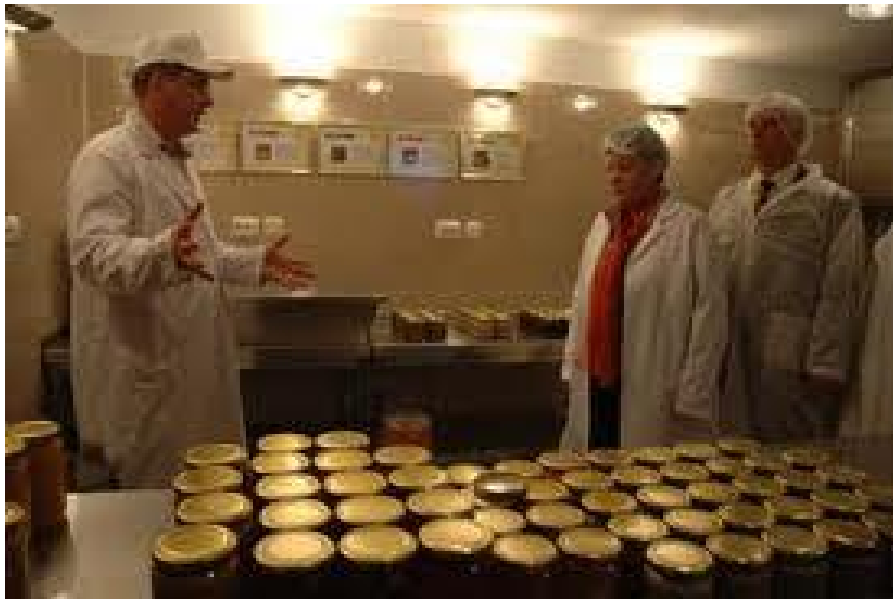
Slika 7. Pakiranje i čuvanje meda

pribor, već npr. plastični, drveni, porculanski. Za skladištenje meda koriste se inox posude za prehrambenu industriju.