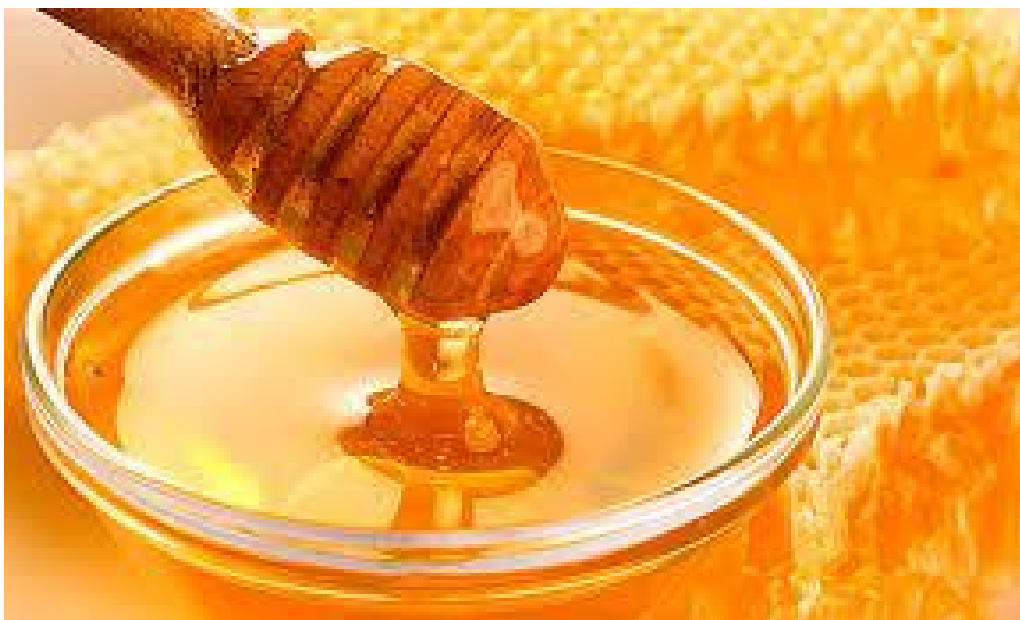
Slika 5. Pekarski med