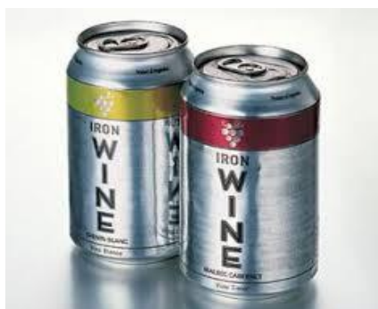
Slika 7. Limenke od Al ( http://www.vino.rs/vesti/item/877-vino-u-konzervi.html )