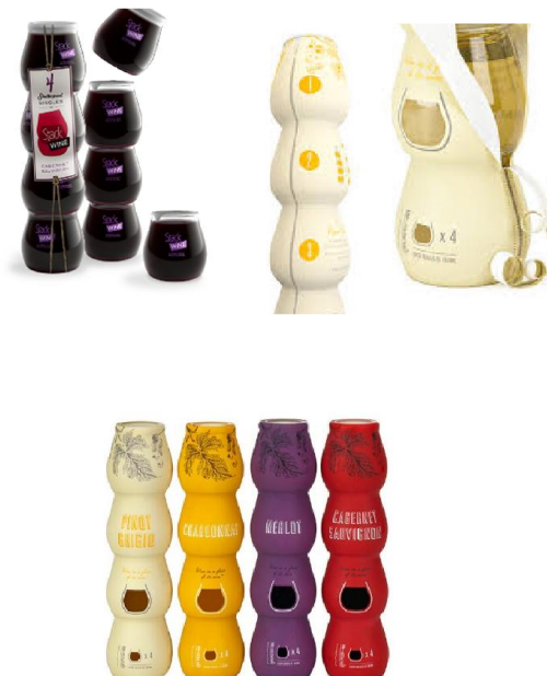
Slika 8. Četiri čaše ( http://drinkstack.com/ )

Nedavno su se na tržištu pojavio nov način pakiranja vina, četiri plastične čaše (slika 8) koje čuvaju vino od oksidacije i kvarenja, a više nije potreban ni otvarač. Vino je natočeno u četiri čaše koje su izrađene od kvalitetne plastike koja čuva vino od oksidacije i kvarenja. Svaka čaša ima volumen od 187 ml pa tako zajedno čine prosječnu butelju od 750 ml. Zapakirane su sve zajedno, no ukoliko odvojite samo jednu čašu, nema nikakve štete za ostale jer svaka čaša ima svoj poklopac. Ovo je odlična ambalaža za odlazak na piknik ili kampiranje, nema brige oko čepova, otvarača ni otvaranja boce ( http://dobrahrana.jutarnji.hr/pakiranje-vina-za-festivale-i-izlete/ ).