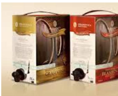
Slika 5. bag-in-box ambalaža ( http://www.pporahovica.hr/Bag-in-Box-g34.aspx )

Bag-in-box (slika 5), jekutija s grlicem kroz koji se sadržaj puni i prazni, a unutrašnjost je obložena plastičnom vrećicom. Bag-in-box ima sve veću potražnju među kupcima i bilježi rast prodaje u cijelom svijetu zbog mnogobrojnih prednosti u odnosu na staklene boce. Prije svega ambalaža je lakša 30% a samim time i jeftinija što utječe i na cijenu proizvoda. Ovakvo pakiranje pruža potpunu zaštitu od oksidacije. U Bag-in-box pakiranju vino ostaje svježije i do 6 tjedana nakon otvaranja, ambalaža je jednostavna za otvaranje i služenje, a veoma je praktična i za transport, čuvanje i odlaganje. Nedostatak ovakve ambalaže je kratko vrijeme skladištenja vina ( http://www.pporahovica.hr/Bag-in-Box-g34.aspx )