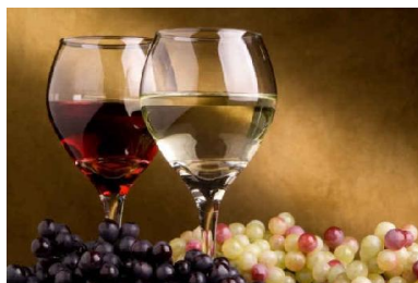
Slika 2. Vino u čaši

Vino (slika 2.) je alkoholno piće dobiveno fermentacijom soka grožđa. U procesu fermentacije kvasci transformiraju šećere iz grožđa u alkohol stvarajući CO 2 i toplinu. Fermentacija je jedan od najvažnijih procesa u proizvodnji vina, može biti aerobna i anaerobna.