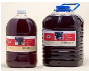
Slika6. Plastične boce ( http://www.plesivica.hr/stolnavina )