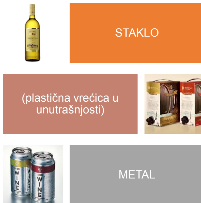
Slika 3. Materijali za pakiranje vina

Ove vrste ambalaže trebale bi zaštititi vino od promjena tijekom cijelog vijeka trajanja.