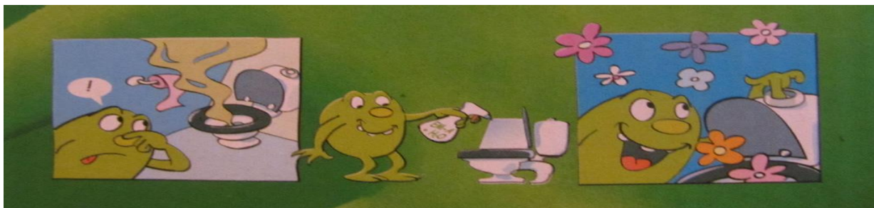
Slika 2. EM uklanjaju neugodan miris

Gradski kontejneri u kojima se odlaže otpad iz kućanstava idealno su stanište za sulfid-reducirajuće bakterije koje su glavni uzročnici pojave neugodnih mirisa amonijaka i sumporovodika ( \text{NH}_3 i \text{H}_2\text{S} ). Neugodni mirisi iz kontejnera osobito su intenzivni u ljetnim mjesecima te predstavljaju veliki problem. Sakupljanje i odvoz komunalnog otpada obavlja se vozilima za komunalni otpad jednom ili dva puta tjedno. Takav otpad se odvozi i zbrinjava na odlagalištu otpada. Kako bi se spriječila pojava neugodnih mirisa iz kontejnera i vozila za komunalni otpad predlaže se primjenu EM. Fermentativni mikroorganizmi potiskuju sulfid-reducirajuće bakterije koje stvaraju većinu neugodnih mirisa te one više nisu u stanju proizvoditi sumporovodik. ( http://www.emtehri.com/view.asp?idp=7&c=3 , 2015.).