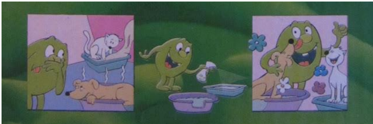
Slika 4. Tretiranje pijeska za životinje sa EM

U pijesak za životinje (mačke, pse) pri svakoj zamjeni potrebno je dodati 20 crvenih keramičkih perli ili jednom tjedno pijesak poprskati otopinom EM .U slučaju ponovne pojave neugodnih mirisa, ovaj tretman treba provoditi učestalije dok ta pojava ne nestane. Na taj će način vaši ljubimci boraviti u zdravom okruženju, bez neugodnih mirisa i najezdi bolesti ili parazita.