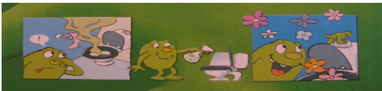
Slika 2. EM uklanjaju neugodan miris

Gradski kontejneri u kojima se odlaže otpad iz kućanstava idealno su stanište za sulfid-reducirajuće bakterije koje su glavni uzročnici pojave neugodnih mirisa amonijaka i sumporovodika ( \text{NH}_3 i \text{H}_2\text{S} ). Neugodni mirisi iz kontejnera osobito su intenzivni u ljetnim mjesecima te predstavljaju veliki problem. Sakupljanje i odvoz komunalnog otpada obavlja se vozilima za komunalni otpad jednom ili dva puta tjedno. Takav otpad se odvozi i zbrinjava na odlagalištu otpada. Kako bi se spriječila pojava neugodnih mirisa iz kontejnera i vozila za komunalni otpad predlaže se primjenu EM. Fermentativni mikroorganizmi potiskuju sulfid-reducirajuće bakterije koje stvaraju većinu neugodnih mirisa te one više nisu u stanju proizvoditi sumporovodik. ( http://www.emtehri.com/view.asp?idp=7&c=3 , 2015.).