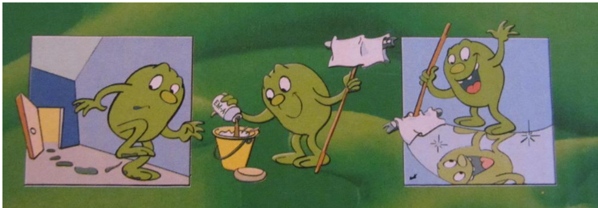
Slika 1. Čišćenje upotrebom EM ( http://chilesinstockholm.blogspot.hr/2012/09/effective-microorganisms.html )

( http://www.emtehri.com/view.asp?idp=7&c=3 , 2015.).