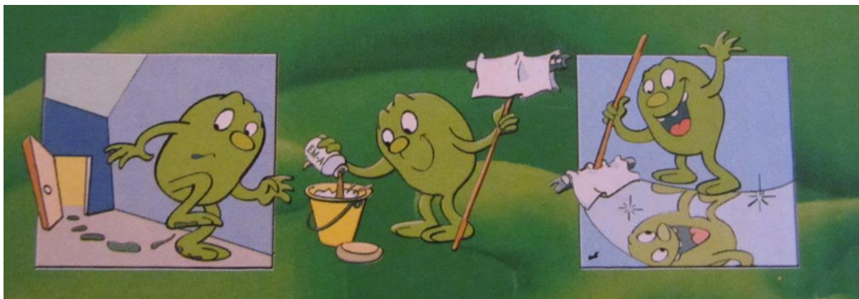
Slika 1. Čišćenje upotrebom EM ( http://chilesinstockholm.blogspot.hr/2012/09/effective-microorganisms.html )

( http://www.emtehri.com/view.asp?idp=7&c=3 , 2015.).