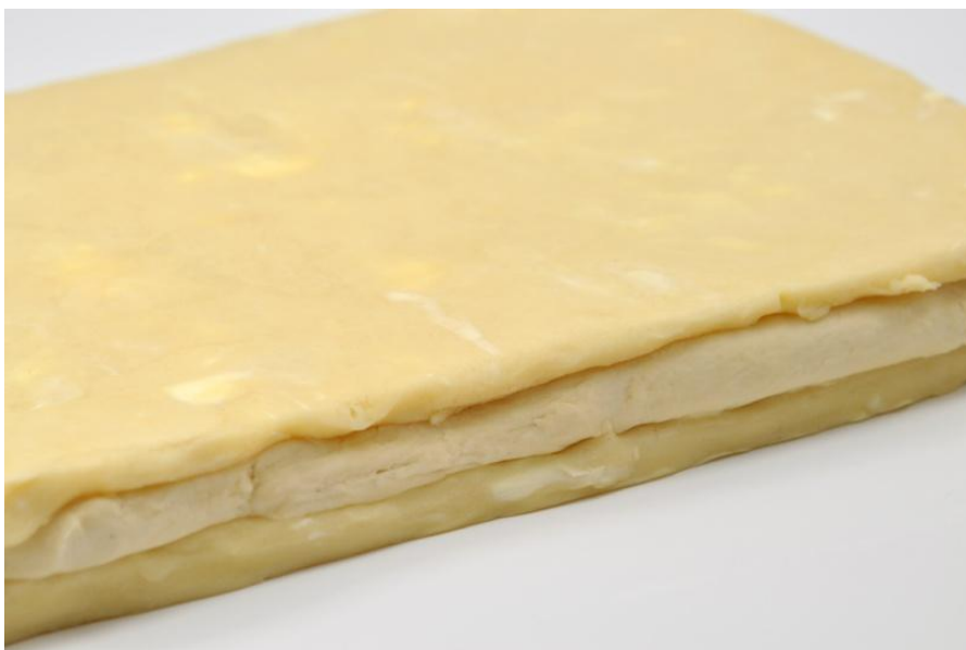
Slika 4. Francuski način ugradnje masnoće u tijesto ( http://www.chefeddy.com/2011/03/inverse-puff-pastry/ )