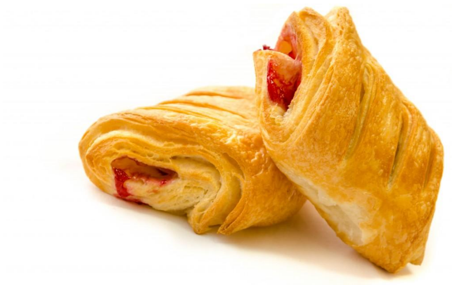
Slika 14. Pečeni nadjevni proizvod od zamrznutog lisnatog tijesta ( http://www.manna.hr/nasi-proizvodi/ )