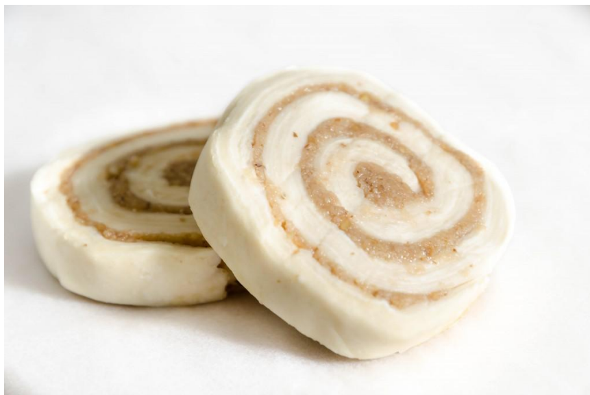
Slika 13. Zamrznuti komadi nadjevenog lisnatog tijesta

koje možemo utjecati su temperatura zamrzavanja, kontrola temperatura, brzina strujanja zraka u zamrzivaču i početna temperatura tijesta. (Kulp K., Lorenz K., Brümmer J., 1998.)