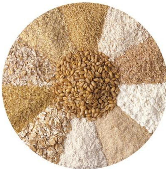
Slika 1. Različiti stupnjevi meljave i miješanja pšeničnog brašna

( http://www.tandfonline.com/doi/full/10.1080/10408398.2014.928259 )