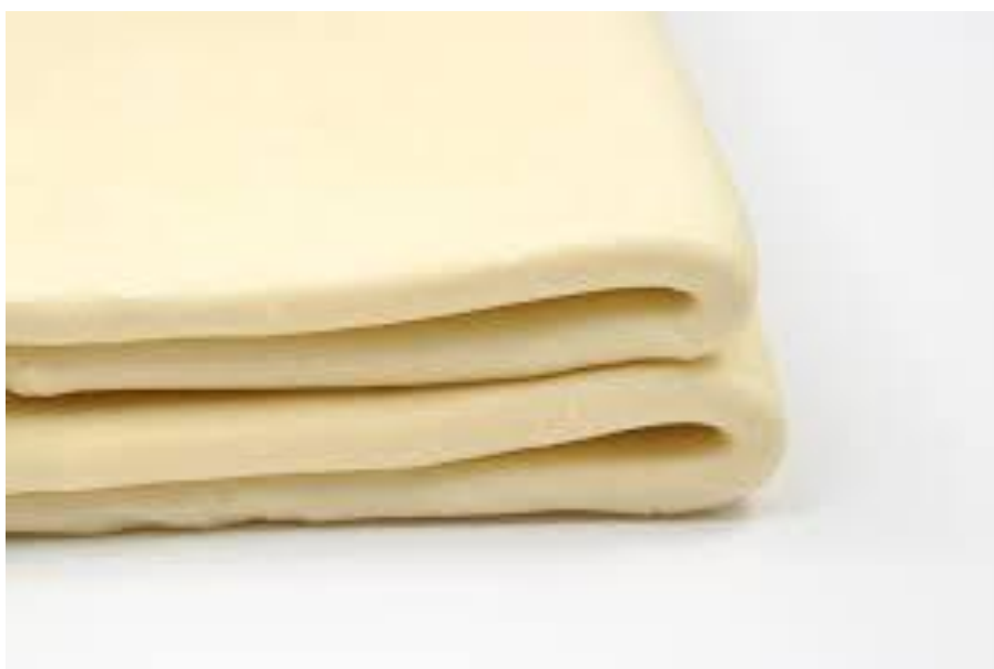
Slika 8. Dvostruko preklapanje ( http://www.chefeddy.com/2011/03/inverse-puff-pastry/ )