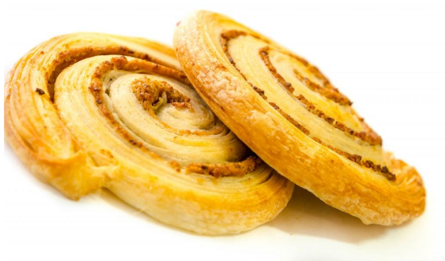
Slika 15. Pečena mini orahnjača od lisnatog tijesta ( http://www.manna.hr/nasi-proizvodi/ )