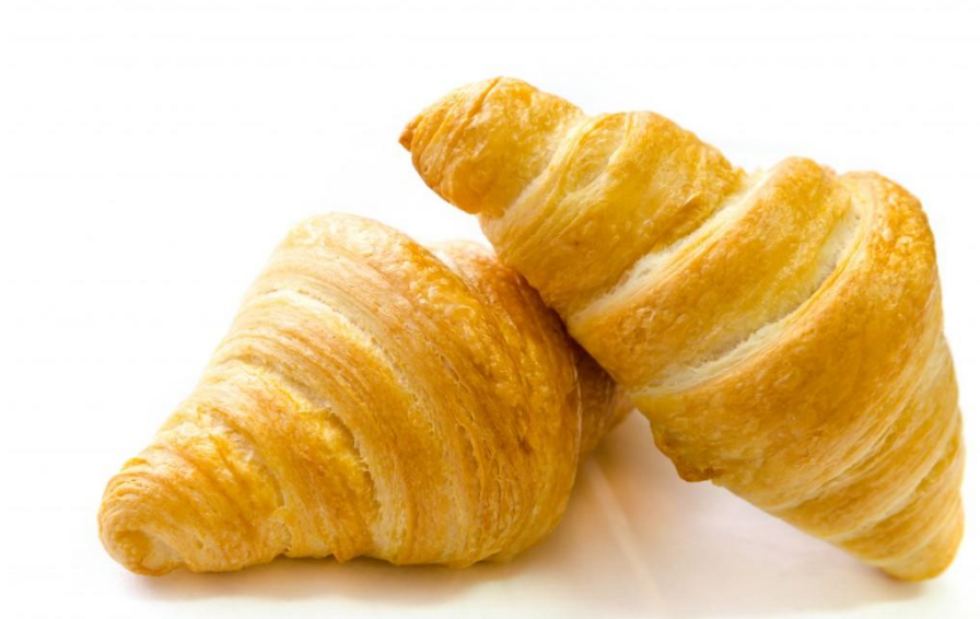
Slika 5. Pečeni proizvod od lisnatog tijesta

Unatoč visokom udjelu masnoća, lisnati proizvodi ne ostaju dugo svježi, naročito ako je masnoća za listanje margarin. On se na niskim temperaturama ukrti, pa proizvodi poprime stariji izgled, te djeluju masno i ljepljivo. (Albrecht, T., i sur., 2010.)