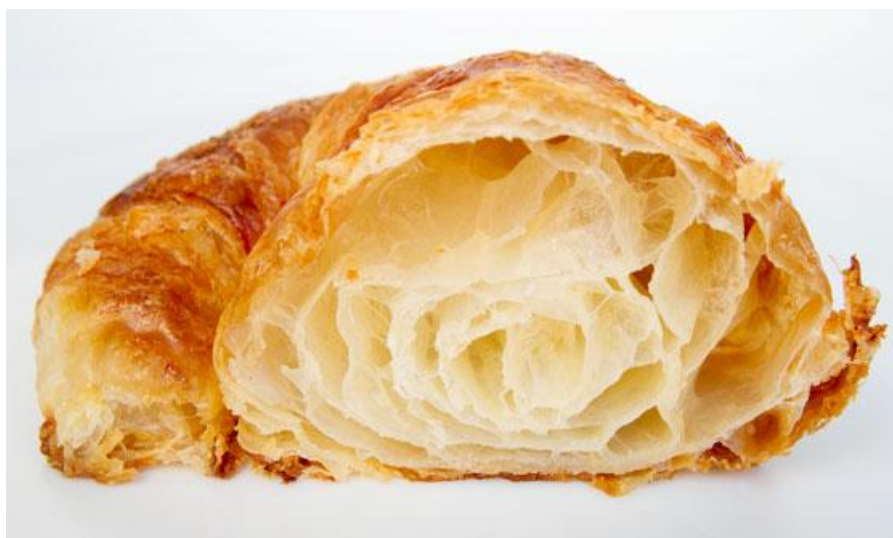
Slika 2. Struktura unutrašnjosti lisnatog proizvoda

Listanju tijesta pridonosi samo manji dio stvorene pare u osnovnom tijestu, iako za njenu tvorbu treba velika količina vode. Mekano tijesto, s većim udjelom vode, treba duže vremena za sušenje pojedinog sloja. Veća količina vode ne povećava bitno visinu proizvoda, pa je stoga potrebno uskladiti čvrstoću tijesta s masnoćom za listanje. (Albrecht, T. i sur., 2010.)