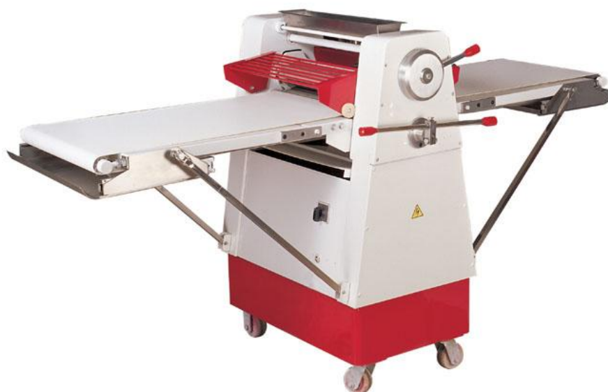
Slika 6. Stroj za turiranje tijesta

Drugi prolaz predstavlja ponavljanje procesa valjanja tijesta iz prvog prolaza. Tijesto se ponovo jednostavno preklapa. Prilikom svakog stanjivanja tijesta, valjci na stroju za turiranje namještaju se na određenu debljinu. Tijesto između valjanja odlažemo na opuštanje na hladno. (Schünemann C., Treu G., 2012.)