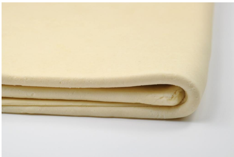
Slika 7. Jednostavno preklapanje tijesta ( http://www.chefeddy.com/2011/03/inverse-puff-pastry/ )