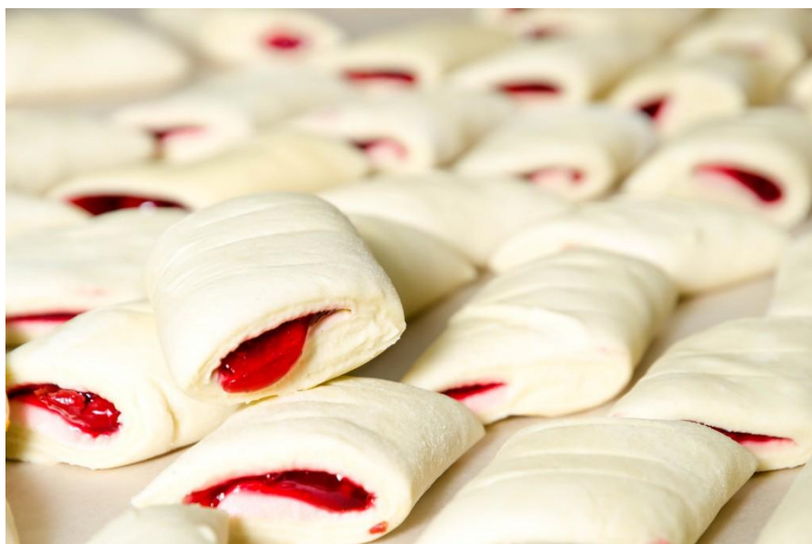
Slika 12. Zamrznuto lisnato tijesto punjeno slatkim od višnje

Fermentirano zamrznuto tijesto, koje ne zahtjeva fermentaciju između vremena čuvanja u zamrznutom stanju i pečenja (suprotno od nefermentiranog tijesta) može se staviti u pećnicu tek nakon odmrzavanja. Za kvasne proizvode, vrijeme izlaska iz peći je znatno duže nego kod beskvasnog lisnatog tijesta. U pripremi beskvasnog proizvoda, proizvođač / prodavač može brže odgovoriti na zahtjeve trgovca / kupca. Najočitija razlika između kvasnih proizvoda pripremljenih sa ili bez zamrzavanja je manji volumen proizvoda dobivenih od zamrznutog tijesta, posebice ako su zamrznuti bez fermentacije. (Kulp K., Lorenz K., Brümmer J., 1998.)