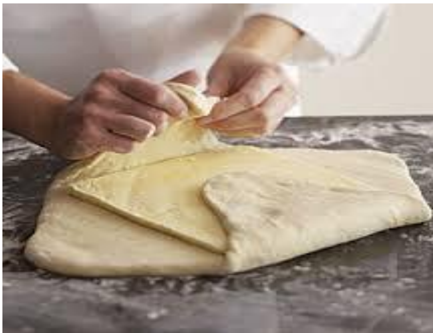
Slika 3. Njemački način ugradnje masnoće u tijesto ( http://www.finecooking.com/recipes/puff-pastry.aspx )