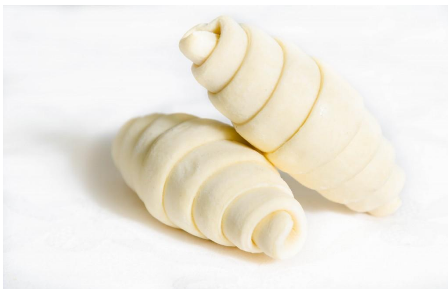
Slika 11. Zamrznute kroasane

Iz ekonomskih razloga, zamrznuto lisnato tijesto proizvodi se sa šećerom ili sezonskim punjenjem. Ova vrsta tijesta proizvodi se na posebnim linijama i distribuira se u zamrznutom stanju ili nakon djelomičnog, odnosno potpunog, odmrzavanja. Najbolji rezultati dobiju se uporabom potpuno odmrznutih jedinica. (Kulp K., Lorenz K., Brümmer J., 1998.)