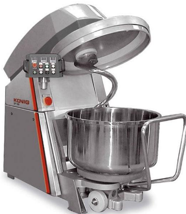
Slika 10. Mjesilica s pomičnom posudom

Iskustveno je ustanovljeno da vertikalni brzomiješajuće mjesilice s pokretnim zdjelama su idealne za proizvodnju tijesta za kroasane. Prema Rijkaartu (1984.) idealno je 1 minuta mijesenja bez pretjeranog razvoja gluten, uz daljnje razvijanje tijesta tijekom preklapanja. (Cauvain S. P., Young L. S., 1998.)