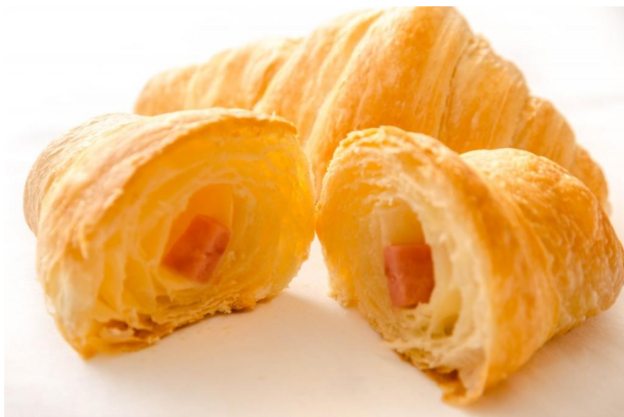
Slika 16. Pečeno lisnato tijesto nadjeveno šunkom ( http://www.manna.hr/nasi-proizvodi/ )